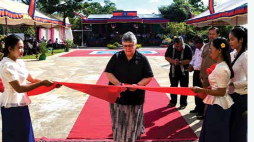
ពិធីសម្ពោធសាលាបឋមសិក្សានៃសន្តវិបសេ និងផ្ទះក្រុមបងស្រីខុស្សលីន ស្ថិតនៅក្នុងខេត្តបាត់ដំបង។