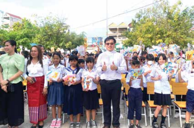
សិស្សានុសិស្ស នៃសាលាបឋមសិក្សាពញាក្រែក ក្នុងខណ្ឌបូស្សីកែវ។