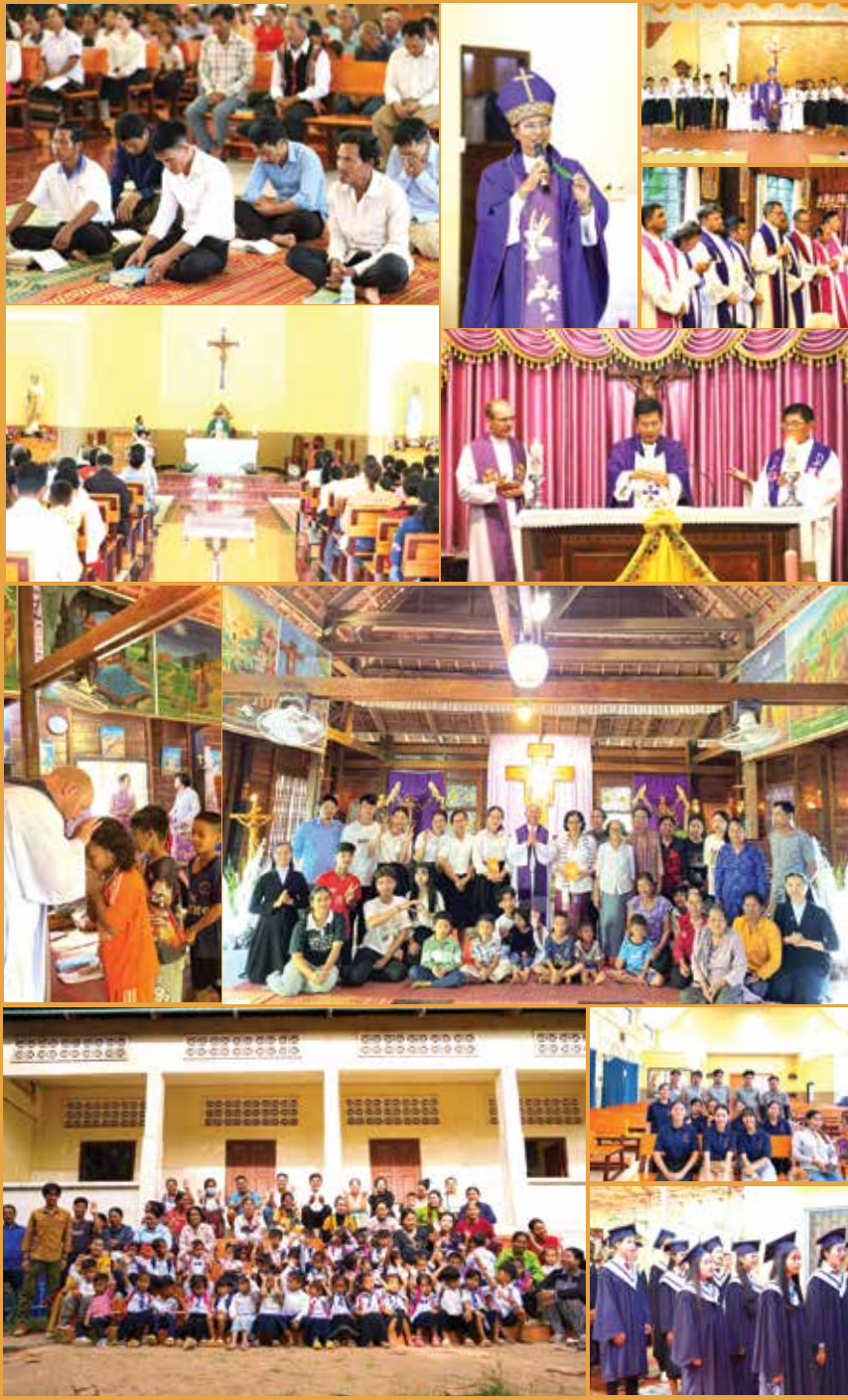
ព្រះសហគមន៍កាតូលិកភូមិភាគកំពង់ចាម