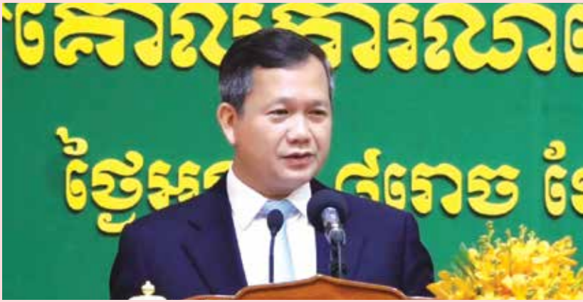
អគ្គបទដ្ឋាន អមិន្ទ ជាតិ

ប្រមុខរាជរដ្ឋាភិបាលកម្ពុជា បានប្រកាសឱ្យអនុវត្តជាផ្លូវការនូវគោលការណ៍ណែនាំនេះ នាថ្ងៃទី៥ ខែធ្នូ ឆ្នាំ២០២៣ ដែលជាបណ្តឹងនៃកម្មវិធីជាតិជំនួយសង្គម ដោយសំយោគកម្មវិធីដែលមានស្រាប់រួមផ្សំនិងកម្មវិធីថ្មីបន្ថែម ដើម្បីទ្រទ្រង់ជីវភាពប្រជាពលរដ្ឋដោយប្រកាន់គ្នាបន្តគោលការណ៍បរិយាបន្ន និងសមធម៌ ព្រមទាំងការរៀបចំការងារនូវការធ្លាក់ចុះយ៉ាងគំហុកនៃប្រាក់ចំណូលសម្រាប់គ្រួសារដែលមានបណ្តាសមធម៌ទាំងអស់ ក៏ដូចជាគិតគូរដល់សមាជិកគ្រួសារដែលរស់នៅជាមួយមេរោគនិងជំងឺអដស។ កម្មវិធីជាតិជំនួយសង្គមក្នុងកញ្ចប់គ្រួសារ