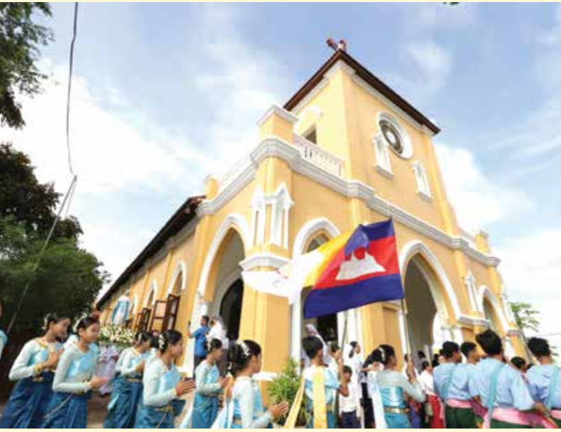
ពិធីបុណ្យឆ្លងព្រះវិហារ «ព្រះនាងម៉ារីជាមាតានៃព្រះសហគមន៍»។

នាថ្ងៃទី២៧ ខែវិច្ឆិកា ឆ្នាំ២០២៣ ក្រោមអធិបតីភាពលោកអភិបាលព្រះសហគមន៍កាតូលិក ទាំងបីភូមិភាគ បានរៀបចំពិធីបុណ្យឆ្លងព្រះវិហារ «ព្រះនាងម៉ារីជាមាតានៃព្រះសហគមន៍» នៅព្រះសហគមន៍តាម ក្នុងស្រុកព្រះនេត្រព្រះ ខេត្តបន្ទាយមានជ័យ។ ព្រះសហគមន៍កាតូលិកតាម កើតឡើងនៅឆ្នាំ១៨៨១ ព្រះវិហារនេះត្រូវបានកសាងឡើងនៅចន្លោះឆ្នាំ១៩១០-ឆ្នាំ១៩២០ ហើយត្រូវបានបំផ្លាញក្នុងអំឡុងពេលសង្គ្រាមរវាងឆ្នាំ១៩៧០ ដល់១៩៧៥។ នៅឆ្នាំ២០០៤ ព្រះសហគមន៍បានជួសជុលព្រះវិហារនេះជាបណ្តោះអាសន្ន ហើយបានជួសជុលឡើងវិញរហូតដល់ឆ្នាំ២០២១។