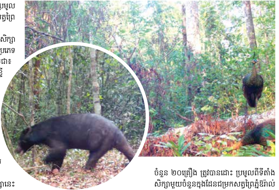
ដែលទទួលបានការឯកភាពពីក្រសួងបរិស្ថាននៅ ថ្ងៃទី១៧ ខែមិថុនា ឆ្នាំ២០២២»។ បើតាមក្រសួងបរិស្ថាន ម៉ាស៊ីនថតស្វ័យប្រវត្តិ

ស្វ័យប្រវត្តិចំនួន ២០គ្រឿង ត្រូវបានដោះ ប្រមូល ពីទីតាំងសិក្សាមួយចំនួនក្នុងដែនជម្រកសត្វព្រៃ ក្នុង ភូមិសាស្ត្រខេត្តពោធិ៍សាត់។ ប្រភពដែលថា ជាលទ្ធផលជាបឋម ការសិក្សា នេះបានរកឃើញ និងបញ្ជាក់ពីវត្តមានជាបន្តប្រភេទ សត្វព្រៃចំនួន ៧ប្រភេទ ក្នុងនោះមាន ដូចជា៖ ដំរីអាស៊ី ខ្លឹង ខ្លាពពក ខ្លាឃ្នុំធំ ប្រើសស្សី ខ្លឹ ន ឆ្កែព្រៃ ភ្លោក ដែលត្រូវបានកត់ត្រា និង រាយការណ៍ក្នុងឆ្នាំ២០២០ ដោយគម្រោង CSLEP/MOE។ ដោយឡែកប្រភេទសត្វព្រៃមានដោក ម្រ (EN) និង(VU) ចំនួន ៣ប្រភេទ ផ្សេងទៀត ត្រូវបានកត់ត្រា និងបញ្ជាក់ ពីវត្តមានបន្ថែមតាមរយៈការសិក្សានេះ។ ប្រភេទសត្វព្រៃទាំងនេះរួមមាន៖ ពង្សល ខ្លាឈ្មើង មាស សត្វយំឬសត្វចាំត្រពាំង។ ក្រសួងបានបញ្ជាក់ថា ៖ «ការសិក្សានេះ ជាការសិក្សាត្រួតពិនិត្យ និងតាមដានពីវត្ត មាន ប្រភេទសត្វព្រៃសំខាន់ៗដែលមានតំលៃអភិរក្ស ក្នុងតំបន់ និងជាសកល ព្រមទាំងវាជាផ្នែកមួយ នៃការអនុវត្តផែនការគ្រប់គ្រងដែនជម្រកសត្វព្រៃ