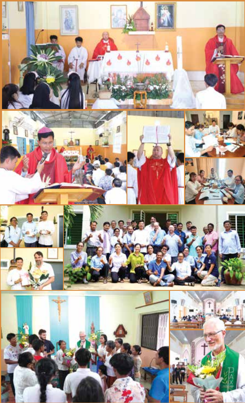
ព្រះសហគមន៍កាតូលិកភូមិភាគកំពង់ចាម