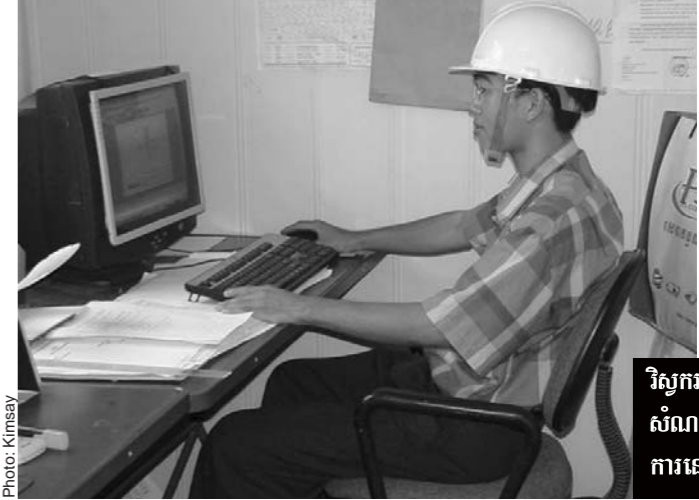
វិស្វករអាចគណនាគ្រឹះសំណង់មុននឹងចុះធ្វើការនៅលើការដ្ឋាន

វិស្វករមានច្រើនប្រភេទ ដូចជា វិស្វករអគ្គិសនី អេឡិចត្រូនិក មេកានិក-ល- តែសម្រាប់ការកសាងសំណង់ផ្សេងៗ គឺត្រូវតែមានការចូលរួមពីវិស្វករទេពកោសល្យជនបទដោយខ្លះមិនបាន។