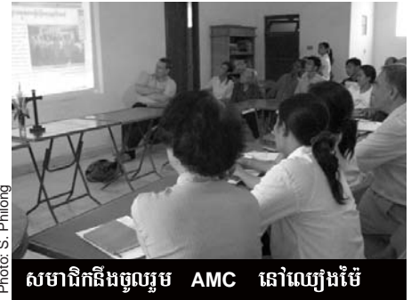
សមាជិកនិងចូលរួម AMC នៅឈៀងម៉ៃ

ការប្រារព្ធនូវ AMC នៅក្រុងឈៀងម៉ៃ លើកនេះ មានការចូលរួមពីគណៈប្រតិភូពីបណ្តាប្រទេសនា ទាទូទាំងទ្វីបអាស៊ី។ ប្រធានបទសំខាន់ក្នុងមហា សន្និបាតនេះគឺ: “ការរៀបរាប់អំពីជីវិតព្រះយេស៊ូ នៅទ្វីបអាស៊ី” ដោយមានការចែករំលែកលើបទ ពិសោធន៍ នៃជំនឿរបស់ខ្លួន។ នៅទីក្រុងម៉ានីល នាឆ្នាំ១៩៧៥ មានអ្នកចូលរួមក្នុងមហាសន្និបាត ជាច្រើនដូចជា បូជាចារ្យកាតូលិក ទេវវិទូ បេស- កធនវិទូកាតូលិក និងគ្រិស្តបរិស័ទតិចតួចដែរ។ រី ឯមហាសន្និបាតនៅឈៀងម៉ៃ ភាគច្រើន គឺមាន ការចូលរួមពីគ្រិស្តបរិស័ទ ហើយក៏មានបូជាចារ្យ និងបព្វជិតដែលនៅរួមជាមួយពួកគេផងដែរ។ ចំពោះព្រះសហគមន៍នៅប្រទេសកម្ពុជាយើងវិញ នោះ មានសមាជិកចូលរួម ២៦នាក់ ក្នុងនាមភូមិ