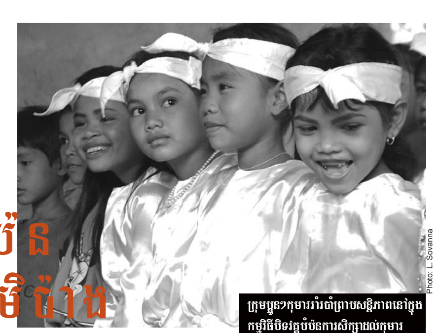
ក្រុមប្អូនៗកុមារារំពឹងប្រោសស្ថិតិភាពនៅក្នុងកម្មវិធីបិទវគ្គបំប៉នការសិក្សាដល់កុមារ

បន្ទាប់ពីចាប់កំណើតក្រោយពីសង្គ្រាមបំផ្លិចបំផ្លាញស្ទើរទាំងស្រុង ព្រះសហគមន៍បានខិតខំពង្រឹងជំនឿ និងសកម្មភាពរបស់ខ្លួនដោយចូលរួមយ៉ាងជិតស្និទ្ធជាមួយប្រជាជន។ ការអប់រំចំណេះទូទៅដល់កុមារ និងយុវជនគឺជាភារកិច្ចអាទិភាពមួយ។