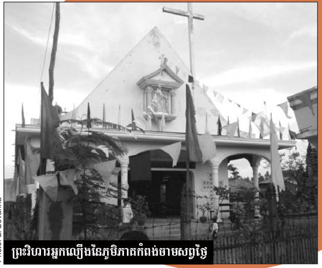
ព្រះវិហារអ្នកឈឺរងនៃភូមិភាគកំពង់ចាមសព្វថ្ងៃ