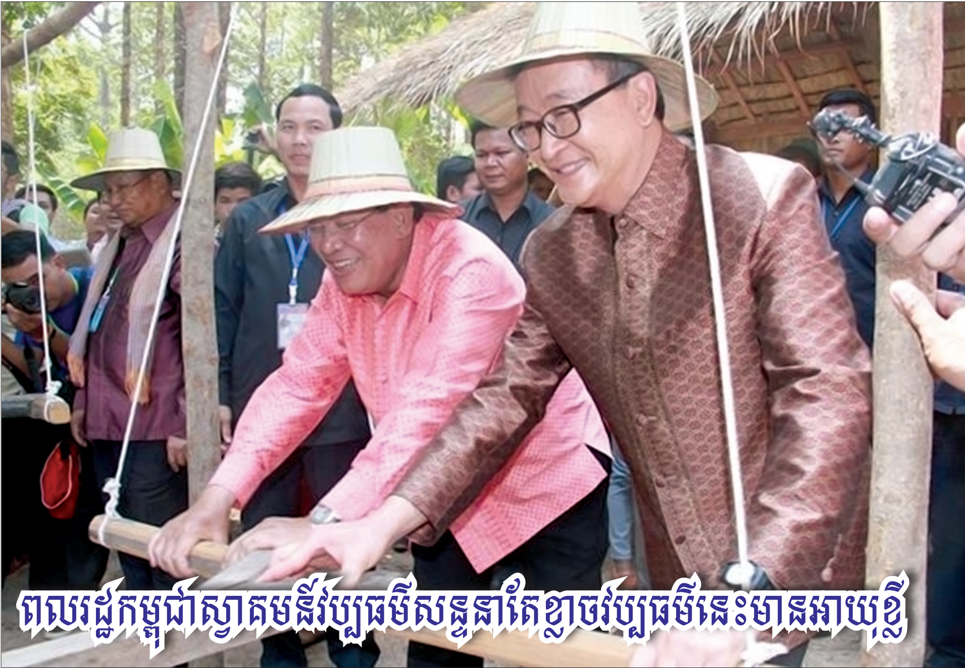
ពលរដ្ឋកម្ពុជាស្វាគមន៍ប្រធានសន្និដ្ឋានខ្មែរច្បាប់ប្រធាននេះមានអាយុខ្លី