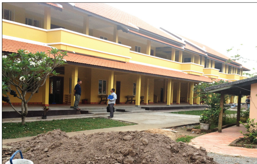
អាគារមណ្ឌលសកម្មភាពកំពតកែបដែលទើបនឹងសាងសង់រួច រូបភាព:

មណ្ឌលសកម្មភាពកំពតកែបនឹងមានសកម្មភាព ជាច្រើនបន្ថែមទៀត បន្ទាប់ពីអាគារមួយខ្នង កម្ពស់ពីរជាន់ ថ្មីនឹងត្រូវសម្ពោធនាពេលបន្តិចទៀត នេះ។ លោក យ៉ាងលូកា បូជាចារ្យទទួលខុសត្រូវមណ្ឌលសកម្មភាពនេះ មានប្រសាសន៍ថា កំពតជាបេះដូង នៃ