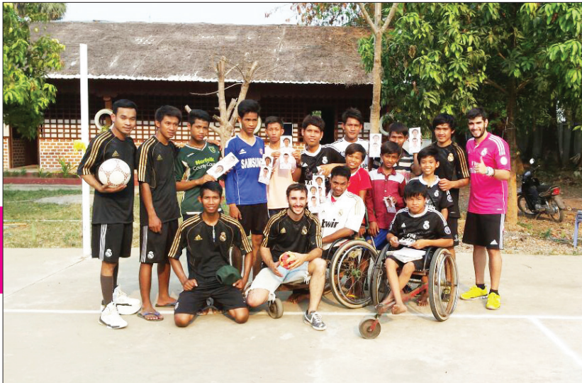
ក្រុមរៀនម៉ាទ្រីត ថតរូបអនុស្សាវរីយ៍ជាមួយក្រុមកីឡាករអារូពេ ។

មណ្ឌលកុមារពិការ អារូពេ របស់ ព្រះសហគមន៍កាតូលិកស្ថិតក្នុងខេត្ត បាត់ដំបង នឹងទទួលបានសាលារៀន បណ្តុះបណ្តាល ផ្នែកកីឡាខ្នាតអន្តរ- ជាតិមួយក្នុងពេល ប៉ុន្មានឆ្នាំខាងមុខ ទៀត នេះបើតាមប្រសាសន៍របស់ លោកអភិបាល អេនរីគេ ហ្វីកាដេ ទទួលខុសត្រូវ ព្រះសហគមន៍កាតូ- លិកភូមិភាគបាត់ដំបង ។