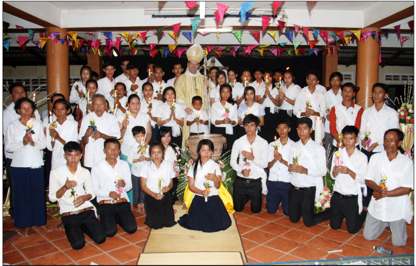
បេក្ខជនដែលទទួលពិធីជ្រមុជទឹកទាំង៤៧នាក់។

លោកអភិបាល អូលីវីយេ ដ្រីតអ៊ីស្ទើរ បានធ្វើអគ្គសញ្ញាជ្រមុជទឹកជូនបេក្ខជនចំនួន៤៧នាក់នៅព្រះសហគមន៍កាតូលិកសន្តិម៉ារីញញឹម (ចំការទៀង) ស្ថិតនៅស្រុកត្រាំកក់ ខេត្តតាកែវ កាលពីថ្ងៃទី៤ មេសាដែលមានគ្រីស្ទបរិស័ទ យុវជន និង អ្នកទទួលការស្វែងយល់ ប្រមាណជា