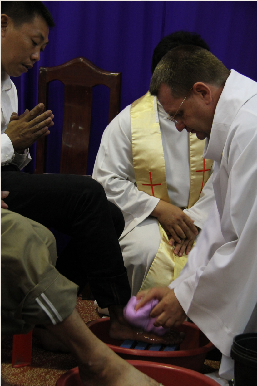
ថ្ងៃព្រហស្បតិ៍ល