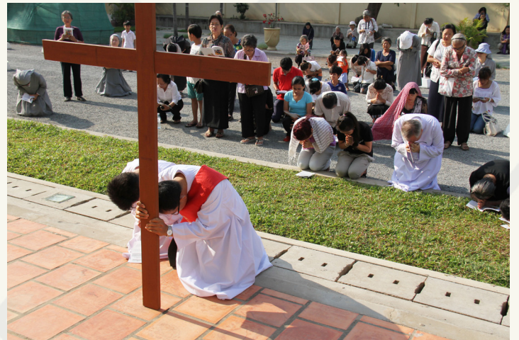
ថ្ងៃអាទិត្យបុណ្យចម្លង