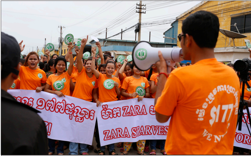
កម្មករទាមទារប្រាក់ខែគោល១៧៧ដុល្លារ កាលពីឆ្នាំ២០១៤កន្លងទៅ។

កម្មករនិងកម្មការនីដែលកំពុងតែបំបែកការងារនៅក្នុងវិស័យឧស្សាហកម្មធន់ស្រាលនៅកម្ពុជា បានអះអាងថា ពួកគេមិនយល់ពីនយោបាយទេ ប៉ុន្តែពួកគេចង់បានការងារដែលមានប្រាក់ខែខ្ពស់ មានបរិយាកាសការងារល្អ និងកន្លែងរស់នៅដែលសមរម្យលើសពីបច្ចុប្បន្ន ខណៈដែលប្រមុខរដ្ឋាភិបាលកម្ពុជា នៅក្នុងសារលិខិតសម្រាប់ឱកាសទិវាពលកម្មអន្តរជាតិខួបលើកទី ១២៩ បានបង្ហាញអំពីផែនការធ្វើឲ្យកាន់តែប្រសើរដល់ជីវិតកម្មករ និងកម្មការនី និងមន្ត្រីរាជការស៊ីវិល ។