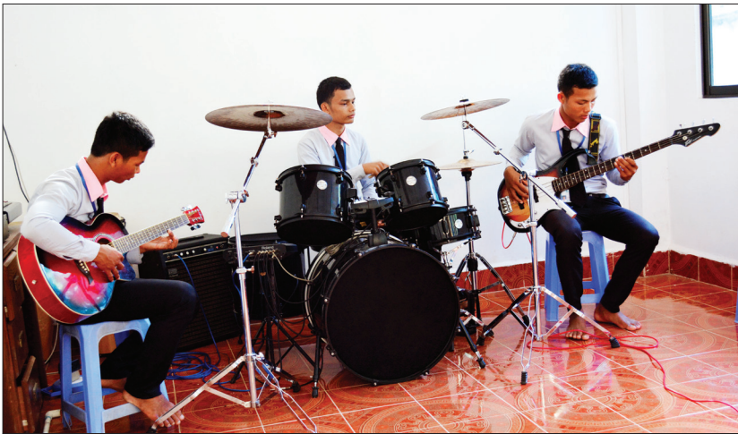
យុវជនសិក្សាផ្នែកជំនាញវប្បធម៌: KG

ជំនាញសិល្បៈ នៃការទំនាក់ទំនងសង្គម (Art of Communication) ជាជំនាញមួយក្នុងផ្នែកសិល្បៈ ដែលសាលាបច្ចេកទេស ដុនបូស្កូកែប បានបង្កើតឡើង ដើម្បីបំពេញនូវសេចក្តីត្រូវការផ្នែកសង្គម។