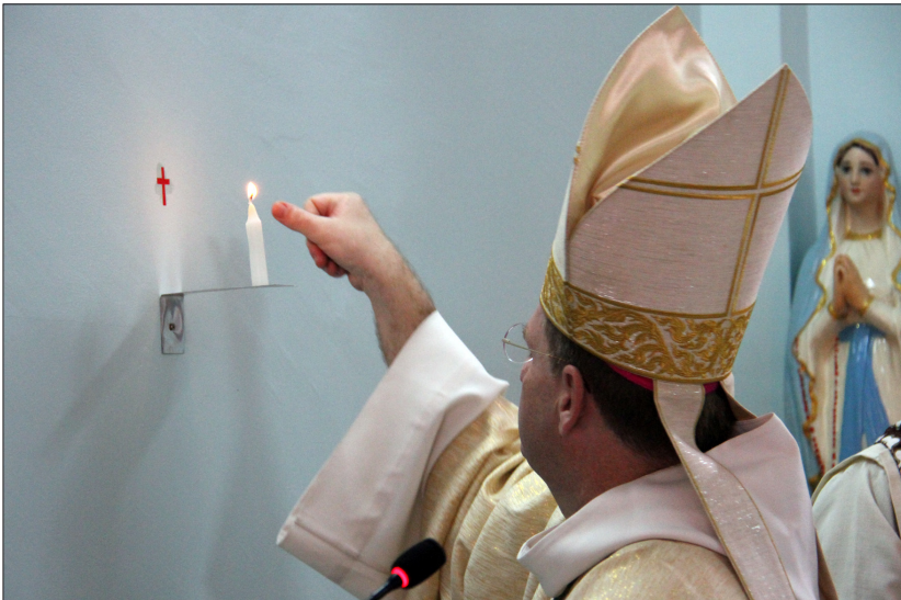
លោកអភិបាលលាបប្រេងលើព្រះវិហារថ្មី។

ព្រះសហគមន៍កាតូលិក កំពង់ស្ពឺ បានបើកសម្ពោធព្រះវិហារថ្មីមួយ ដែលមានឈ្មោះថា សន្តយ៉ូសែប ស្ថិតនៅភូមិពាណិជ្ជកម្ម ក្រុងច្បារមន ខេត្ត