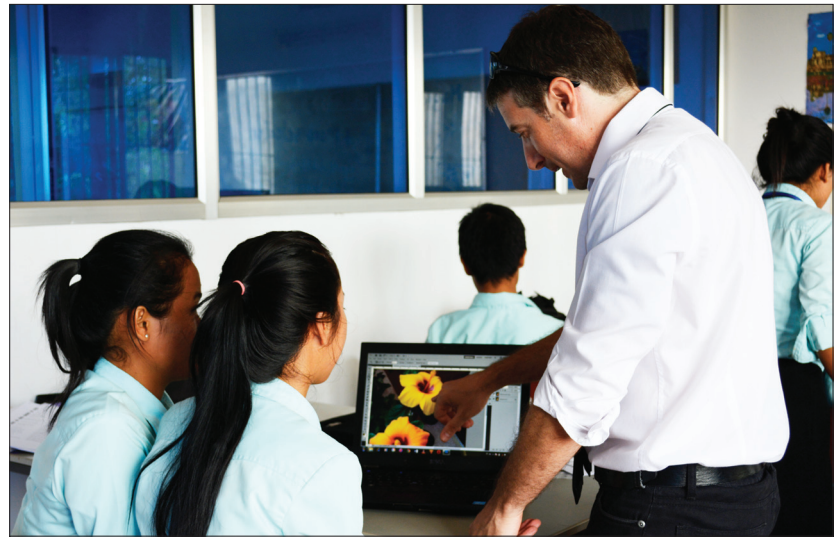
បន្ទប់សិក្សាផ្នែករចនារូបភាព វប្បធម៌: KG