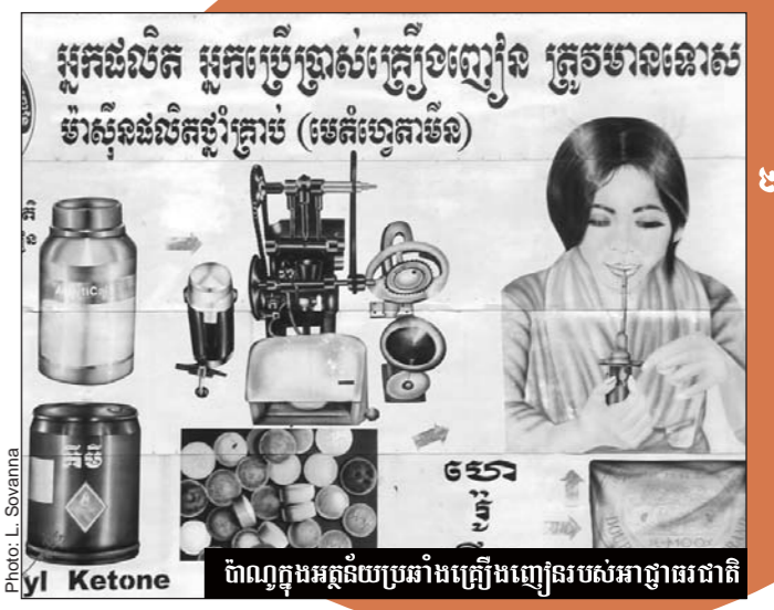
ប៉ាណូក្នុងអន្តរាយប្រឆាំងគ្រឿងញៀនរបស់អាជ្ញាធរជាតិ