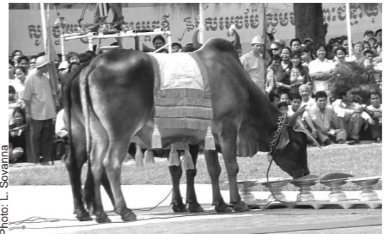
គោឧសភារាជឆ្នាំនេះបរិភោគស្រូវ សណែ្តក និងពោតច្រើន