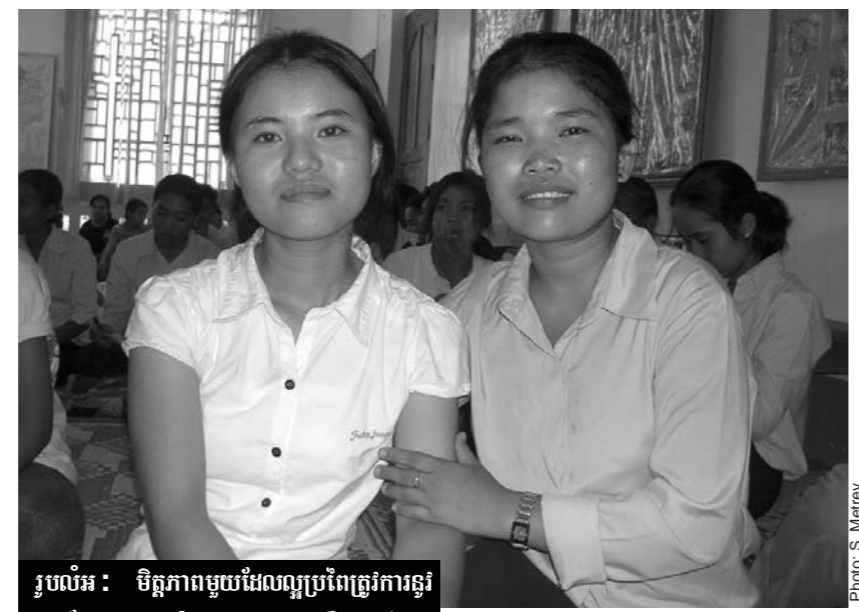
រូបលំអ៖ មិត្តភាពមួយដែលល្អប្រពៃត្រូវការនូវការស្វែងយល់ និងជួយដល់គ្នាទៅវិញទៅមក

មនុស្សប្រុស ឬស្រី នៅពេលដែលពុំចេះទំនាក់ទំនងជាមួយអ្នកដទៃ វាអាចធ្វើឱ្យមានផលវិបាកចំពោះខ្លួនឯងក្នុងពេលណាមួយជាមិនខាន។ តើយើងត្រូវធ្វើយ៉ាងណាដើម្បីឱ្យមានភាពជោគជ័យក្នុងការធ្វើទំនាក់ទំនងល្អទៅកាន់អ្នកដទៃ ?