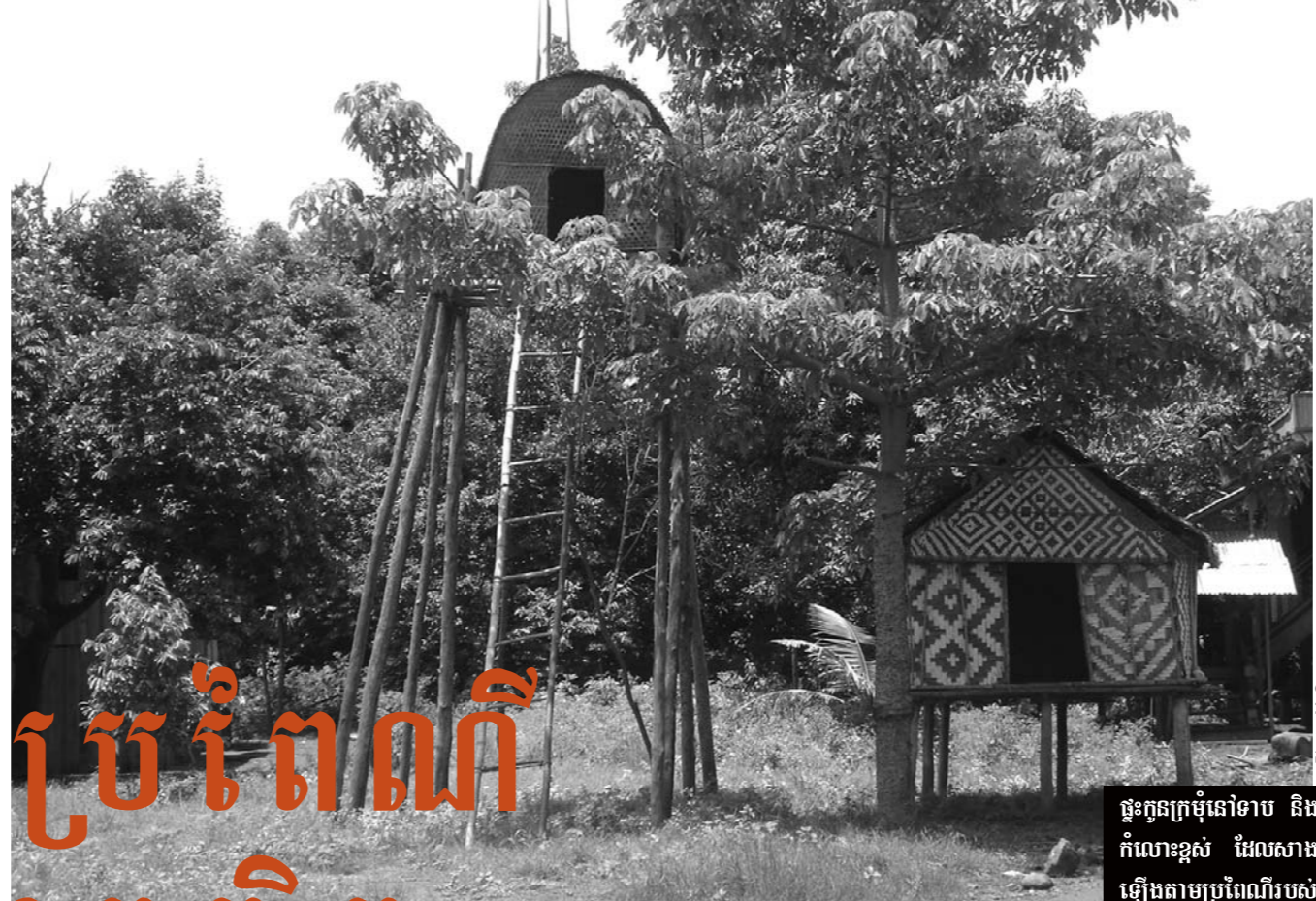
ផ្ទះក្រមុំនៅទាប និងផ្ទះក្នុង កំណោះខ្ពស់ ដែលសាងសង់ ឡើងតាមប្រពៃណីរបស់ជន ជាតិភាគតិចនៅខេត្តរតនគិរី