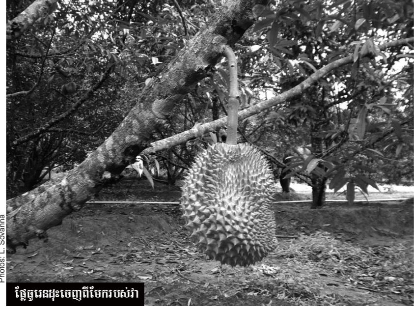
ផ្លែធ្នូរេនដ៍ដុះចេញពីមែករបស់វា

ក ន្លែ ង ស ិ ក រ ្យា ប្រសិនបើលោកអ្នកចង់ សិក្សាអំពីរបៀប ឬ បច្ចេកទេសនៃការដាំ ដំណាំគ្រប់ប្រភេទគឺមាន នៅមជ្ឈមណ្ឌលសិក្សា និងអភិវឌ្ឍន៍កសិកម្ម កម្ពុជា សេដ្ឋកិច្ច ឬ អាចអញ្ជើញបុគ្គលិក របស់ សេដ្ឋកិច្ច ទៅ បង្រៀនដល់ទឹកនៃផ្លែ ម្តងក្នុងតម្លៃសមរម្យ។ ទំនាក់ទំនងទូរស័ព្ទ : ០២៣ ៨៨០៩១៦។