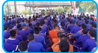
លោកប្តីជាចារ្យ និងគ្រូស្រីស៊ីនីមុនជាមួយថ្នាក់ដឹកនាំព្រះពុទ្ធសាសនា និងឥស្លាមសាសនា