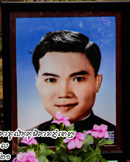
រាបអង្គុំនាយការិយាល័យដេប៉ូធីតាស្រីសោភ័ណភូមិក្រុងភ្នំពេញ ហោះហុដ្ឋចំនួន ៩ ៥០០ ក្បាល ថ្ងៃទី១៣ ខែ មេសា ឆ្នាំ ២០២១