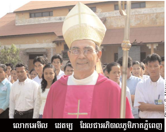
លោកអេមីល ដេតឃ្យ ដែលជាអភិបាលភូមិភាគភ្នំពេញ