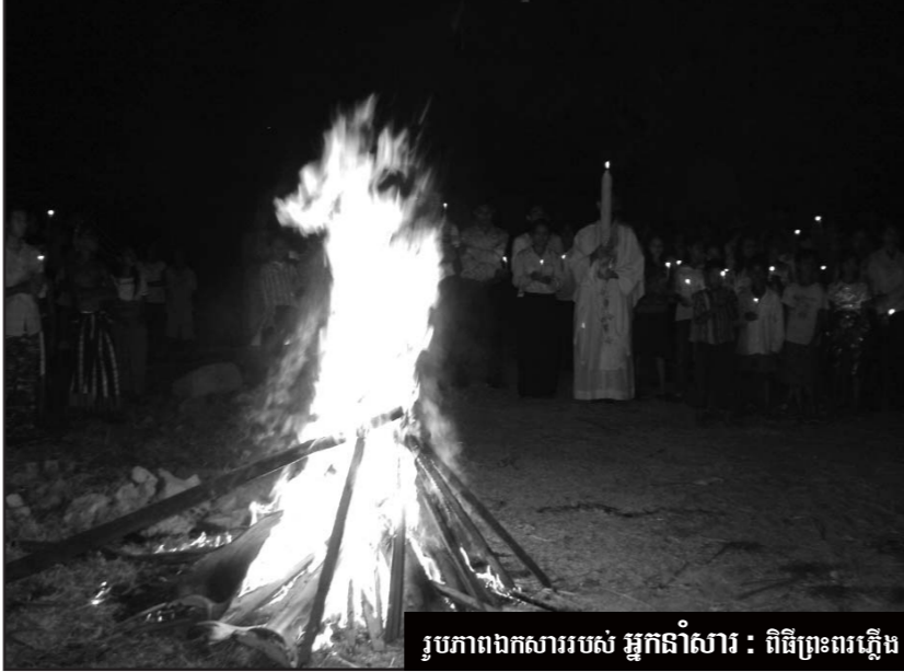
រូបភាពពងការរបស់ អ្នកនាំសារ : ពិធីព្រះពរក្តើង

វិញលោកវង ធីម ជាគ្រីស្ទបរិស័ទនៅព្រះសហគមន៍កំពង់ធំ គូសបញ្ជាក់ដែរថា បុណ្យចម្លង គឺជាការដែលព្រះជាម្ចាស់ប្រោសព្រះយេស៊ូគ្រីស្ទ ឱ្យមានព្រះជន្មឡើងវិញ តាមរបៀបថ្មី គឺតាមព្រះវិញ្ញាណដ៏វិសុទ្ធ។ បើតាមជំនឿយើងជាគ្រីស្ទបរិស័ទ ព្រះយេស៊ូសុគតសម្រាប់យើងទាំងអស់គ្នា ដែលនាំឱ្យយើងទទួលបានសេរីភាព យ៉ាងបរិបូរ។ លោកបានសង្កត់ធ្ងន់ថា ប្រសិនព្រះជាម្ចាស់មិនប្រោសព្រះយេស៊ូ ឱ្យមានព្រះជន្មរស់ឡើងវិញទេ នោះគឺគ្មានអ្នកជឿ និងដើរតាមព្រះអង្គដូចសព្វថ្ងៃនេះទេ។ មនុស្សយើងម្នាក់ៗ កំពុងស្វែងរកបរមសុខខាងផ្លូវវិញ្ញាណ សម្រាប់ជីវិតគេ។ សម្រាប់ថ្ងៃអនាគត លោកក៏ជឿថា លោកនឹងរស់ឡើងវិញជាមួយព្រះយេស៊ូដែរ