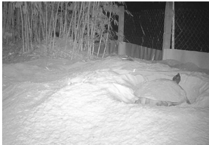
អ្នកជំនាញកំពុងធ្វើការវាយសំបុករបស់មេអណ្តើកហ្លួង ៥ក្បាលដែលក្រុមការងារបានយកទៅចិញ្ចឹមថែទាំនៅក្នុងមជ្ឈមណ្ឌលអភិរក្សសត្វល្អិត និងរូបភាពថតដោយម៉ាស៊ីនថតសត្វស្វយ័ត។

រំពឹងថាគម្រោងនេះនឹងអាចជំរុញការបង្កាត់ប្រភេទអណ្តើកនេះបានចំនួនច្រើននៅក្នុងមជ្ឈមណ្ឌលនេះ និងអាចយកវាទៅលែងចូលក្នុងទីជម្រកធម្មជាតិរបស់វាវិញបាន។