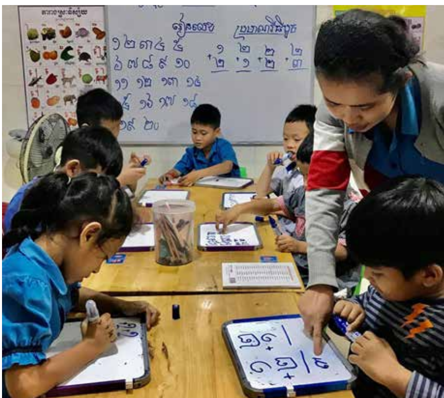
កុមារអូទីស៊ីមអាចសិក្សាបាន និងសម្រាលការលំបាកទាំងផ្លូវកាយនិងចិត្តរបស់អ្នកជាអាណាព្យាបាល។ រូបភាព៖ សាលាអប់រំពិសេសនៃការលូតលាស់ (Growing Special Education School)

សាលារៀនពិសេសដែលទទួលការបណ្តុះបណ្តាលកុមារដែលមានបញ្ហាអូទីស៊ីម។ រូបភាព៖ សាលាអប់រំពិសេសនៃការលូតលាស់