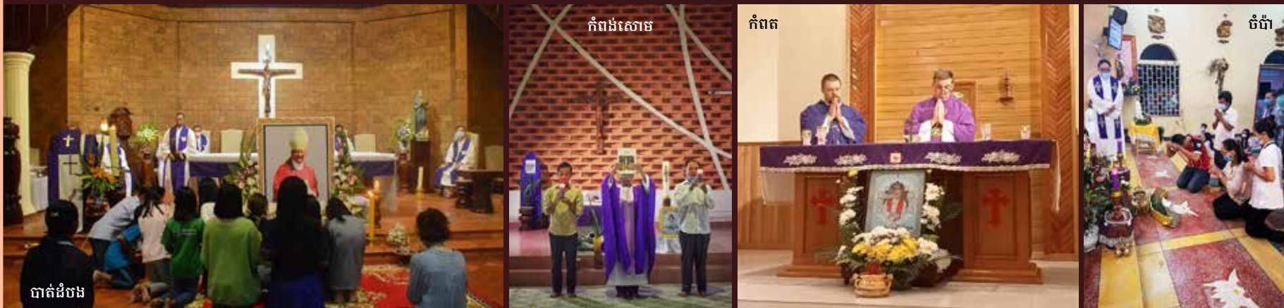
បាត់ដំបង

សូមបងប្អូនបន្តអធិដ្ឋាន និងអរព្រះគុណព្រះជាម្ចាស់ដែលបានប្រទានអ្នកបម្រើដ៏ឧត្តមរបស់ព្រះអង្គ ឱ្យមកបម្រើព្រះសហគមន៍ កាតូលិករបស់យើងនៅប្រទេសកម្ពុជា ដែលពោរពេញដោយភាពលះបង់ព្យាយាម និងចិត្តស្រលាញ់យ៉ាងខ្លាំងបំផុត។