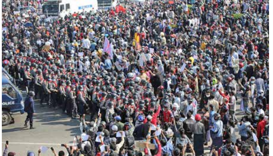
ក្រុមយុវជននៅក្នុងប្រទេសមីយ៉ាន់ម៉ានៅតែបន្តសកម្មភាពនៅក្នុងការខិតខំស្តារនិងកសាងលទ្ធិប្រជាធិបតេយ្យឡើងវិញ។

អាស៊ានត្រូវតែយល់ថារដ្ឋប្រហារប្រការបោះឆ្នោតឡើងវិញដែលបានសន្យាដោយរបបយោធាគឺមិនអាចទទួលយកបានទាំងស្រុងចំពោះប្រជាជនមីយ៉ាន់ម៉ា