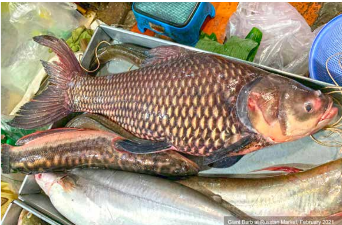
រូបភាពត្រីគល់រាំង (Giant barb) ថតក្នុងឆ្នាំ២០២០

WWFកម្ពុជា បានបង្ហាញថា ត្រីគល់រាំង ត្រីត្រសក់ក្រហម ត្រីក្របី ត្រីខ្លា ត្រីត្រចៀកដំរី និងត្រីបបែលទឹកសាប ក្នុង ចំណោមត្រី ៣៥ ប្រភេទ ផ្សេងទៀតត្រូវបានគេជួញដូរ និងលក់តាមទីផ្សារក្នុងប្រទេសកម្ពុជា ក៏ដូចជានាំចេញ ទៅលក់នៅប្រទេសជិតខាង។ ត្រីគល់រាំង និងត្រីត្រសក់ក្រហម ត្រូវបានចាត់ថ្នាក់ជាប្រភេទទទួល រងគ្រោះជិតផុតពូជបំផុតទាំងនៅលើសកលលោក និងនៅក្នុងប្រទេសកម្ពុជា ចំណែកឯត្រីក្របី ត្រីខ្លា និងត្រី