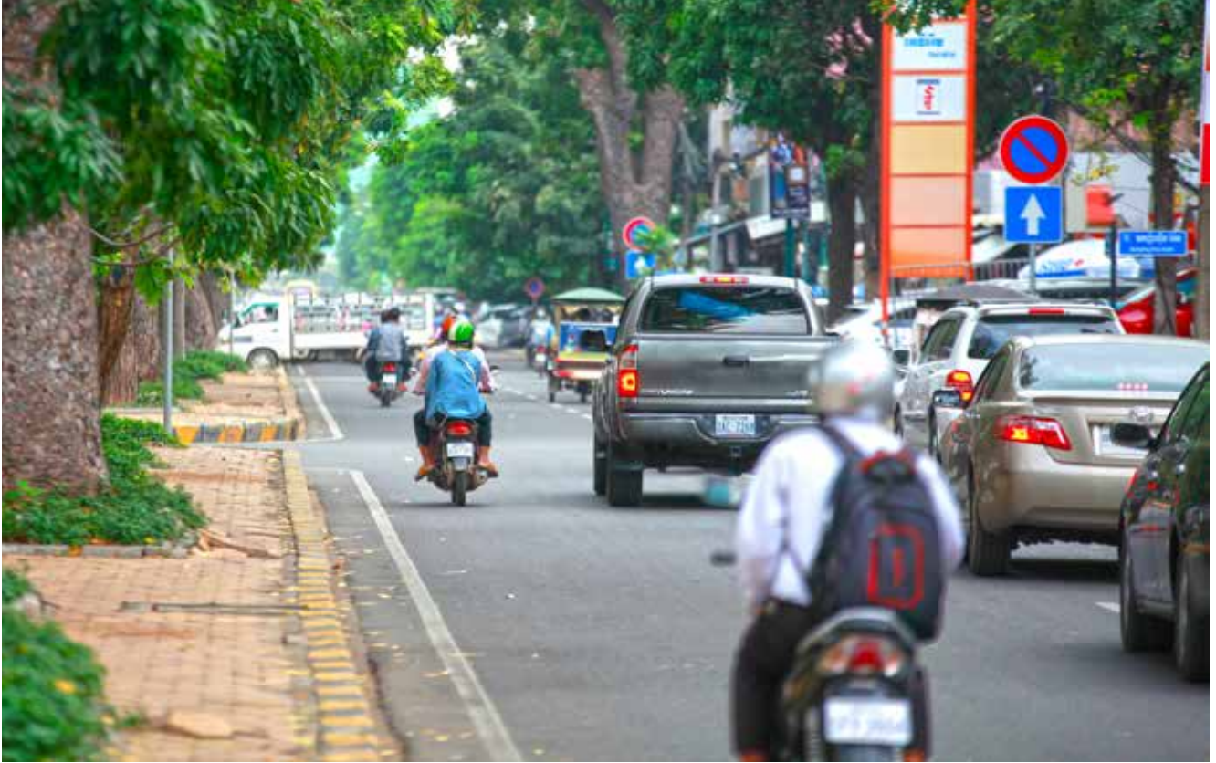
យានយន្តគ្រប់ប្រភេទកំពុងធ្វើចរាចរលើដងវិថីក្រុងភ្នំពេញ។

កាលពីខែកុម្ភៈ ឆ្នាំ២០២១ សម្តេចតេជោ ហ៊ុន សែន នាយករដ្ឋមន្ត្រីនៃកម្ពុជា បានចេញអនុក្រឹត្យសម្រេចកែសម្រួលអត្រាអាករពិសេសលើមុខទំនិញរថយន្តមួយចំនួន។ ការកែសម្រួលបញ្ជូនអត្រាអាករពិសេស លើមុខទំនិញរថយន្តមួយចំនួននេះនឹងត្រូវចាប់ផ្តើមអនុវត្តចាប់ពីថ្ងៃ