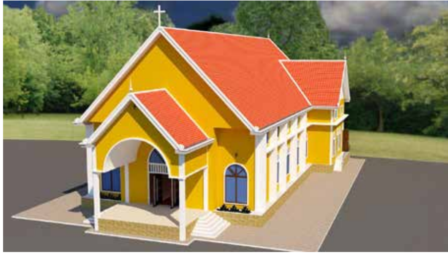
រូបភាពគំរូព្រះវិហារថ្មី ឈ្មោះសន្តយ៉ូហានបាទីស្ទ ដែលបានធ្វើពិធីបញ្ចុះបឋមសិលាហូរចរលំ។