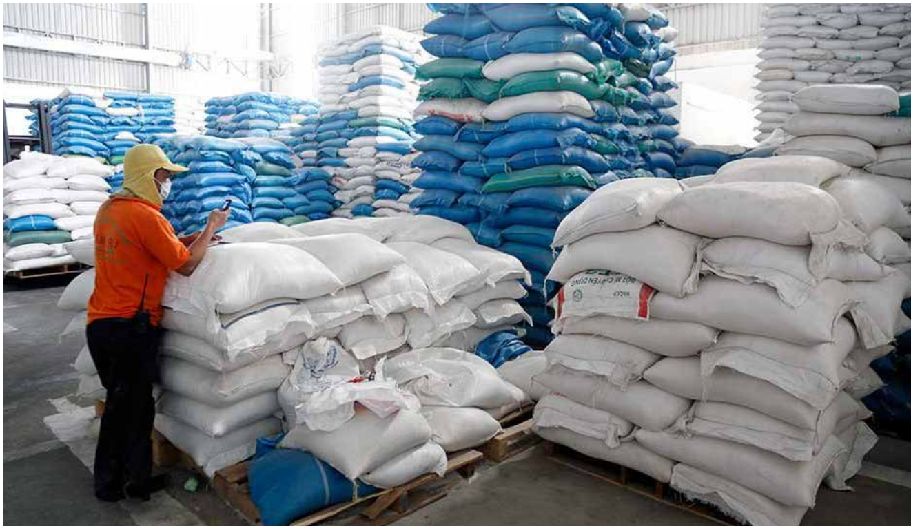
ស្រូវ និងអង្ករផ្ទុកក្នុងរោងចក្រស្រូវនៃព្រះរាជាណាចក្រកម្ពុជា។

មួយខែដំបូងឆ្នាំនេះ កម្ពុជាទទួលបានចំណូលជិត ៨៥លានដុល្លារ ពីការនាំចេញស៊ីម៉ង់ត៍