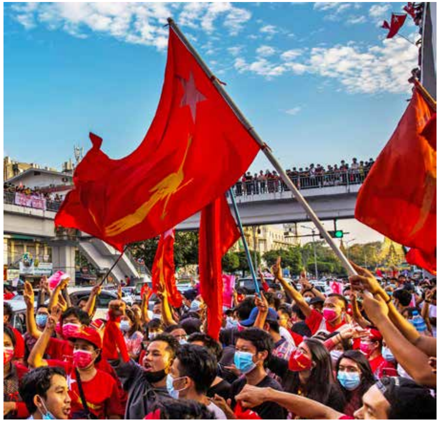
ក្រុមយុវជននៅក្នុងប្រទេសមីយ៉ាន់ម៉ានៅតែបន្តសកម្មភាពនៅក្នុងការខិតខំស្តារនិងកសាងលទ្ធិប្រជាធិបតេយ្យឡើងវិញ។

គេនៅមិនទាន់ដឹងថា ជោគវាសនារបស់ប្រជាជាតិមីយ៉ាន់ម៉ា នឹងទៅតាមគន្លងណានោះទេ ប៉ុន្តែទោះបីយ៉ាងណាក៏ដោយក៏ក្រុមយុវជននៅក្នុងប្រទេសនេះនៅតែបន្តសកម្មភាពនៅក្នុងការខិតខំស្តារនិងកសាងលទ្ធិប្រជាធិបតេយ្យឡើងវិញ ប៉ុន្តែគេដឹងថា របបយោធានៅក្នុងប្រទេសនេះគឺបានចាក់ឫសគល់ដ៏យូរ ពោលគឺតាំងពីឆ្នាំ ១៩៦២ ដល់ឆ្នាំ២០១១ ហើយនៅឆ្នាំ២០២១ នេះក៏បានបន្តឡើងវិញ។ នៅក្នុងចន្លោះពេលពីឆ្នាំ ២០១១ ដល់ឆ្នាំ២០២១ នេះទោះបីជា លោកស្រី អ៊ុងសាន ឥណ្ឌូ ដណ្តើមបានការគ្រប់គ្រងតាមរយៈការបោះឆ្នោត ប៉ុន្តែអំណាចយោធា គឺនៅតែ