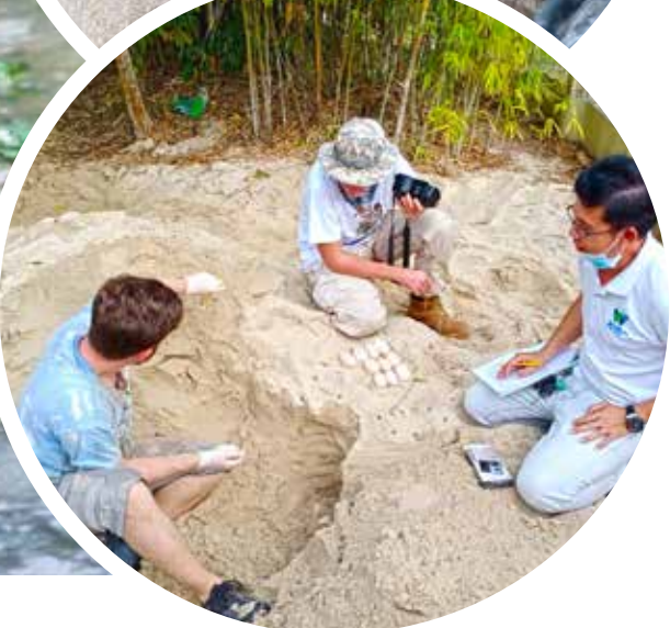
អណ្តើកហ្លួង (មានឈ្មោះវិទ្យាសាស្ត្រថា Batagur affinis)។