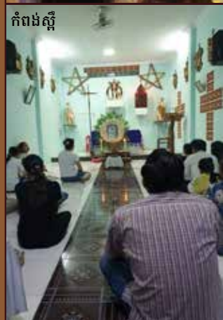
កំពង់ស្ពឺ