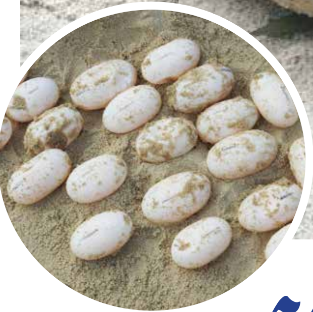
ពង និងអណ្តើកហ្លួង (មានឈ្មោះវិទ្យាសាស្ត្រថា Batagur affinis )។