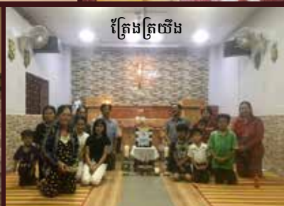
ត្រែងត្រយឹង