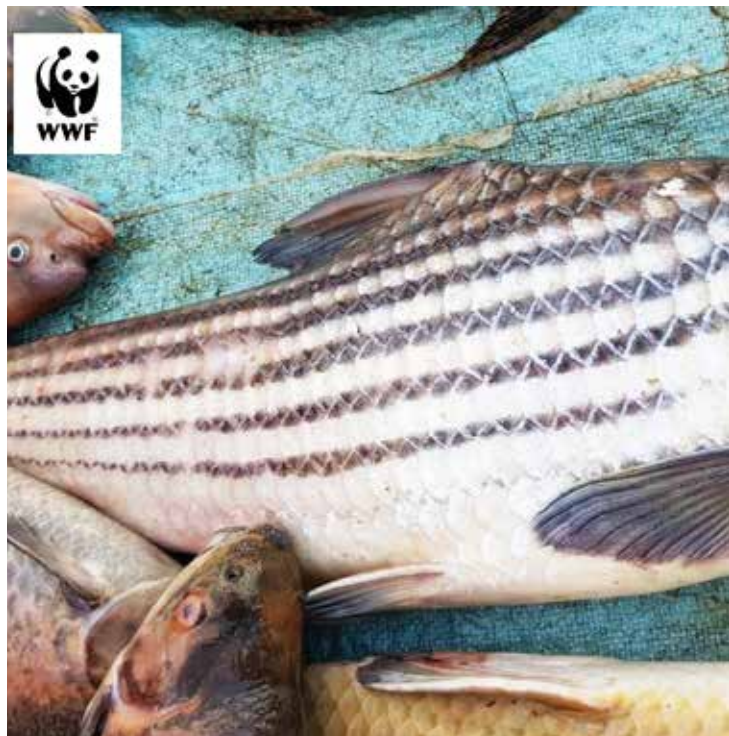
ត្រីត្រសក់ក្រហម (Probarbus labeaminor) ថតក្នុងឆ្នាំ២០២០