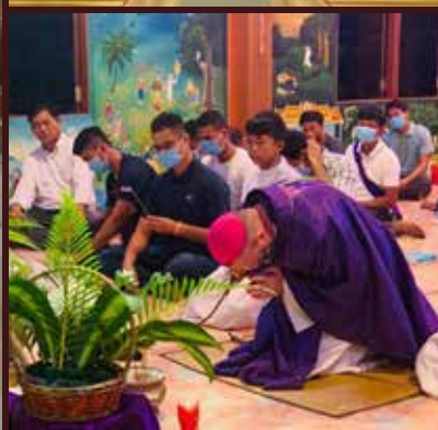
ប្រទេសបារាំង