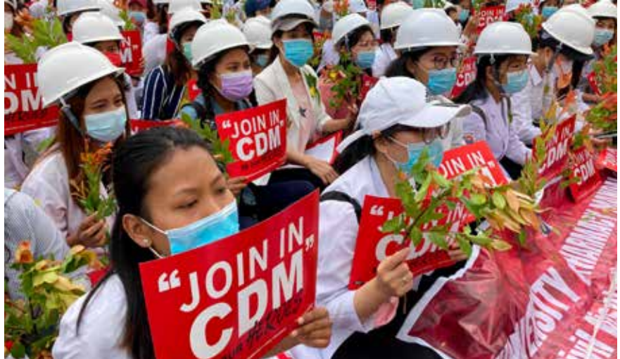
ក្រុមនិស្សិតនិងយុវជនជាច្រើន ត្រូវបានគេដឹងថា គឺជាសកម្មជន ដឹកនាំសិទ្ធិមនុស្ស និងចលនាប្រជាធិបតេយ្យនានា។

អាស៊ានត្រូវតែយល់ថារដ្ឋប្រហារប្រការបោះឆ្នោតឡើងវិញដែលបានសន្យាដោយរបបយោធាគឺមិនអាចទទួលយកបានទាំងស្រុងចំពោះប្រជាជនមីយ៉ាន់ម៉ា