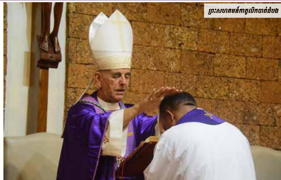
ព្រះសហគមន៍កាតូលិកបាត់ដំបង