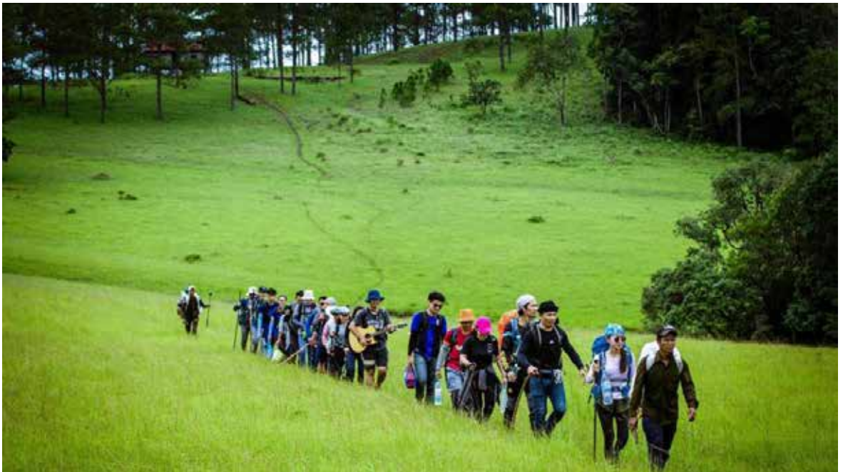
អ្នកទេសចរធ្វើដំណើរផ្សេងៗទៀតកម្ពុជានៅក្នុងតំបន់ខ្ពង់រាប។

លោក វេង សាខុន បានឱ្យដឹងផងដែរថា បច្ចុប្បន្ននៅកម្ពុជា ក្រោមការគ្រប់គ្រងរបស់ក្រសួងកសិកម្ម មានសហគមន៍នេសាទ ចំនួន ១៣១ ក្នុងចំណោមសហគមន៍នេសាទទាំងអស់៥១៦ ។ ទាំងនេះមានសក្តានុពលអាចបង្កើតជាសហគមន៍ទេសចរណ៍ ធម្មជាតិ ដើម្បីរួមចំណែកក្នុងការលើកកម្ពស់កម្រិតជីវភាពរស់នៅ របស់ប្រជាពលរដ្ឋនៅមូលដ្ឋានក្នុងគោលដៅជំរុញកំណើនសេដ្ឋកិច្ច