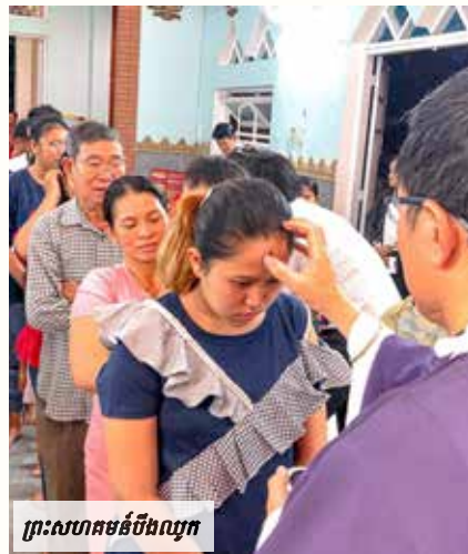
ព្រះសហគមន៍បឹងល្វក