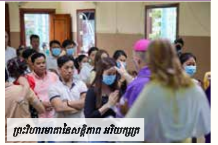
ព្រះវិហារមាតានៃសន្តិភាព អរិយក្សេត្រ