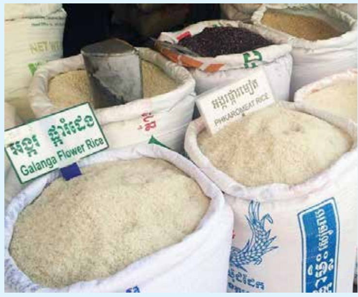
អង្ករប្រភេទផ្សេងៗដែលបានដាក់តាំងលក់នៅក្នុងទីផ្សារនាពេលបច្ចុប្បន្ន។

ប្រទេសក្នុងតំបន់អាស៊ាន ថយ៤៤,៦១ ភាគរយ និងប្រទេសដទៃផ្សេងទៀត ថយចំនួន ៣៤,០៣ ភាគរយ។ របាយការណ៍ដដែលបន្តទៀតថា អង្កររបស់កម្ពុជាបានធ្វើការនាំចេញទៅកាន់ ប្រទេសចំនួន២៨ ក្នុងនោះប្រទេសចិនឈរលំដាប់ថ្នាក់លេខ១ ចំនួន ១៦,១៦៣ តោន។ ប្រទេស១៤ ក្នុងតំបន់អឺរ៉ុប ចំនួន ៧, ៦៣៥តោន ប្រទេសចំនួន២ក្នុងតំបន់អាស៊ាន ចំនួន ៣,២៥៩តោន និងប្រទេស១១ ផ្សេងទៀត ចំនួន ៧,២១៦ តោន។ កាលពីឆ្នាំ២០២០ កម្ពុជានាំអង្ករចេញបានចំនួន ៦៩០,៨២៩ តោន កើនឡើង១១,៤០ ភាគរយ