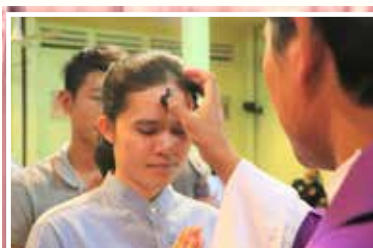
ព្រះវិហារកំពង់ចាមក្រុង