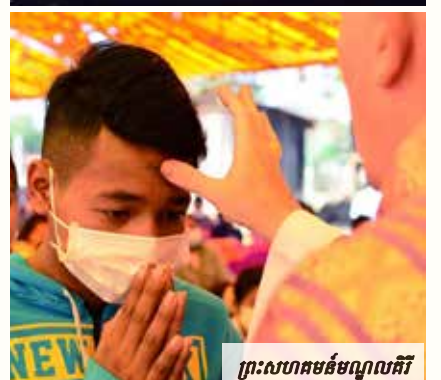
ព្រះសហគមន៍មណ្ឌលគិរី