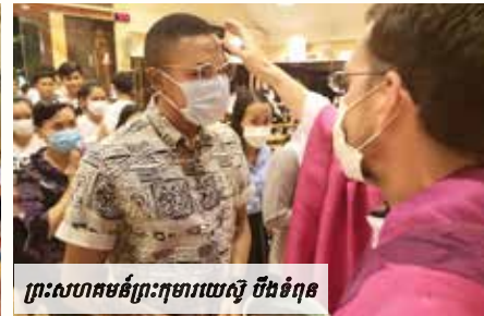
ព្រះសហគមន៍ព្រះកុមារយេស៊ូ បឹងទំពុន