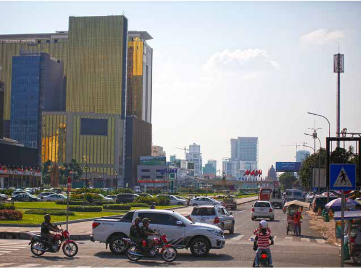
រូបភាព៖ ការិយាល័យស្បៀងផ្សាយព័ត៌មានពាណិជ្ជកម្ម