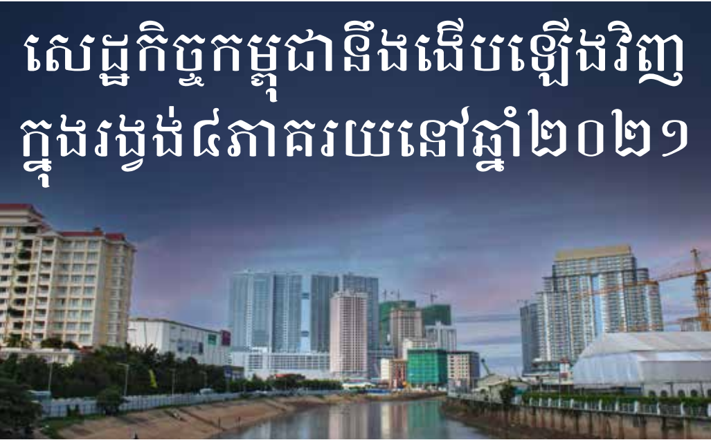
សំណង់អគារការិយាល័យ និងសណ្ឋាគារទំនើបថ្មីៗកំពុងមានការវិនិយោគទីក្រុងភ្នំពេញ។ ការិយាល័យផ្សព្វផ្សាយព័ត៌មានកាតូលិកភ្នំពេញ