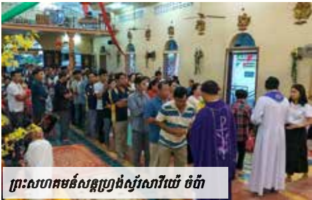
ព្រះសហគមន៍សន្តូរ្យង់ស្វ័រសារីយេ ចំប៉ា