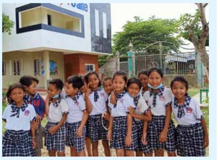
ក្នុងអំឡុងពេល មានវិបត្តិកូវីដ១៩ សាលាឡាសាលាពោធិ៍ធំបានចែករំលែក នូវគ្រឿងឧបភោគបរិភោគដល់គ្រួសារ សិស្សក្រីក្រចំនួន២លើក ក្នុងឱកាស បុណ្យព្រះយេស៊ូប្រសូត និងបុណ្យព្រះ យេស៊ូមានព្រះជន្មរស់ឡើងវិញ ដែល មួយលើកមានចំនួន១០០គ្រួសារ ទទួលបានអង្ករ និងមី។