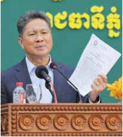
លោក ស៊ុន ចាន់ថុល រដ្ឋមន្ត្រីក្រសួងសាធារណៈការ និងដឹកជញ្ជូន។

ឯកភាពតាមរបាយការណ៍របស់គណៈកម្មាធិការជាតិសុវត្ថិភាពចរាចរណ៍ ព្រោះថាលទ្ធផលនេះកើតចេញពីការខិតខំប្រឹងប្រែង ប្រកបដោយការច្នៃប្រឌិត និងមានយុទ្ធសាស្ត្រច្បាស់លាស់ និងក្រោមកិច្ចសហប្រតិបត្តិការគ្រប់ជ្រុងជ្រោយពីភាគីពាក់ព័ន្ធ ។