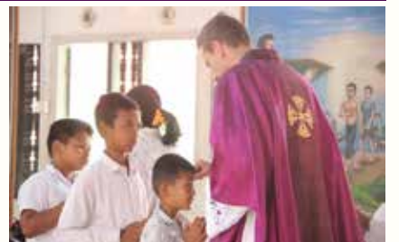
ព្រះសហគមន៍កាតូលិក ចំណោម