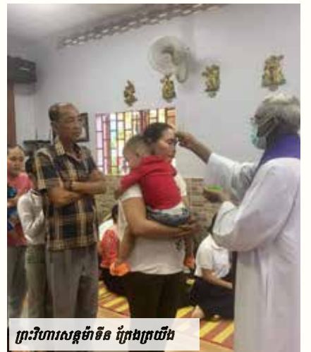
ព្រះវិហារសន្តូរ្យចិន ព្រែងក្របី