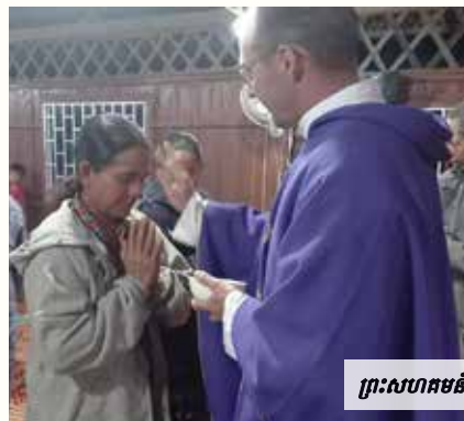
ព្រះសហគមន៍កាតូលិកថ្មីស្រា