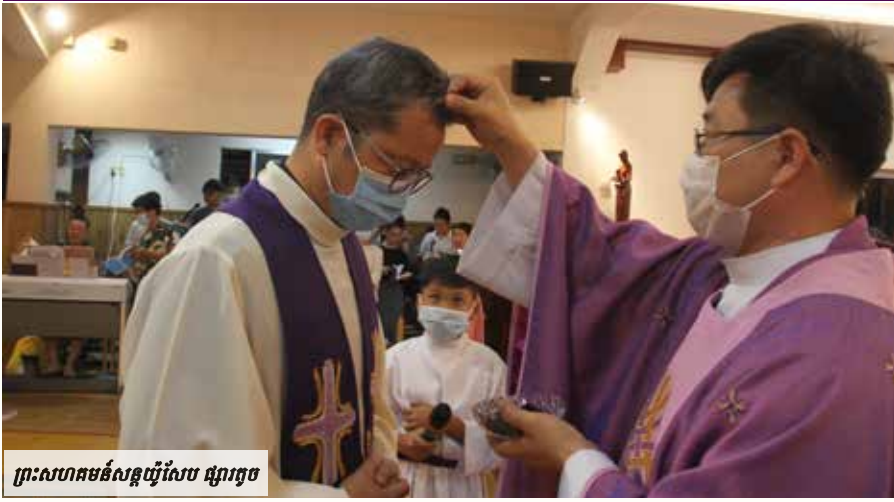
ព្រះសហគមន៍សន្តូរ្យសែប ផ្សារតូច