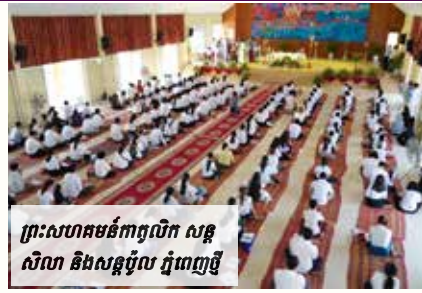
ព្រះសហគមន៍កាតូលិក សន្តូរ សិលា និងសន្តូរ្យ ភ្នំពេញថ្មី