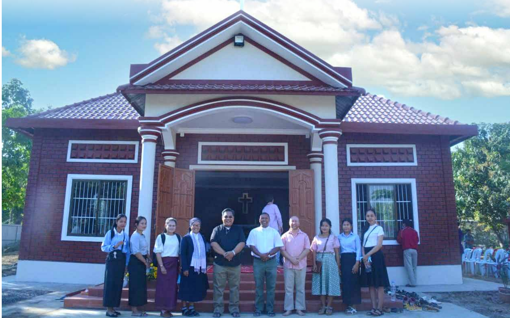
ព្រះវិហារព្រះនាងម៉ារីមាតានៃសន្តិភាពប្រាសាទ ខេត្តកោះកុង ដែលទើបតែបានប្រារព្ធអភិបូជាឆ្នងកាលពីថ្ងៃទី១៣ ខែកុម្ភៈ ឆ្នាំ២០២១។