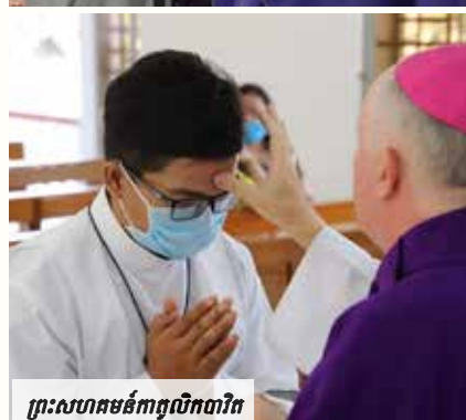
ព្រះសហគមន៍កាតូលិកបារិត