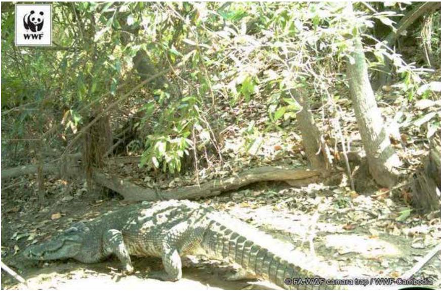
ក្រពើដែលអង្គការWWF ថតបាន។

អត្ថបទ៖ អមិន្ទ ដានុត នាពេលបច្ចុប្បន្ននេះកម្ពុជានៅសេសសល់ ក្រពើភ្នំដែលជាសត្វដ៏កម្របំផុតនៅលើពិភពលោក ចំនួនប្រមាណ២០០-៣០០ក្បាល ហើយ ក្នុងចំណោមនេះស្ថិតនៅក្នុងតំបន់ជួរភ្នំក្រវាញ ទឹកដីខេត្តកោះកុង និងមួយចំនួនទៀតស្ថិតនៅតាម តំបន់ទន្លេស្រែពកក្នុងទឹកដីខេត្តមណ្ឌលគិរី។ នេះ បើតាមការលើកឡើងរបស់មន្ត្រីនៃអង្គការមូលនិធិ សាកលសម្រាប់ធម្មជាតិ(WWF)។