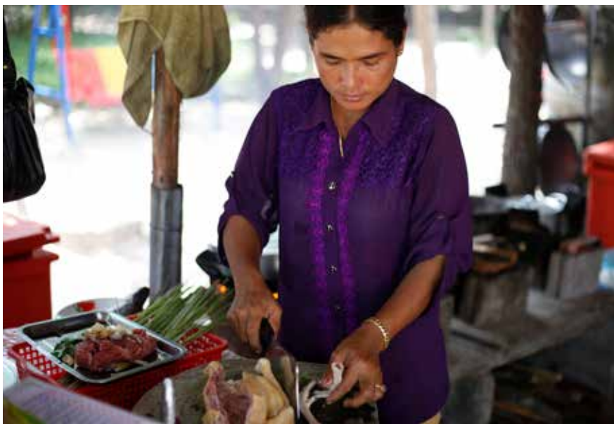
ស្ត្រីមេផ្ទះកំពុងចម្អិនម្ហូបអាហារសម្រាប់គ្រួសារប្រចាំថ្ងៃ។ ការិយាល័យផ្សព្វផ្សាយព័ត៌មានកាតូលិកកម្ពុជា

អ្នកស្រីបាននិយាយថា៖ «ពួកយើងនៅពេលនេះមិនដែលបានទិញរបស់ល្អទៅញ៉ាំទេ ពេលខ្លះខ្ញុំទិញកូនត្រីតូចៗនិងបន្លែទៅស្លែងព្រលឹក ត្រកូនហូបគ្រាន់តែចម្អែតពោះប៉ុណ្ណោះ ហើយពេល