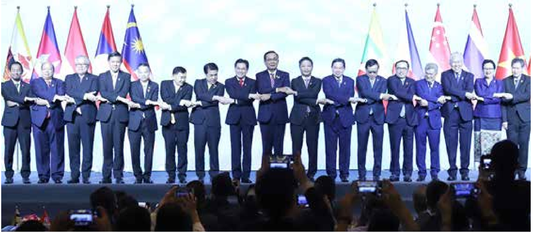
លោកនាយករដ្ឋមន្ត្រីថៃលោកប្រាយុតចាន់អូចា (កណ្តាល) និងរដ្ឋមន្ត្រីអាស៊ានក្នុងកិច្ចប្រជុំរដ្ឋមន្ត្រីសេដ្ឋកិច្ចអាស៊ានលើកទី ៥១ (AEM៥១) នៅទីក្រុងបាងកកប្រទេសថៃ កាលពីឆ្នាំ២០១៩ កន្លងទៅ។ Jurnal Vietnam News

Opening Ceremony for the 51 st ASEAN Economic Ministers' Meeting and Related Meetings 6 September 2019, Bangkok, Thailand