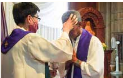
ព្រះវិហារសន្តូរ្យង់ស្វ័រសារីយេ ស្វាយស៊ីសុផុន