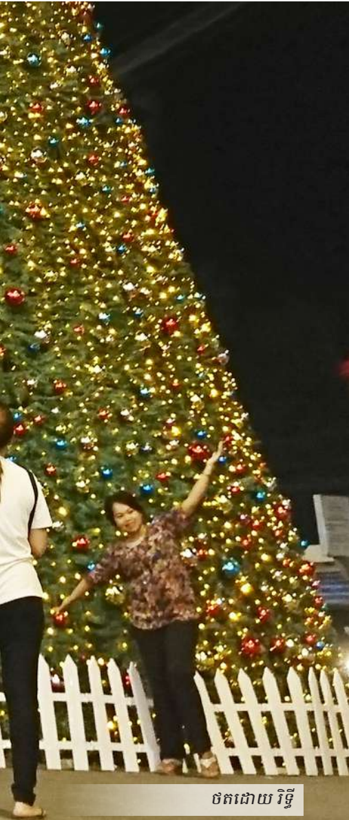
ថតដោយ វិទ្យា