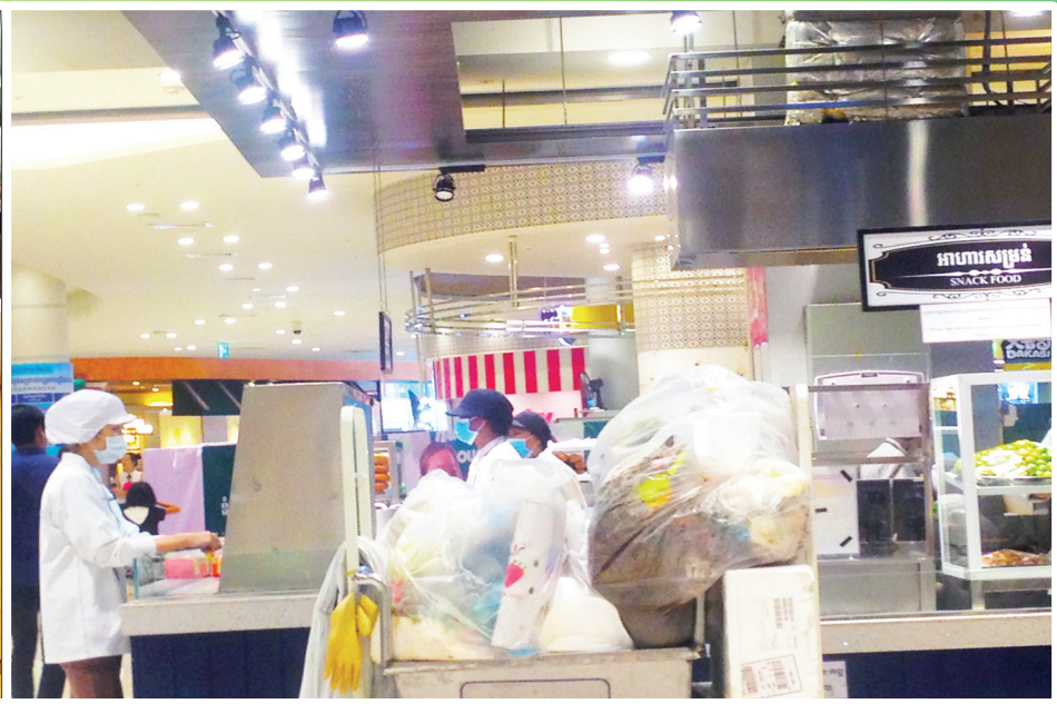
កាកសំណល់ផ្លាស្ទិកនៅអាហារដ្ឋាន ផ្សារទំនើប អ៊ីអនម៉ល (Aeon Mall)