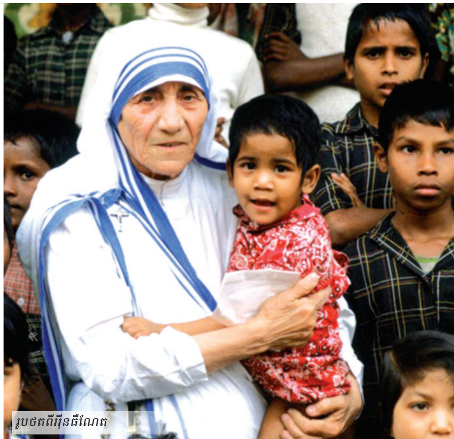
រូបថតពីអ៊ិនធឺណែត