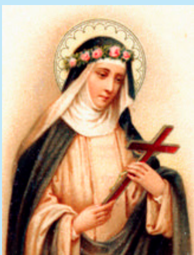
សន្តិវសា នៅក្រុងលីម៉ា

នៅថ្ងៃទី១១ មីនា ១៩៧២ ពួកគេនាំលោកទៅទាំងចងស្លាបសេក ។ មួយថ្ងៃក្រោយមក ស្ត្រីគ្រីស្ទ-បរិស័ទម្នាក់ ដែលតែងយកចំណីអាហារបន្តិចបន្តួចទៅជូនលោក ឃើញបុរសម្នាក់យកអាវបំពង់ខ្មៅរបស់លោកមកពាក់ ។ ក៏ប៉ុន្តែបុរសនោះមិនមែនជាលោកឌុងទេ! ប្រហែលជាគេបានសម្លាប់លោកចោល ក្នុងពេលយប់នោះទៅហើយ ។