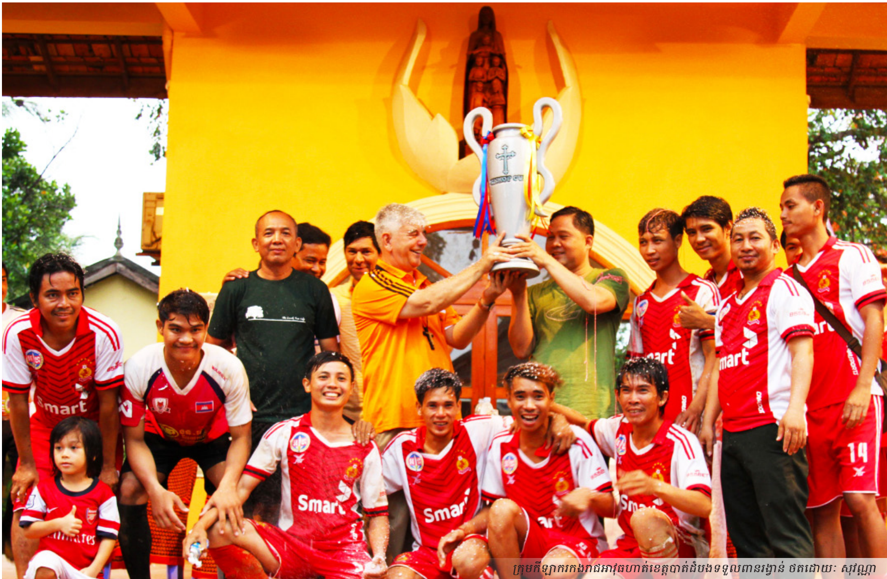
ក្រុមកីឡាករកងរាជអាវុធបាត់ដំបងទទួលពានរង្វាន់

ក្រុមកីឡាករមហាជន ក្រុមកុមារអាយុ ក្រោម១៣ឆ្នាំ និងក្រុមកីឡាការិនី មកពី ព្រះសហគមន៍នានា នៃភូមិភាគបាត់ដំបង និងក្រុមកីឡាមហាជនមកពីស្ថាប័ននានា ក្នុងទីរួមខេត្តបាត់ដំបង ចូលរួមប្រកួតគ្នាយ៉ាងស្វិតស្វាញអស់រយៈពេលជាងមួយខែ ដើម្បីជណ្តើមពានរង្វាន់លោកអភិបាល អេនរីកេ ហ្វីកាវ៉េដូ អភិបាលព្រះសហគមន៍កាតូលិកប្រចាំភូមិភាគបាត់ដំបង ។