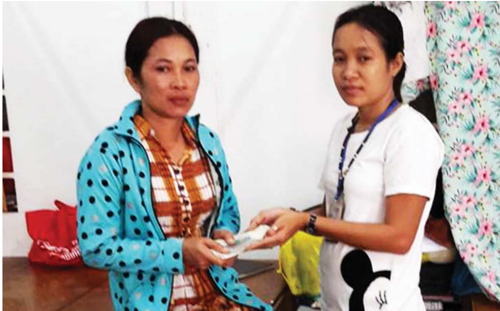
សហជីពកម្មករកម្ពុជាបានជូនលុយដល់កម្មករឈឺរះកាត់ស្បែក

កម្មករនិងកម្មការនីរោងចក្រកាត់ដេរ មួយចំនួននៅក្នុងទីក្រុងភ្នំពេញអះអាង ថា សហជីពពិតជាសំខាន់សម្រាប់ពួកគេ ទោះបីយ៉ាងណាក៏ដោយ ពួកគេមិន បានតាមដានចំពោះ ព័ត៌មានជុំវិញការ វិវត្តន៍នៃច្បាប់សហជីពឡើយ។