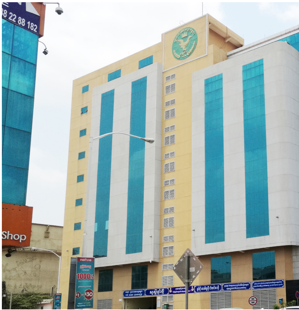
អគារអគ្គនាយកដ្ឋានពន្ធដារស្ថិតនៅក្នុងខណ្ឌទួលគោក។