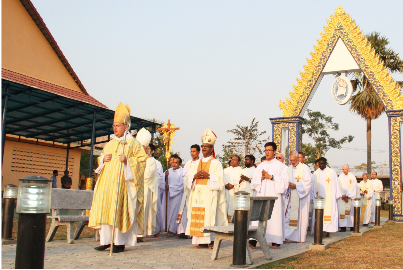
លោកអភិបាលនិងបូជាចារ្យដើរឆ្លងកាត់ទ្វារដ៏សុទ្ធដែលស្ថិតនៅក្នុងមណ្ឌលសកម្មភាពភ្នំពេញថ្មី។

លោកអភិបាល និងលោកបូជាចារ្យ ព្រះសហគមន៍កាតូលិកទាំងបីភូមិភាគ បានជួបជុំគ្នា ដើម្បីធ្វើពិធីប្រសិទ្ធិពរលើ ប្រេង និងរំលឹកពាក្យសច្ចាឡើងវិញរបស់ លោកបូជាចារ្យ ដែលមានគ្រីស្ទបរិស័ទ ចូលរួមប្រមាណជិត១០០០នាក់ កាល ពីថ្ងៃទី១៦ មីនា កន្លងទៅនៅមណ្ឌល សកម្មភាពភ្នំពេញថ្មី ក្នុងខណ្ឌសែនសុខ រាជធានីភ្នំពេញ។