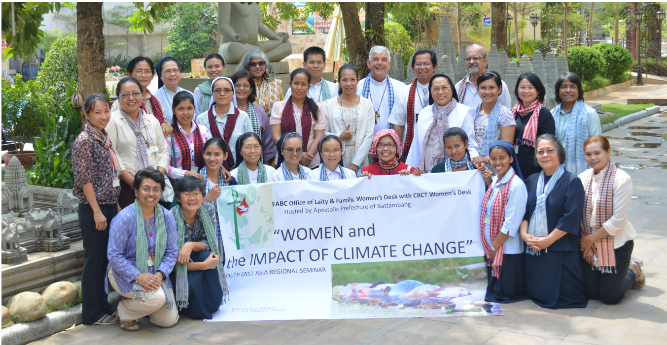
រូបថតជុំគ្នារបស់សិក្ខាកាមក្នុងសិក្ខាសាលាស្តីអំពីស្ត្រី និងផលប៉ះពាល់ពីការប្រែប្រួលអាកាសធាតុ។