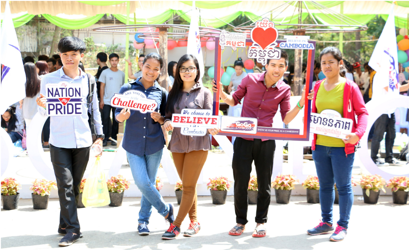
យុវជនចូលរួមកម្មវិធីសប្បុរសធម៌លើកទី៧ក្នុងថ្ងៃបុណ្យទិវានៃក្តីស្រឡាញ់ នៅសកលវិទ្យាល័យភូមិន្ទភ្នំពេញ ក្នុងថ្ងៃទី១៤ កុម្ភៈ ២០១៦។

ខណៈដែលប្រជាពលរដ្ឋកម្ពុជា ត្រូវបានឈប់សម្រាកបុណ្យមាយាមបូជា កាលពីថ្ងៃទី២២ ខែកុម្ភៈ ឆ្នាំ២០១៦ យុវជនកម្ពុជាមួយចំនួនបានអះអាងថា ពួកគេមិនបានដឹងថា តើថ្ងៃនេះឈប់សម្រាកដោយសារពិធីបុណ្យអ្វីនោះទេ។