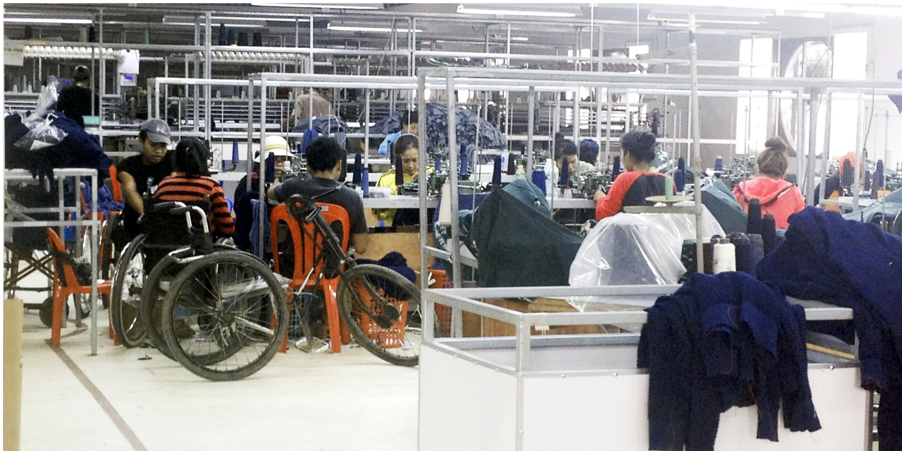
កម្មករ-ការិនីកំពុងតភ្ជាប់កំណត់អាវដែលបានត្បាញរួច ។

នៅក្នុងបាត់ដំបង ព្រះសហគមន៍កាតូលិក បានបង្កើតសិប្បកម្មតម្បាញមួយដែលអាចជួយសម្រួលដល់ជីវភាពប្រជាជន ក្នុងតំបន់ប្រមាណ ១០០ នាក់។ សិប្បកម្មមួយនេះ បានផ្តល់នូវបរិយាកាសទំនាក់ទំនង និង អំណរសប្បាយ ដល់អ្នកធ្វើការងារនៅទីនោះ។