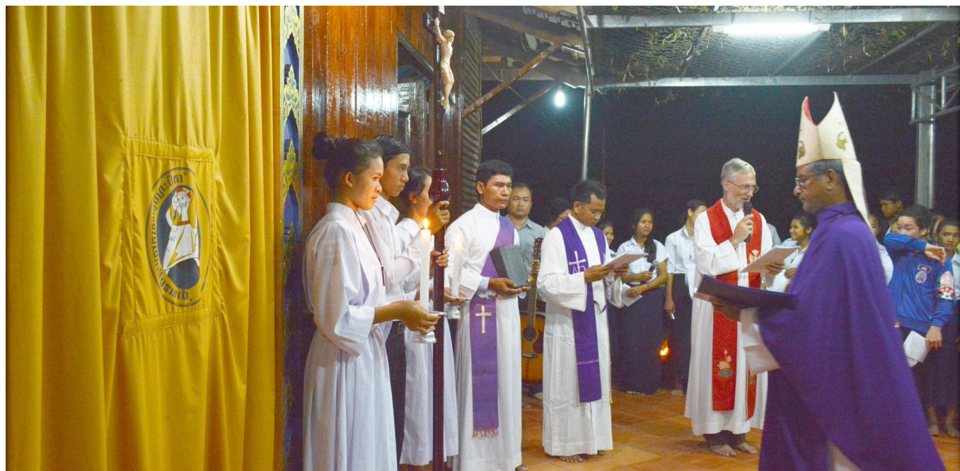
លោកអភិបាល លោកបូជាចារ្យ និងគ្រីស្ទបរិស័ទអធិដ្ឋាននៅមុខទ្វារជីវិតនៅ កោះរការ។