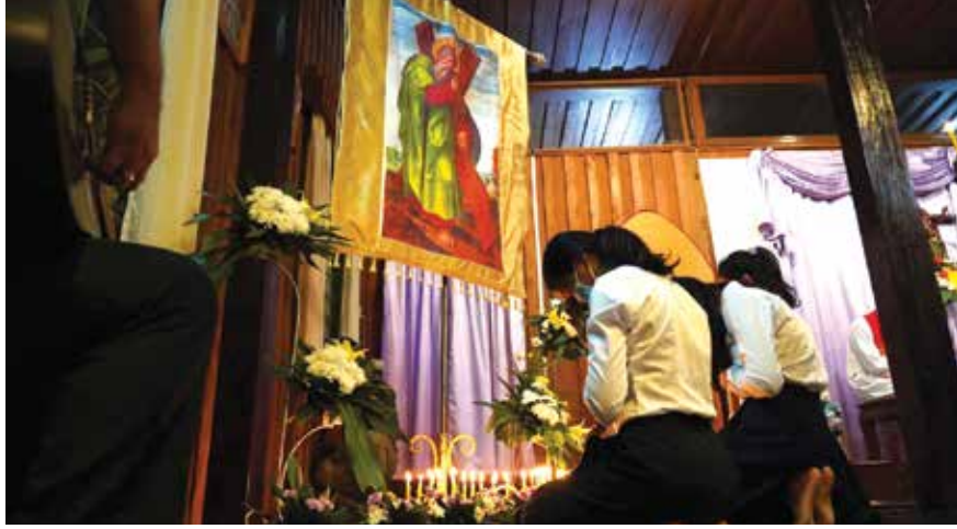
សកម្មភាពក្នុងពិធីបុណ្យគោរពសន្តមន៍ជ្រៃជាត្រីសុទ្ធករបស់ព្រះហឫតមន៍កាតូលិកភូមិភាគកំពង់ចាម។