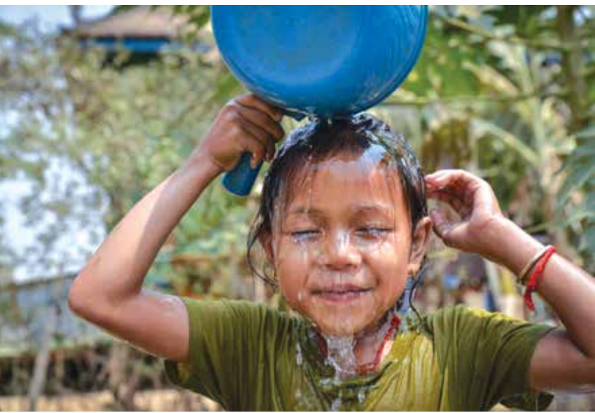
Jumna/ UNICEF Cambodia/Fani Llaurodo

ដើម្បីបំពេញតម្រូវការរបស់ប្រជាពលរដ្ឋ។ លោក ប៉ា សុជាតិវង្ស បន្ថែមថា ការបង្កើតស្ថានីយផលិតទឹកស្អាតនីមួយៗទាមទារឱ្យមានផែនការត្រឹមត្រូវ មានជំហានអនុវត្តន៍ ការចំណាយពេលវេលា និងទីការច្រើនក្នុងការសាងសង់។ លោកបានបន្តថា រាជរដ្ឋាភិបាលកំពុងកសាងស្ថានីយផលិតទឹកស្អាតនៅបឹងកេងកងដែលនឹងរួចរាល់នៅឆ្នាំ២០២៣ ដូច្នេះអាចឆ្លើយតបជាមួយនឹងតម្រូវការរបស់ប្រជាពលរដ្ឋដែលរស់នៅក្នុងខណ្ឌពោធិ៍សែនជ័យ ខណ្ឌកំបូល និងខណ្ឌព្រៃកេងកងផងដែរ។ ការបង្ហាញផែនការផ្គត់ផ្គង់ទឹកស្អាតជូនឆ្នាំ២០២២ ឆ្លើយតបទៅនឹងសំណើរបស់ប្រជាពលរដ្ឋនៅក្នុងខណ្ឌពោធិ៍សែនជ័យដែលបានលើកឡើងពីបញ្ហាខ្វះខាតទឹកស្អាតប្រើប្រាស់នៅក្នុងសង្កាត់មួយចំនួន ហើយត្រូវទិញទឹកពីភ្នាក់ងារឯកជនក្នុងតម្លៃថ្លៃរហូតដល់៣០០០ រៀលក្នុងមួយគូប។ លោក ហេង សុផាន់ណារ៉ាត តំណាងរដ្ឋាករ