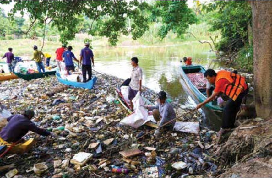
ប្រជាពលរដ្ឋប្រមូលសម្រាមនៅក្នុងទិវាអនាម័យបរិស្ថានជាតិ ២៣ វិច្ឆិកា។

លោកថា ហេតុផលដែលចាំបាច់ប្លាស្ទិកត្រូវបានគេចាក់ទុកថាជាការបំពុលដល់បរិស្ថាន ព្រោះថាវាត្រូវការពេលវេលាវែងជាច្រើនរយឆ្នាំ ដើម្បីធ្វើការបំបែកសារធាតុមានន័យថាសំណល់ប្លាស្ទិកគឺសារធាតុដែលមិនងាយនឹងពុកផុយ ឬលូលូបានដោយងាយឡើយ។ សំណល់ចង់ប្លាស្ទិកបានផ្តល់ផលប៉ះពាល់ដល់សង្គម សុខភាព និងគុណភាពបរិស្ថានរួមមាន៖ ការធ្វើឱ្យសុប្រព័ន្ធបង្ហូរទឹកលូដែលល្អឱ្យមានទឹកជំនន់នៅ