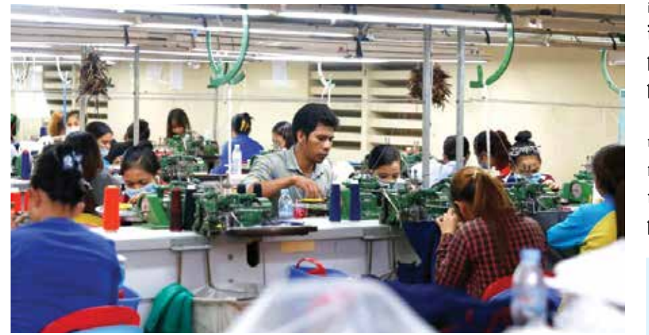
បុគ្គលិកកំពុងបំពេញការងារក្នុងរោងចក្រមួយនាព្រំដែនភ្នំពេញ។

អត្ថបទ៖ ផល ស្ករជាតិ សមាគមរោងចក្រកាត់ដេរនៅកម្ពុជា (GMAC) បានចេញសារណែនាំ សម្រាប់សមាជិកសមាគមស្តីពីកម្ពុជា និងប្រព័ន្ធអនុគ្រោះទូទៅ (GSP) របស់អង់គ្លេសកាលពីខែវិច្ឆិកា កន្លងមកនេះ។ GMAC បានឱ្យដឹងថា យោងទៅលើផ្នែកនៃអន្តរកាល នៃការចាកចេញពីសហភាពអឺរ៉ុបរបស់ប្រទេសអង់គ្លេស (Brexit) វិធានថ្មីសម្រាប់ឆ្នាំ២០២១ ដែលចេញដោយនាយកដ្ឋានពាណិជ្ជកម្មអន្តរជាតិរបស់អង់គ្លេស កាលពីថ្ងៃទី១០ ខែវិច្ឆិកា ឆ្នាំ២០២០។ ប្រទេសអង់គ្លេស បានចាកចេញពីសហភាពអឺរ៉ុប ហើយរយៈពេលអន្តរកាលបន្ទាប់ពី Brexit នឹងត្រូវបញ្ចប់នៅចុងឆ្នាំនេះ។ ចាប់ពីថ្ងៃទី១ ខែមករា ឆ្នាំ២០២១ ប្រទេសដែលមានលក្ខណៈសម្បូរជាប្រទេសកំពុងអភិវឌ្ឍន៍ នឹងអាចទទួលបានការអនុគ្រោះពាណិជ្ជកម្មតាមរយៈប្រព័ន្ធ GSP របស់អង់គ្លេស។ ប្រព័ន្ធ GSP របស់អង់គ្លេសនេះ ជំរុញនឹងផ្តល់ការអនុគ្រោះពាណិជ្ជកម្មទៅប្រទេសនានាដូច GSP របស់សហភាពអឺរ៉ុបដែរ។