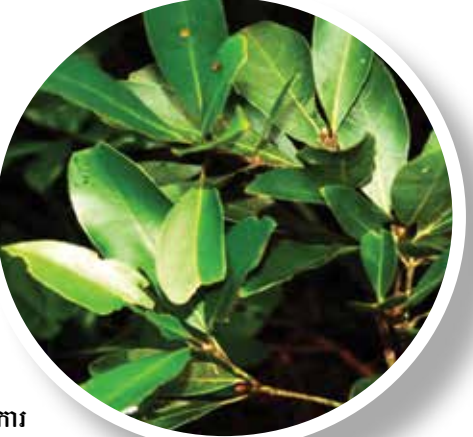
រុក្ខជាតិ ម៉ាណីលូស សិមេនស៊ីស (Machilus seimensis)។

ធ្វើការនៅប្រទេសកូរ៉េ លោករដ្ឋមន្ត្រីបានលើកឡើងថា បន្ទាប់ពីស្ថានភាពកូវីដ-១៩ នៅប្រទេសកូរ៉េមានភាពធូរស្រាល ដែលអាចទទួលយកកម្លាំងពលកម្មបរទេសបាន កម្ពុជារំពឹងថានឹងក្លាយជាប្រទេសអាទិភាពមួយក្នុងចំណោមប្រទេសចំនួន ១៥ ផ្សេងទៀត ដោយសារកម្ពុជាមានស្ថានភាពកូរ៉េដែលប្រសើរ មានជើងហោះហើរច្រើន។ ឯកអគ្គរដ្ឋទូតសាធារណរដ្ឋកូរ៉េ លោក Park Heung Kyeong បានលើកឡើងនាឱកាសនោះផងដែរថា នៅក្នុងឆ្នាំ២០១៩ ពលករកម្ពុជាមានចំនួនច្រើនជាងគេក្នុងចំណោមពលករដែលធ្វើការនៅប្រទេសកូរ៉េ ហើយក្នុងដំណាក់កាលជំងឺកូវីដ-១៩ ឆ្នាំ២០២០នេះ រដ្ឋាភិបាលសាធារណរដ្ឋកូរ៉េនៅតែអនុញ្ញាតទទួលពលករកម្ពុជាដដែល។