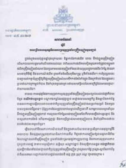
សារាចរណែនាំរបស់រាជរដ្ឋាភិបាល និងរូបភាពជនល្មើស និងគ្រឿងញៀនដែលប្តូរលិខិតប័ណ្ណបាន កាលពីពេលកន្លងទៅ។

រាជរដ្ឋាភិបាល សូមធ្វើការណែនាំដល់អាជ្ញាធរជាតិប្រយុទ្ធប្រឆាំងគ្រឿងញៀន ក្រសួងមហាផ្ទៃ ក្រសួង-ស្ថាប័នពាក់ព័ន្ធ ជាពិសេសគណៈបញ្ជាការឯកភាពរដ្ឋបាល រាជធានី ខេត្ត ក្រុង ស្រុក ខណ្ឌ។ ក្នុងសារាចរណែនាំបានបន្តថា បន្តខិតខំចាត់តាំងអនុវត្តឱ្យបានម៉ឺងម៉ាត់តាមបទបញ្ជាលេខ ០១២.បច្ចុៈថ្ងៃទី១១ ខែកុម្ភៈ ឆ្នាំ២០១៦ របស់រាជរដ្ឋាភិបាលស្តីពីការពង្រឹងវិធានការប្រយុទ្ធប្រឆាំងគ្រឿងញៀន។ បន្តិចសកម្មភាពអនុវត្តផែនការយុទ្ធនាការប្រយុទ្ធប្រឆាំងគ្រឿងញៀនខុសច្បាប់លើកទី៥ ឱ្យបានសកម្មភាពផុលផុស និងត្រូវបន្តកសាង