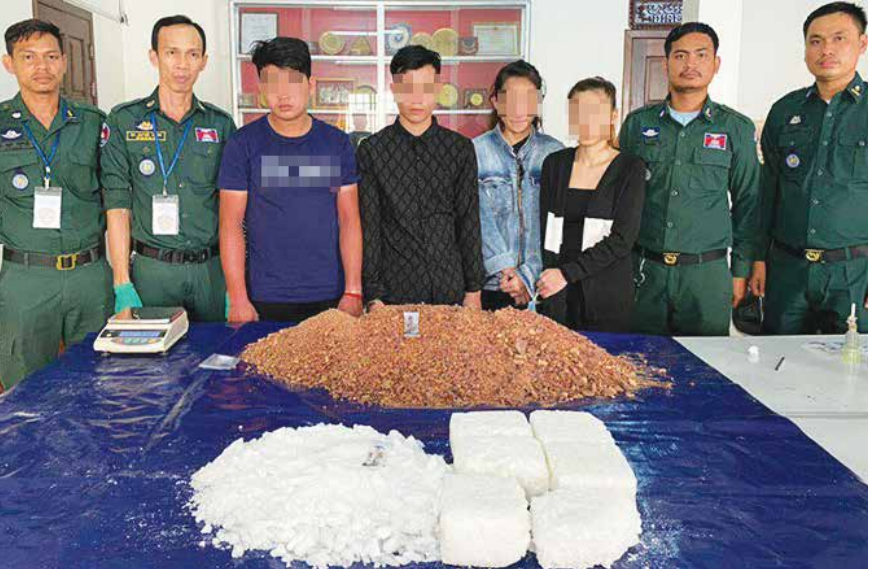
សារាចរណែនាំរបស់រាជរដ្ឋាភិបាល និងរូបភាពជនល្មើស និងគ្រឿងញៀនដែលប្តូរលិខិតប័ណ្ណបាន កាលពីពេលកន្លងទៅ។

ផែនការយុទ្ធនាការជាបន្តបន្ទាប់ ប្រកបដោយនិរន្តរភាព។ លើសពីនេះ លើកកម្ពស់ស្មារតីផ្សព្វផ្សាយ អប់រំឱ្យបានទូលំទូលាយ ស៊ីជម្រៅចំគោលដៅ និងមុខសញ្ញាគ្រប់ទីកន្លែងទាំងក្នុងសហគមន៍ ទាំងក្នុងស្ថាប័នផ្សេង ឯកជន និងក្នុងជួរកងកម្លាំងប្រដាប់អាវុធត្រូវប្រយោជន៍ ដោយអនុវត្តនីតិវិធីផ្សារភ្ជាប់ជាមួយខ្លឹមសារទិសស្នេហា «បីក៏ មួយរាយការណ៍» គឺ កុំពាក់ព័ន្ធ កុំអន្តរាគមន៍ កុំលើកលែង និងត្រូវរាយការណ៍ជូនអាជ្ញាធរមានសមត្ថកិច្ចគ្រប់ករណីបទល្មើសគ្រឿងញៀន។