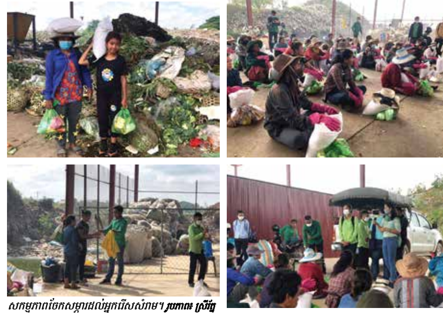
សម្មាគម្មន៍ចែកសម្ភារដល់អ្នករើសសំរាម។

ទេ?»។ លោកអភិបាលបានបន្តទៀតថា អាយុមិន សំខាន់ទេ សំខាន់ត្រូវយកចិត្តទុកដាក់ស្រឡាញ់ សេចក្តីស្រឡាញ់ពេញចិត្តរបស់យើង។ ជាពិសេស ជាងនេះទៅទៀតលោកអភិបាលបញ្ជាក់ទៀតថា យើងត្រូវយកចិត្តទុកដាក់ស្រឡាញ់ព្រះជាម្ចាស់ និងបងប្អូនទៀត។ តាមព្រះយេស៊ូបម្រើយើង។ លោកថា លើសពីនេះទៅទៀត ត្រូវយកចិត្ត ទុកដាក់លើកិច្ចការទាំង៧ទាំងប្រាំមួយវិញ្ញាណ៖ ១) ផ្តល់យោបល់ដល់អ្នកកំពុងសង្ឃឹម។ ២) បម្រើន អប់រំដល់អ្នកខ្លះចំណេះដឹង។ ៣) លើកទឹកចិត្តបង្ហាញផ្លូវ ដល់អ្នកដែលកំពុងធ្វើបាប។ ៤) ធ្វើដំណើរលើកទឹកចិត្ត អ្នកដែលអស់សង្ឃឹម។ ៥) លើកលែងទោសដល់អ្នក ធ្វើបាបយើង។ ៦) តស៊ូជាមួយអ្នកដែលខានយើង។ ៧) អធិដ្ឋានសម្រាប់មនុស្សទាំងអស់ ទាំងស្រាប់។ នៅក្នុងពិធីនេះដែរ លោកអភិបាលបានសួរ បញ្ជាក់ដំឡើងបេក្ខជន ទាំងបងប្អូន និងទាំងគ្រូ អប់រំដំឡើងជាមួយគ្រីស្ទបរិស័ទទាំងអស់ ដោយ យេស៊ូដែលស្នូរយើងថា «ប្អូនអើយ មានបាន យកចិត្តទុកដាក់ស្រឡាញ់មនុស្សនៅលើផែនដីនេះ អំពើបាប។