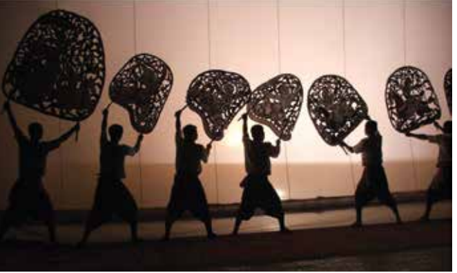
ការសម្តែងល្ខោនស្បែកធំ។ យុវជនដែលទទួលបានការបណ្តុះបណ្តាល ជំនាញល្ខោនស្បែកធំ មិនរំពឹងពីការរកប្រាក់ចំណូលពីល្ខោននេះនោះទេ។