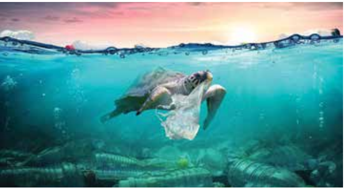
ប្លាស្ទិកនៅក្នុងសមុទ្រ ពិតជាពុំក្នុងបង្កព្រោះផ្ទះផ្ទះកំពុងបំផុតដល់ជីវិតសត្វ និងមនុស្ស។

យោងតាមក្រសួងបរិស្ថានបាន ឱ្យដឹងថា បរិមាណប្លាស្ទិកសរុបក្នុងសកលលោកទាំងមូលបានកើនឡើងដល់ ៨,៣ លានតោន។ ជាញឹកញាប់ មានប្លាស្ទិក ១៣ លានតោន ហូរចូលទៅក្នុងសមុទ្រ ដែលស្មើនឹងការចាក់សំរាមមួយឡានដឹកសំរាមពេញ រៀងរាល់មួយនាទី ដែលហូរចូលទៅក្នុងសមុទ្រមានប្រភព