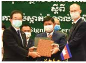
ពិធីចុះហត្ថលេខាលើកិច្ចព្រមព្រៀងអនុវត្តន៍ស្តីពីការទប់ស្កាត់សំណល់ប្លាស្ទិកសមុទ្រ។ រូបភាព៖ ក្រសួងបរិស្ថាន

ស្ថានទូតជប៉ុន និងកម្មវិធីអភិវឌ្ឍន៍សហប្រជាជាតិ (UNDP) បានចុះហត្ថលេខាលើកិច្ចព្រមព្រៀងអនុវត្តន៍ «គម្រោងទប់ស្កាត់នឹងសំណល់ប្លាស្ទិកក្នុងសមុទ្រនៅកម្ពុជា» កាលពីថ្ងៃទី២៥ ខែវិច្ឆិកា ឆ្នាំ២០២០ កន្លងមកនេះ។