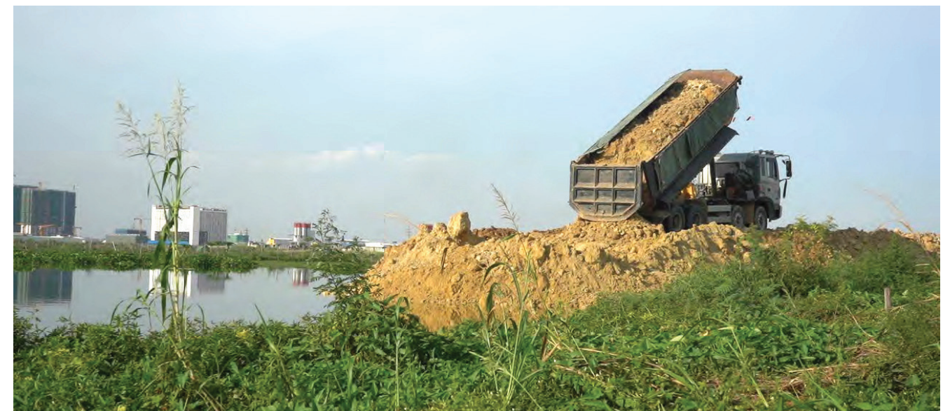
ថយខ្លួនកំពុងដឹកដីមកចាក់បំពេញផ្ទៃដីបឹងទំពុនដើម្បីធ្វើការអភិវឌ្ឍ។

សមាជិកសហគមន៍មកពីតំបន់បឹងទំពុនឬជើងឯក បាននិយាយកាលពីខែឧសភា ឆ្នាំ២០២០កន្លងទៅនេះថា៖ «ខ្ញុំគិតថា វានឹងប៉ះពាល់ដល់ប្រជាជនក្រីក្រដែលជាប់ទន្លេ និងទេសាទត្រីនៅក្នុងតំបន់បឹងនេះ