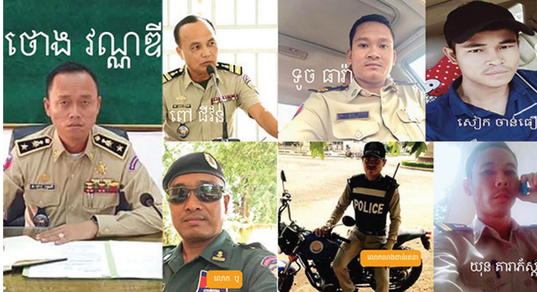
មន្ត្រីនគរបាលជាតិចំនួន៧នាក់ នៃស្នងការដ្ឋាននគរបាលខេត្តព្រៃវែង ដែលត្រូវបានផ្អាកការងារនិងស្ថិតក្រោមការស៊ើបអង្កេត។

មន្ត្រីនគរបាលទាំងនោះបានចាប់ប្រជា ពលរដ្ឋធ្វើទារុណកម្មយ៉ាងព្រៃវែង រួច ជំរិតទារុណកម្មបានសម្រេច១,០០០ដុល្លារ អាមេរិក។ គឺក្រុមនេះបានបង្កប់ឱ្យនិពុក ម្តាយជនរងគ្រោះ យកលុយ៤,០០០, ០០០, រៀលមកឱ្យប្រើលើសជាថ្នូរនឹងការ ដោះលែងឱ្យជនរងគ្រោះទៅផ្ទះវិញ។