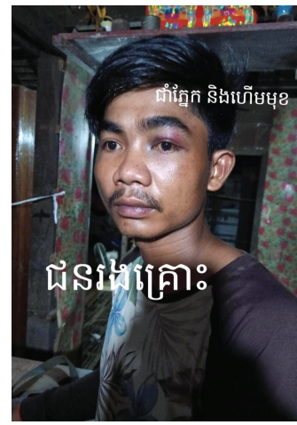
ជនរងគ្រោះបុរសហើមក្បាល ជាភ្នែក ខៀវ ហើមខ្លួននិងដៃជើង រងរបួសធ្ងន់។

ព្រៃវែង ដើម្បីរង់ចាំការសម្រេចជាថ្មី។ គួរបញ្ជាក់ផងដែរថា ការផ្អាកពី ការងារបណ្តោះអាសន្ននេះធ្វើឡើងបន្ទាប់ ពីប្រជាពលរដ្ឋបានប្តឹងនឹងចោទប្រកាន់