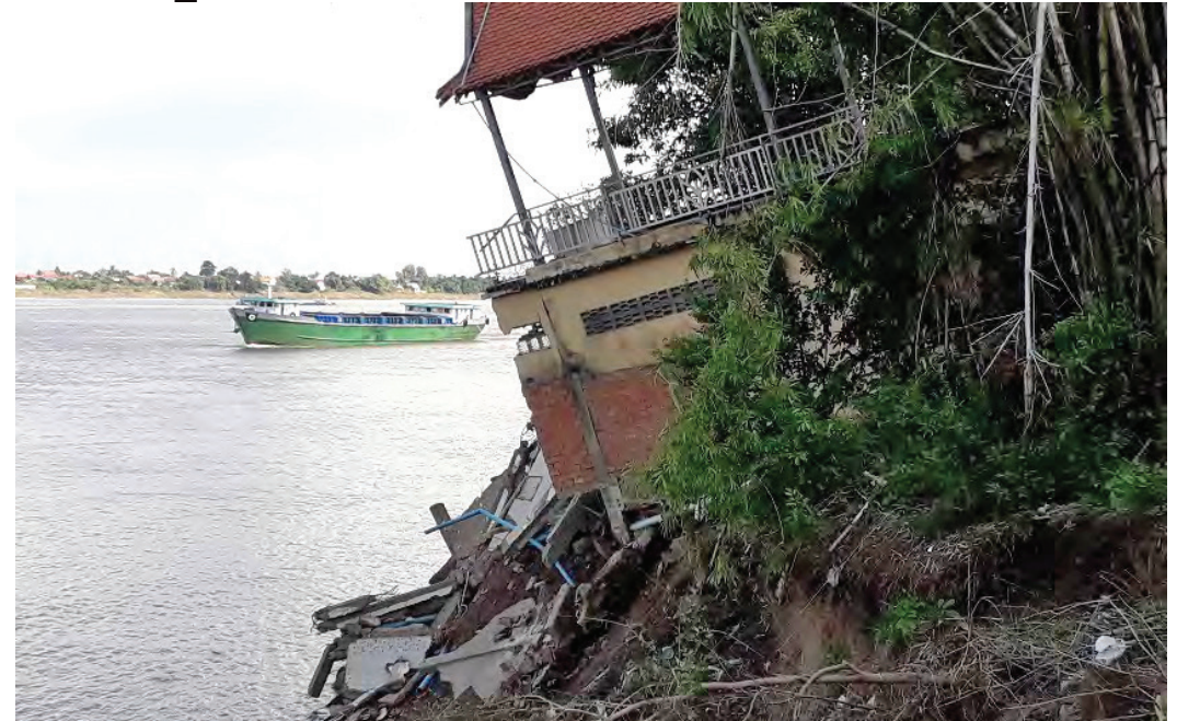
ផ្ទះនៅតាមច្រាំងទន្លេមានការបាក់ស្រុក។