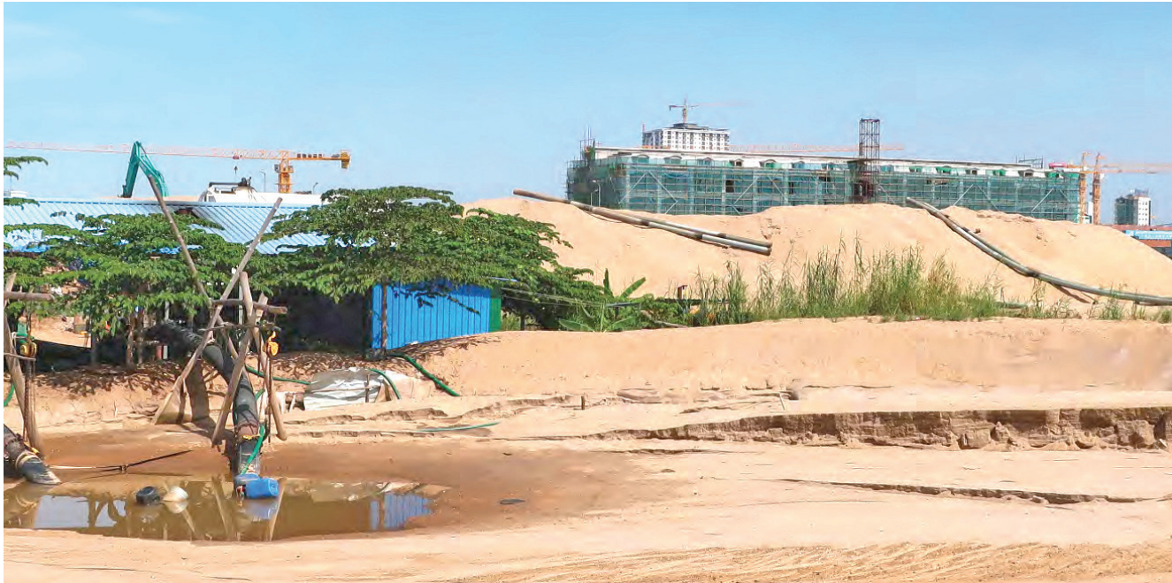
ខ្សាច់មកពីទន្លេត្រូវបានប្រើប្រាស់ដើម្បីបាក់បំពេញតំបន់ជាច្រើននៅក្នុងតំបន់បឹងទំពុន ឬជើងឯកតាមបណ្តោយមហាវិថីសម្តេចហ៊ុន សែន (ផ្លូវលេខ៦០៧)។

អង្គការសម្ព័ន្ធខ្មែរជំរឿននិងការពារសិទ្ធិមនុស្ស លីកាដូ (LICADHO) បណ្តាញយុវជនកម្ពុជា (CYN) អង្គការសមធម៌កម្ពុជា(EC) និងអង្គការសមាគមធាងត្នោត(STT) បានបង្ហាញថា ប្រជាពលរដ្ឋជាងមួយលាននាក់នៅក្នុងរាជធានីភ្នំពេញកំពុងប្រឈមនឹងការរីកចម្រើននៃទឹកជំនន់ និងមានមនុស្សជាងមួយពាន់គ្រួសារទៀតកំពុងប្រឈមនឹងការបណ្តេញចេញ ការបាក់បែកប្រាក់ចំណូល និងអសន្តិសុខស្បៀងខណៈដែលគម្រោងអភិវឌ្ឍន៍ អាយ អិន ជី ស៊ីធី(ING City) និង គម្រោងផ្សេងៗទៀតបាននិងកំពុងធ្វើឱ្យប៉ះពាល់តំបន់បឹងទំពុន ឬជើងឯកដែលស្ថិតនៅភាគខាងត្បូងរាជធានីភ្នំពេញ។