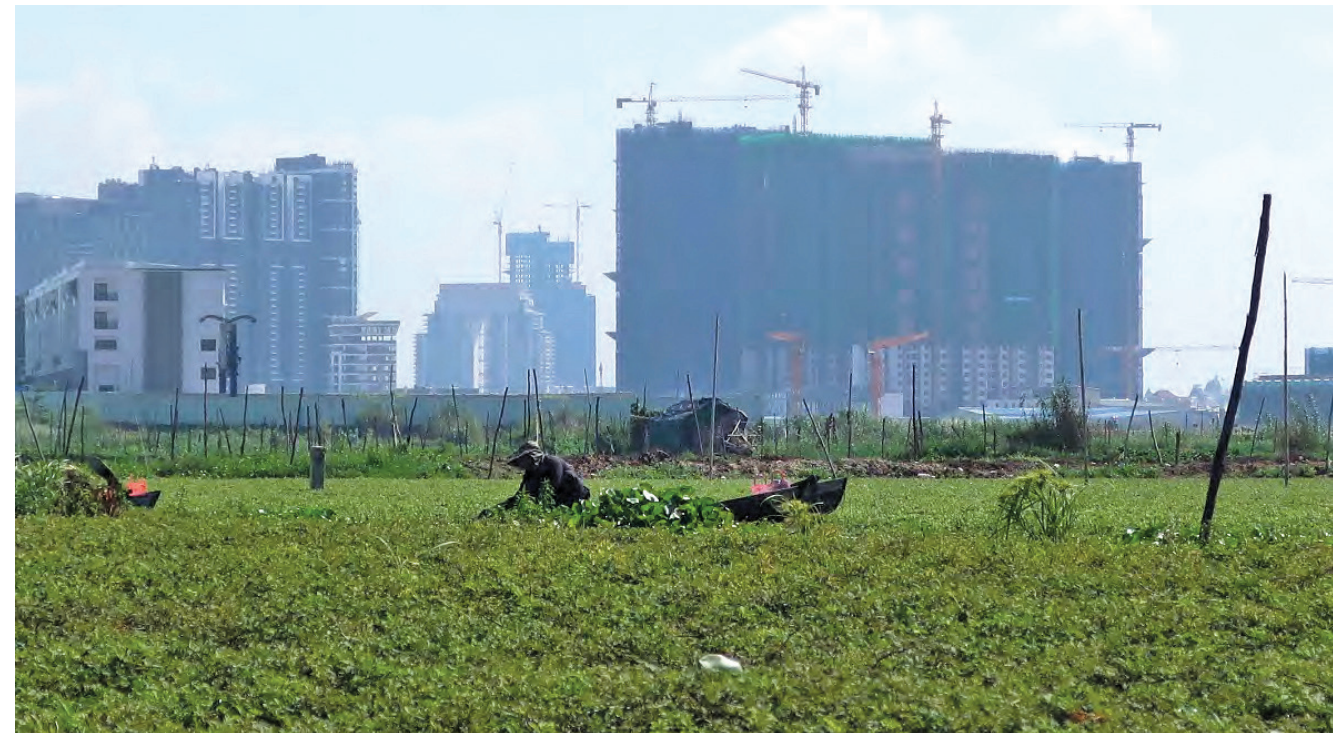
ប្រជាជនកំពុងប្រមូលផលដំណាំលើទឹកនៅក្នុងផ្ទៃដីបឹងទំពុន។

នេះដែលពួកគេកាត់នឹងមិនអាចធ្វើបានទេនៅពេលដែលតំបន់បឹងត្រូវបានបំផ្លិចបំផ្លាញ។