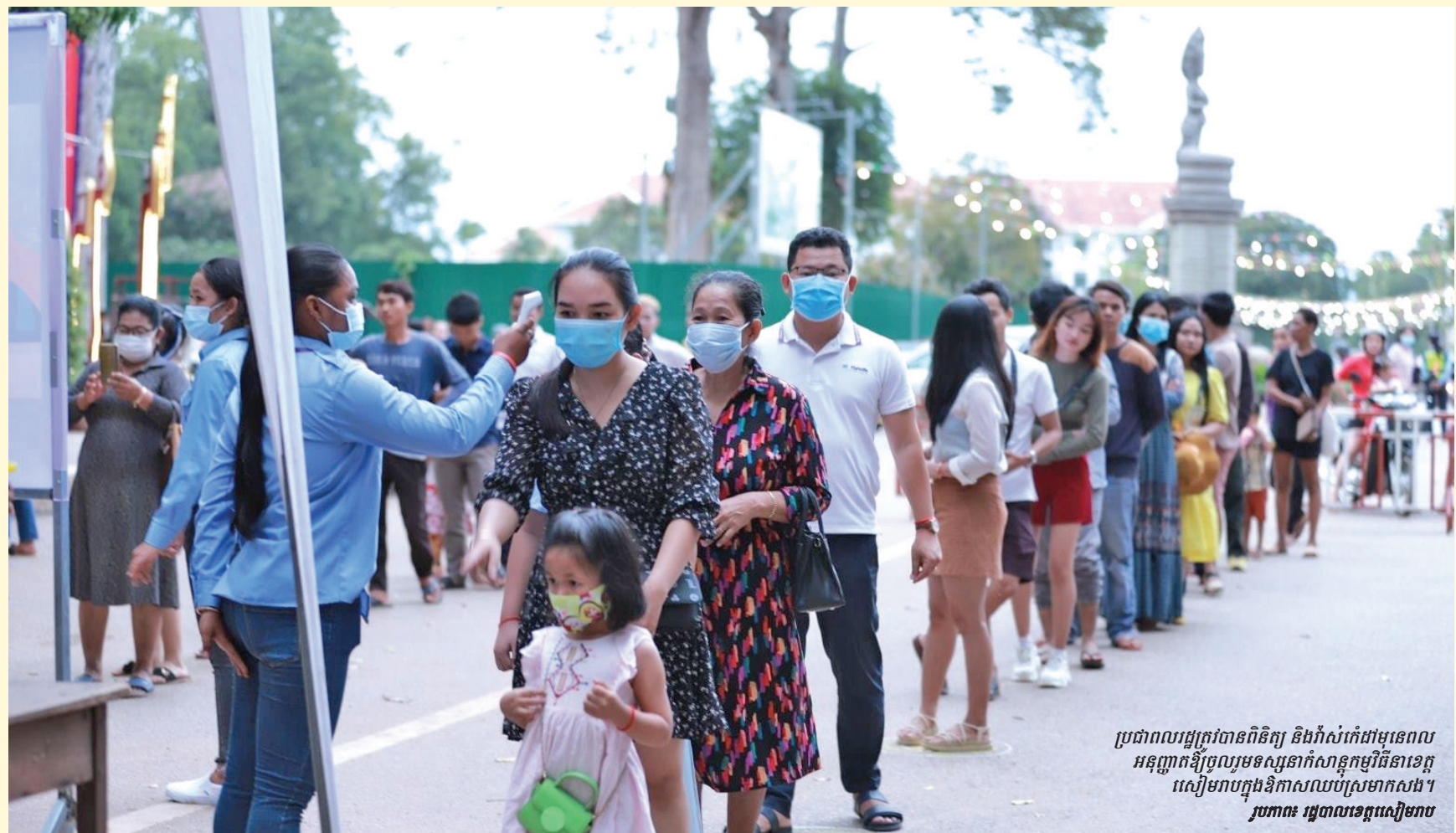
ប្រជាពលរដ្ឋត្រូវបានពិនិត្យ និងវ៉ាក់សាំងមុនពេលអនុញ្ញាតឱ្យចូលរួមទស្សនាវិទ្យាល័យវិទ្យាសាស្ត្រស្រីមេរោគសាស្ត្រសៀមរាបក្នុងវិទ្យាសាលាបឋមស្រុកសង។