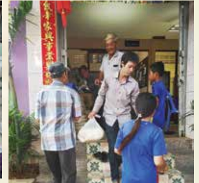
ព្រះសហគមន៍ចម្ការទៀង ជូនអង្ករ និងគ្រឿងឧបភោគដល់អ្នកផ្ទុក មេរោគអេដស៍និងជំងឺអេដស៍