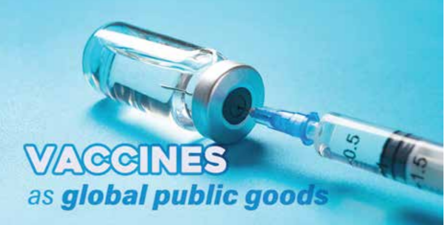
ប្រទេសជាច្រើនលើពិភពលោកកំពុងស្រាវជ្រាវឱ្យចាត់ទុកវ៉ាក់សាំងប្រឆាំងកូវីដ១៩។