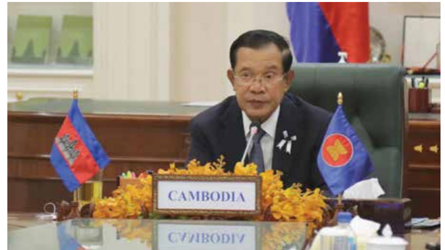
សម្តេចតេជោ ហ៊ុន សែន ប្រមុខរាជរដ្ឋាភិបាលកម្ពុជានៅក្នុងកិច្ចប្រជុំកំពូលអាស៊ាន។

អត្ថបទ៖ អរិយបុត្រ ប្រមុខរាជរដ្ឋាភិបាលកម្ពុជាបានធ្វើការកាត់សំគាល់ ថា កម្ពុជាជាប្រទេសនាំមុខមួយទាក់ទងនឹងតំនិតតូច ធ្វើមសហហរណាកម្មអាស៊ាន។ ថ្ងៃទី១២ ខែមិថុនា ឆ្នាំ២០២០កន្លងមក នេះ ដែលបានរៀបចំតាមប្រព័ន្ធដើម្បីជំរុញវិស័យ (video conference) សម្តេចតេជោ ហ៊ុន សែន បាន ថ្លែងថា វានៅតែជាការវាងវាងសំខាន់សម្រាប់អាស៊ាន ក្នុងការកសាងសហគមន៍ដែលប្រកាន់យកប្រជាជន ជាស្នូល (People-centered community)។ សម្តេច បានធ្វើការកាត់សំគាល់ដោយក្រីករយល់ដឹងអាស៊ាន សម្រេចបានប្រមាណជាង៨៨% នូវការអនុវត្តផែនការ លើកទី៣នៃការផ្តួចផ្តើមសហហរណាកម្មអាស៊ាន