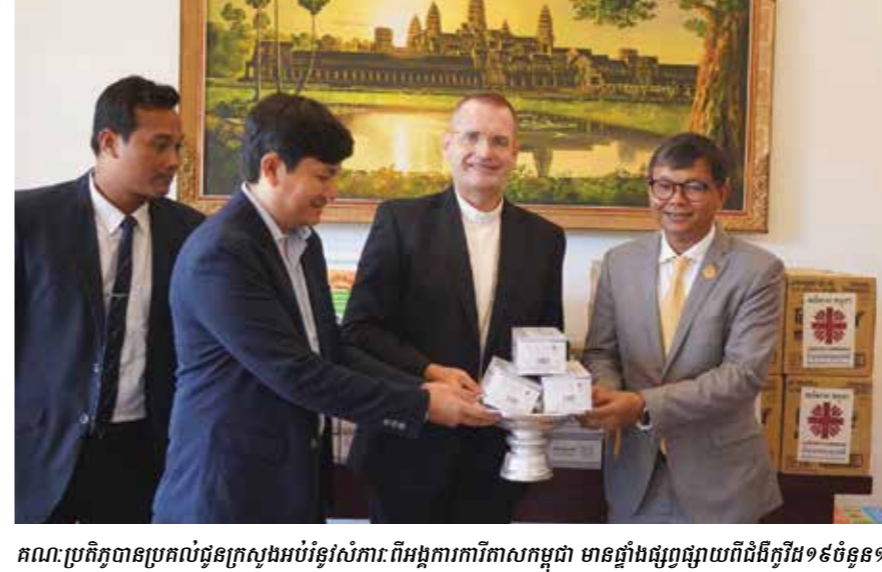
គណៈប្រតិភូបានប្រគល់ជូនក្រសួងអប់រំនូវសំភារៈពិអង្គការការីតាសកម្ពុជា មានផ្លាស់ផ្សូផ្សាយពីជំងឺកូវីដ១៩ចំនួន១០០០សន្លឹក។ ម៉ាសកាតាចំនួន១០០ប្រអប់។ សាបូណាងដែមចំនួន២០០០ដុំ និងអាវកុលចំនួន១០០លើត្រ។ ស៊ីអេសស៊ី