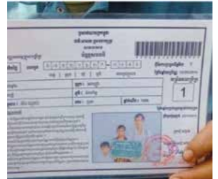
បណ្តា [ក្រ-១] ក្នុង១គ្រួសារទទួលបានប្រាក់ចំនួន៥ម៉ឺន រៀល ប្រកបបន្ថែម២៥០០០រៀលសម្រាប់សមាជិក គ្រួសារម្នាក់ៗ

១គ្រួសារទទួលបានប្រាក់ចំនួន១២ម៉ឺនរៀល ប្រកបបន្ថែម ៥២០០០រៀលសម្រាប់សមាជិកគ្រួសារម្នាក់ៗ ហើយ ប្រកបបន្ថែម៥ ម៉ឺនរៀលម្នាក់ទៀត សម្រាប់សមាជិកនៅ ក្នុងគ្រួសារ ដែលជាកុមារអាយុក្រោម៥ឆ្នាំ, ជាជនមាន ពិការភាព, ជាជនចាស់ជរាអាយុចាប់ពី៦០ឆ្នាំឡើង និងជាអ្នកផ្ទុកមេរោគអេដស៍។ សម្រាប់បណ្តា [ក្រ-២] ដែលក្នុង១គ្រួសារទទួលបានប្រាក់ចំនួន ១២ម៉ឺនរៀល ប្រកបបន្ថែម៥២០០០រៀលសម្រាប់សមាជិក គ្រួសារម្នាក់ៗ ហើយប្រកបបន្ថែម៥២០០០រៀលម្នាក់ ទៀត សម្រាប់សមាជិកនៅក្នុងគ្រួសារ ដែលជាកុមារ អាយុក្រោម៥ឆ្នាំ, ជនមានពិការភាព, ជនចាស់ជរា អាយុចាប់ពី៦០ឆ្នាំឡើង និង អ្នកផ្ទុកមេរោគអេដស៍។ ចំពោះតំបន់ជនបទ សម្រាប់បណ្តា [ក្រ-១] ក្នុង ១គ្រួសារទទួលបានប្រាក់ចំនួន៥ម៉ឺនរៀល ប្រកបបន្ថែម ២៥០០០រៀលសម្រាប់សមាជិកគ្រួសារម្នាក់ៗ ហើយ ប្រកបបន្ថែម២៥០០០រៀលម្នាក់ទៀត សម្រាប់សមាជិក នៅក្នុងគ្រួសារ ដែលជាកុមារអាយុក្រោម៥ឆ្នាំ, ជន មានពិការភាព, ជនចាស់ជរាអាយុចាប់ពី៦០ឆ្នាំឡើង