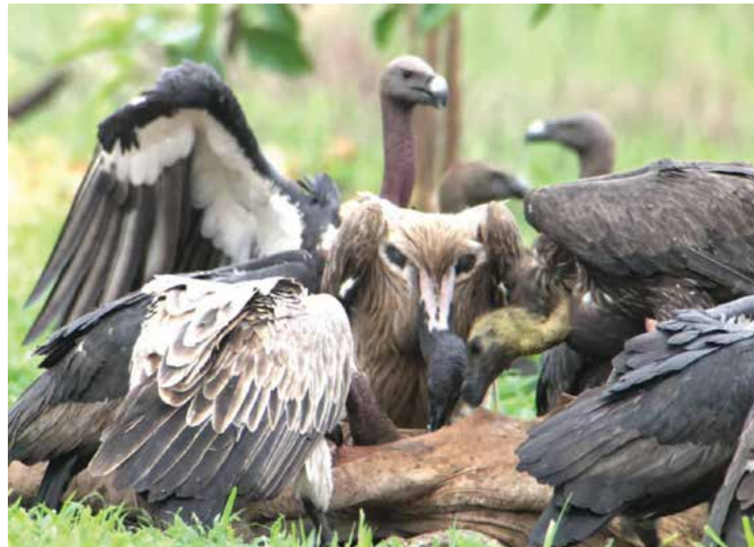
សត្វត្នាតក្នុងស្ថានភាពក្នុងដំណើរការជំរុំសត្វត្នាតប្រចាំឆ្នាំក្នុងសហគមន៍ដង្កិត-អាហារដ្ឋានត្នាត ខេត្តព្រះវិហារ។