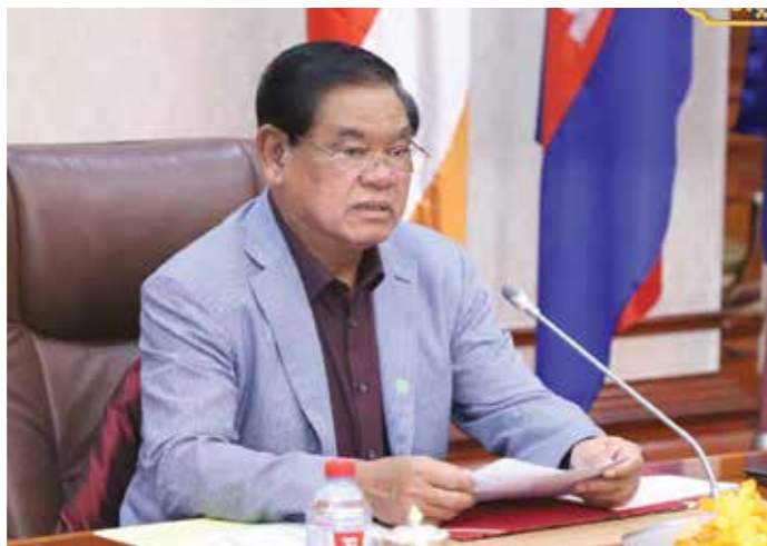
សម្តេចក្រឡាហោម ស ខេង រដ្ឋមន្ត្រីក្រសួងមហាផ្ទៃ។

អង្គការលើកលែងទោសអន្តរជាតិ (Amnesty International) និងអង្គការសម្ព័ន្ធខ្មែរជំនឿនិងការពារសិទ្ធិមនុស្សលីកាដូ (LICADHO) បានចេញសេចក្តីថ្លែងការណ៍រួមនៅថ្ងៃព្រហស្បតិ៍ ទី២៣ ខែកក្កដា ឆ្នាំ២០២០ នេះដោយស្នើសុំ និងសម្តែងថា រាជរដ្ឋាភិបាល កម្ពុជា ក្សានូវការសន្យាដោះលែងអ្នកជាប់ទោសចំនួន ១០,០០០នាក់ ដែលក្នុងនោះមានអ្នកដែលប្រឈមនឹងហានិភ័យខ្ពស់នៃការឆ្លងវីរុសកូវីដ១៩ និងអ្នកជាប់ឃុំដទៃទៀតដែលបានប្រព្រឹត្តបទល្មើសស្រាលក៏ដូចជាស្ត្រីជាប់ឃុំដែលមានកូនតូចនៅជាមួយ ព្រមទាំងអ្នកជាប់ឃុំជាអនិច្ចនិងផងដែរ។