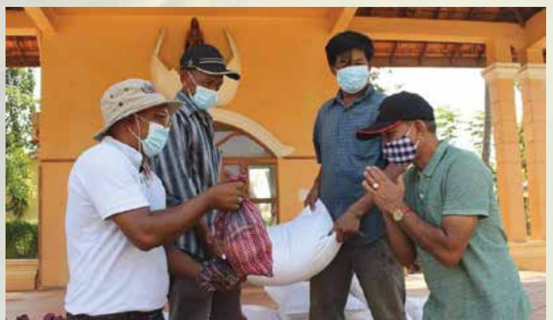
ព្រះសហគមន៍កាតូលិកចែកអង្ករនៅបាត់ដំបងក្រុង

ព្រះសហគមន៍សន្តយ៉ូសែបតាហែន ប្រគេនទេយ្យទាននិងគ្រឿងឧបភោគដល់ព្រះសង្ឃ និងគ្រួសារក្រីក្រ។ អ្នកទទួលអំណោយក្នុងពេលនោះរួមមានមនុស្សចាស់ៗមកពីគ្រួសារ ក្រីក្រនិងបុគ្គលិកក្រីក្ររបស់ព្រះសហគមន៍ក្នុងភូមិតាហែនសរុបចំនួន៥០គ្រួសារ ដែល ក្នុងមួយគ្រួសារទទួលបានអង្ករចំនួន៥០គីឡូក្រាម ទឹកត្រី១ដប ទឹកស៊ីអ៊ីវ១ដប ត្រីខ ៥កំប៉ុង ស្ករស១គីឡូក្រាម អំបិល២ថង់ និងសាប៊ូដុសខ្លួន២ដុំ។