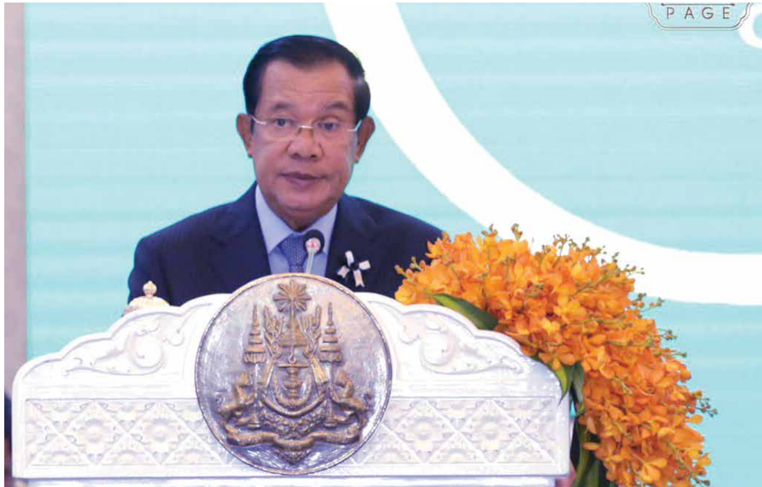
សម្តេចតេជោ ហ៊ុន សែន អញ្ជើញប្រកាសអនុវត្តកម្មវិធី ផ្តល់សាច់ប្រាក់ជូនពលរដ្ឋក្រីក្រនិងងាយរងគ្រោះដោយសារជំងឺកូវីដ១៩ កាលពីថ្ងៃទី២៤ ខែមិថុនា ឆ្នាំ២០២០កន្លងទៅ។

ត្រូវចៀសវាងជាប់ខាត នូវការឃុំឃិតគ្នាដាក់ បញ្ចូលសាច់ប្រាក់ប្រាក់ ប្រាក់កូនក្នុងខ្លួនឯងដែល មិនមែនជាគ្រួសារក្រីក្រ និងងាយរងគ្រោះពិត ប្រាកដដើម្បីទទួលបាន នូវប្រាក់ឧបត្ថម្ភនេះ