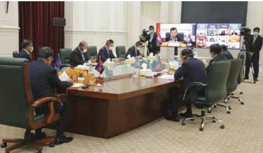
កិច្ចប្រជុំកំពូលអាស៊ានតាមប្រព័ន្ធដើម្បីជំរុញដើម្បីជំរុញវិស័យទូទៅ ឆ្នាំ២០២០កន្លងទៅ។