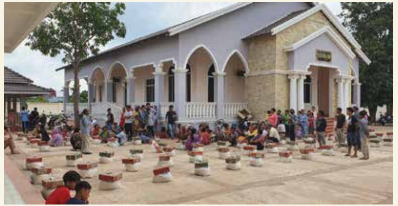
ព្រះសហគមន៍ចំប៉ាផ្តល់អង្ករជូនគ្រួសារក្រីក្ររងគ្រោះដោយសារ មេរោគកូវីដ ១៩ នៅភូមិពោធិ៍ធំ