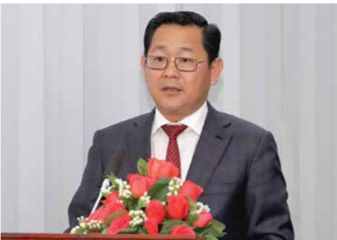
លោក កើត វិទូ រដ្ឋមន្ត្រីក្រសួងយុត្តិធម៌។

ផ្សេងទៀតក្រៅពីការឃុំឃាំងដូចជា ការដោះលែងឱ្យនៅក្រៅឃុំនិងការព្យួរទោសជាដើម បន្ថែមពីលើការដោះលែងមុនពេលកំណត់ និងដោយមានលក្ខខណ្ឌសម្រាប់អ្នកជាប់ឃុំបច្ចុប្បន្ននេះ។ ជាមួយគ្នានេះដែរ សម្តេចក្រឡាហោម ស ខេង រដ្ឋមន្ត្រីក្រសួងមហាផ្ទៃក៏បានប្រកាសដាច់ដោយឡែកពីគ្នាផងដែរកាលពីខែឧសភាកន្លងមកដោយបានសន្យាថា អ្នកជាប់ឃុំរហូតដល់១០០០នាក់ នឹងត្រូវដោះលែងនៅខែខែកក្កដាដោយលើកឡើងពីហានិភ័យនៃការឆ្លងវីរុសកូវីដ១៩និងការព្រួយបារម្ភពីបញ្ហាសិទ្ធិមនុស្សនៅក្នុងពន្ធនាគារប្រទេសកម្ពុជា។ ប្រភពដែលបានបន្តទៀតថា ទោះបីជាមានការប្រកាសក្នុងខែកក្កដានេះថា