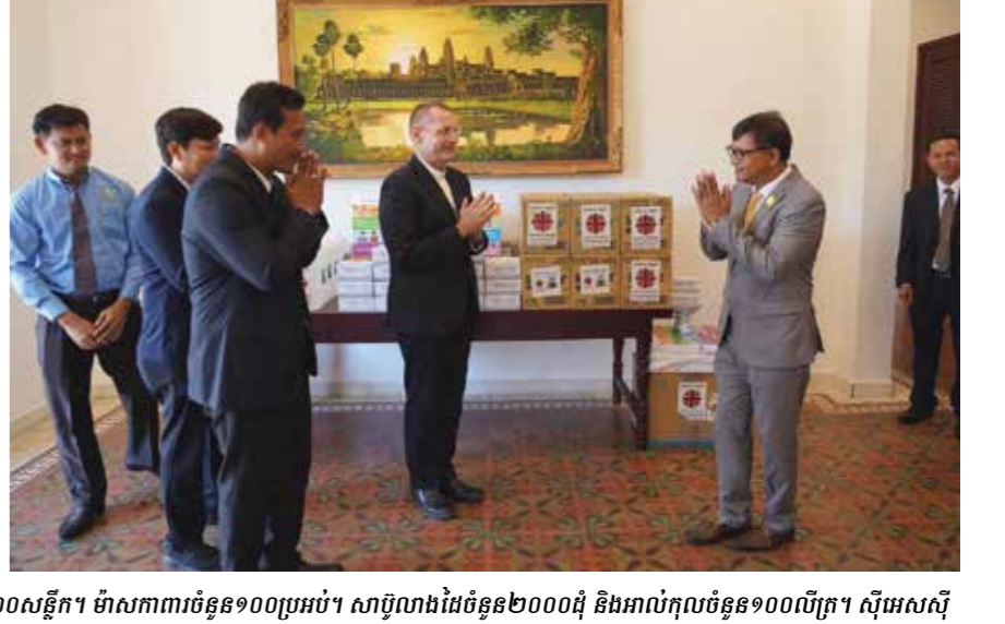
គណៈប្រតិភូបានប្រគល់ជូនក្រសួងអប់រំនូវសំភារៈពិអង្គការការីតាសកម្ពុជា មានផ្លាស់ផ្សូផ្សាយពីជំងឺកូវីដ១៩ចំនួន១០០០សន្លឹក។ ម៉ាសកាតាចំនួន១០០ប្រអប់។ សាបូណាងដែមចំនួន២០០០ដុំ និងអាវកុលចំនួន១០០លើត្រ។ ស៊ីអេសស៊ី