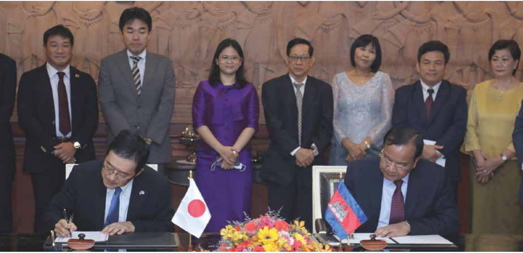
លោក ប្រាក់ សុខុន (ស្តាំ) ឧបនាយករដ្ឋមន្ត្រី រដ្ឋមន្ត្រីក្រសួងការបរទេស និងសហប្រតិបត្តិការអន្តរជាតិ និងលោក មិកាម៉ិ ម៉ាសាហ៊ីរ៉ូ (ឆ្វេង) អគ្គនាយកដ្ឋានប៉ូនក្នុងពិធីចុះហត្ថលេខា។