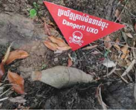
គ្រាប់មីនមិនទាន់ផ្ទុះដែលត្រូវបានរកឃើញ និងត្រៀមដោះយកទៅកែចេញដោយ អាជ្ញាធរមីនកម្ពុជា។