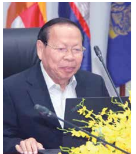
លោក ឆាយ ច័ន ទេសរដ្ឋមន្ត្រីនិងរដ្ឋមន្ត្រីក្រសួង ផែនការ។

សម្តេចបានបញ្ជាក់បន្ថែមថា លោកនឹងចាត់ វិធានការណ៍ក្តៅហើយនឹងមិនមានការលើកលែង ឡើយ ប្រសិនបើប្រើប្រាស់ទៅក្នុងអំឡុងពេល/សង្កាត់ មួយណាមានករណីមិនប្រក្រតីនេះកើតមានឡើង។ តើបងប្អូនប្រជាពលរដ្ឋខ្មែរដែលមានជីវភាពក្រីក្រ និងងាយរងគ្រោះដោយសារជំងឺកូវីដ១៩មិនបាន ទទួលបានវិកាឧបត្ថម្ភដូចម្តេចដែរ? កម្មវិធីផ្តល់សាច់ប្រាក់ជូនប្រជាពលរដ្ឋដែលមាន ជីវភាពក្រីក្រនិងងាយរងគ្រោះដោយសារផលប៉ះពាល់ នៃជំងឺកូវីដ១៩ មាននៅប្រចាំតំបន់គឺទាំង តំបន់ទីប្រជុំជន ក្នុងរាជធានីភ្នំពេញ សម្រាប់បណ្តា [ក្រ-១] ដែលក្នុង