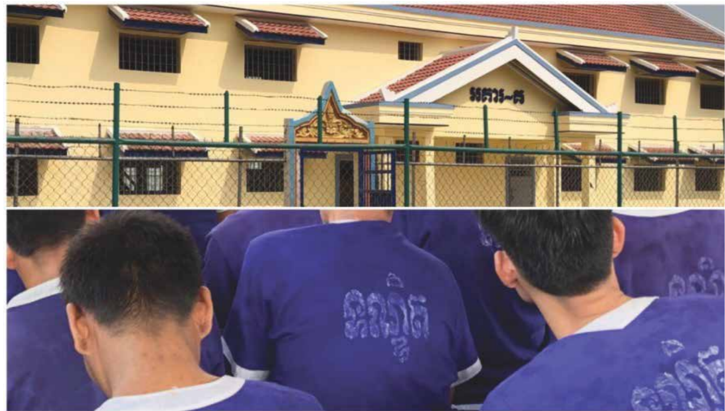
អង្គការលើកលែងទោសអន្តរជាតិ (Amnesty International) និងអង្គការសម្ព័ន្ធខ្មែរជំនឿនិងការពារសិទ្ធិមនុស្សលីកាដូ (LICADHO) បានចេញសេចក្តីថ្លែងការណ៍ស្នើរដ្ឋាភិបាល គោរពសន្យាដល់ការដោះលែងអ្នកទោសដែលមានអាទិភាពដោយកត្តាប្រឈមនឹងហានិភ័យខ្លាំងផ្សេងៗ។