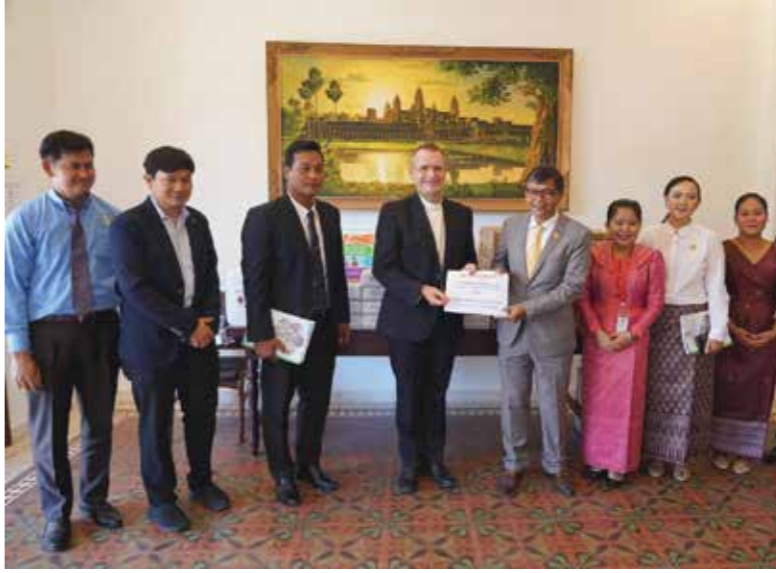
លោកអភិបាលក្រសួងអប់រំ យុវជន និងកីឡា ឌីតហស្តេរ ទុកចាត់ចែងក្នុងសកម្មភាពប្រយុទ្ធនឹងជំងឺឆ្លង មេរោគកូវីដ១៩។ ស៊ីអេសស៊ី

ក្រោយពីបានស្តាប់របាយការណ៍សង្ខេបរបស់ លោកអូលីវៀរ ឌីតហស្តេរ និងការប្រយុទ្ធនឹង កូវីដ១៩ លោករដ្ឋមន្ត្រី ហង់ដួន ណារ៉ុន បានអនុលោម លោកអភិបាលដែលបានមានប្រសាសន៍យ៉ាងច្បាស់ ក្លាយជាកិច្ចការរបស់លោកអភិបាល គឺដូចជាសហការអប់រំសិក្សាទាំងអស់ចំពោះកិច្ចការ ប្រើប្រាស់បណ្តាញទូរស័ព្ទ លោកបានកោតសរសើរលោកអភិបាល ក៏ដូចជាសហការអប់រំសិក្សាទាំងអស់ចំពោះកិច្ចការ ប្រើប្រាស់បណ្តាញទូរស័ព្ទ និង E-Learning ឬការ បម្រើនីតិវិធីតាមផ្ទះ។ ចំពោះកិច្ចការដែលលោកអភិបាល លើកឡើង លោករដ្ឋមន្ត្រីក៏យល់ស្រប។