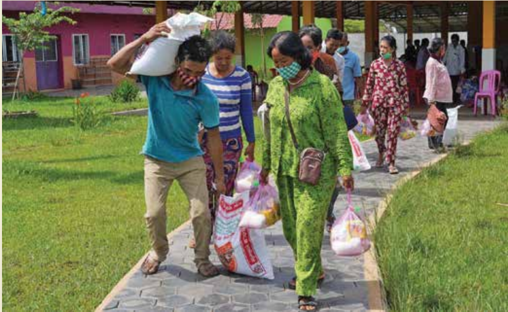
ព្រះសហគមន៍តាហែនចែកអង្ករនិងគ្រឿងឧបភោគជូនគ្រួសារក្រីក្រ