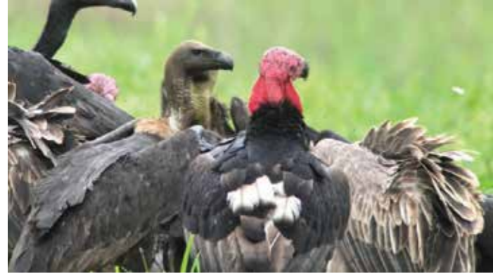
ជំរុំសត្វត្នាតនៅប្រទេសកម្ពុជាធ្វើឡើងដោយការប្រមូលទិន្នន័យពី៤ទីតាំងផ្សេងគ្នានៅក្នុងភូមិភាគឥសានៃប្រទេសកម្ពុជា។