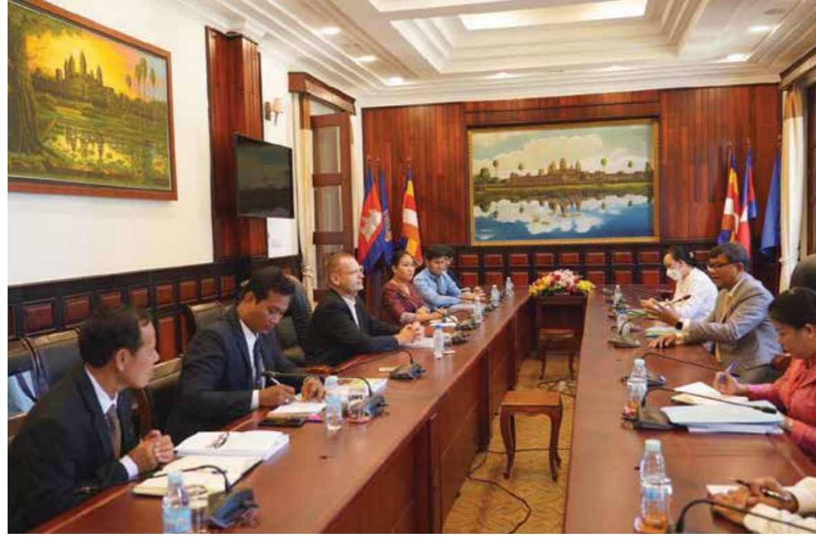
លោក អូលីវៀរ ឌីតហស្តេរ អភិបាលព្រះសហគមន៍ភូមិភាគភ្នំពេញ និងជាប្រធានអង្គការសំណើចុះទៅកាតូលិកភូមិភាគភ្នំពេញ បានចូលជួបសំណើសំណាលជាមួយបណ្ឌិតសភាចារ្យ ហង់ដួន ណារ៉ុន រដ្ឋមន្ត្រីក្រសួងអប់រំ យុវជន និងកីឡា។ ស៊ីអេសស៊ី