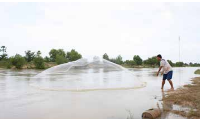
ទ្រូងដំបូងនៃការដាំដុះដំណឹងនេះ ដើម្បី ចូលរួមចំណែកចែករំលែកនិងការពារធនធាន ជលផលឱ្យបានគងវង្ស សម្រាប់ប្រជា ពលរដ្ឋខ្មែរជំនាន់ក្រោយទៀត។