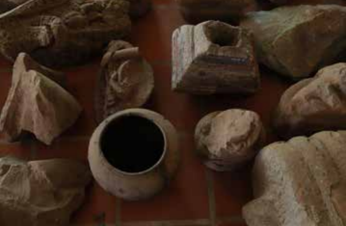
បំណែកវត្តសិល្បៈ ទាំង៧១១បំណែក។