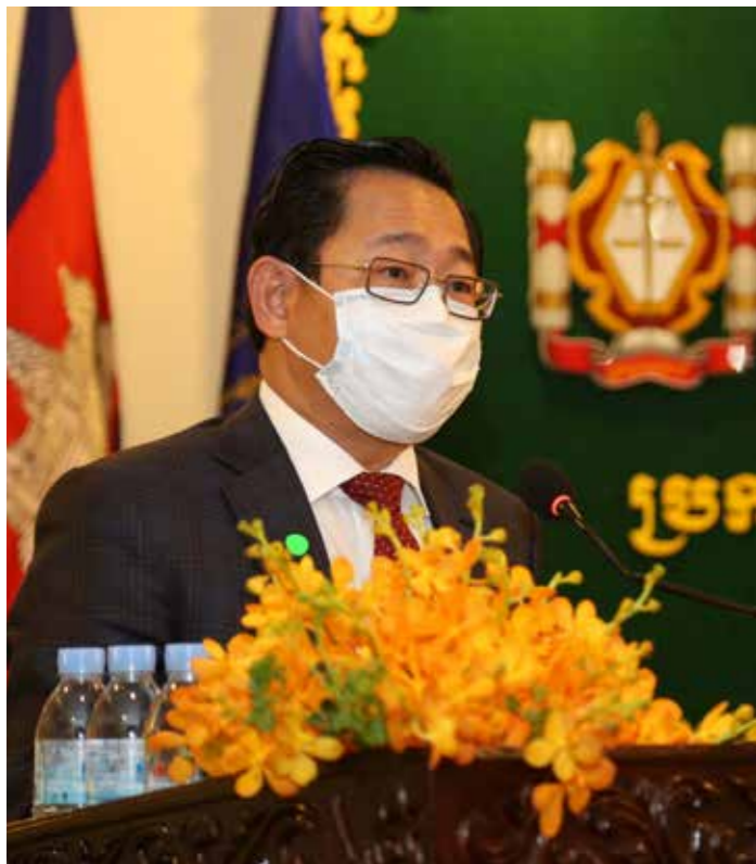
លោក កើត រិទ្ធ រដ្ឋមន្ត្រីក្រសួងយុត្តិធម៌ ថ្លែងនៅក្នុងសន្និសីទសារព័ត៌មាននៅទីស្តីការ ក្រសួងយុត្តិធម៌។