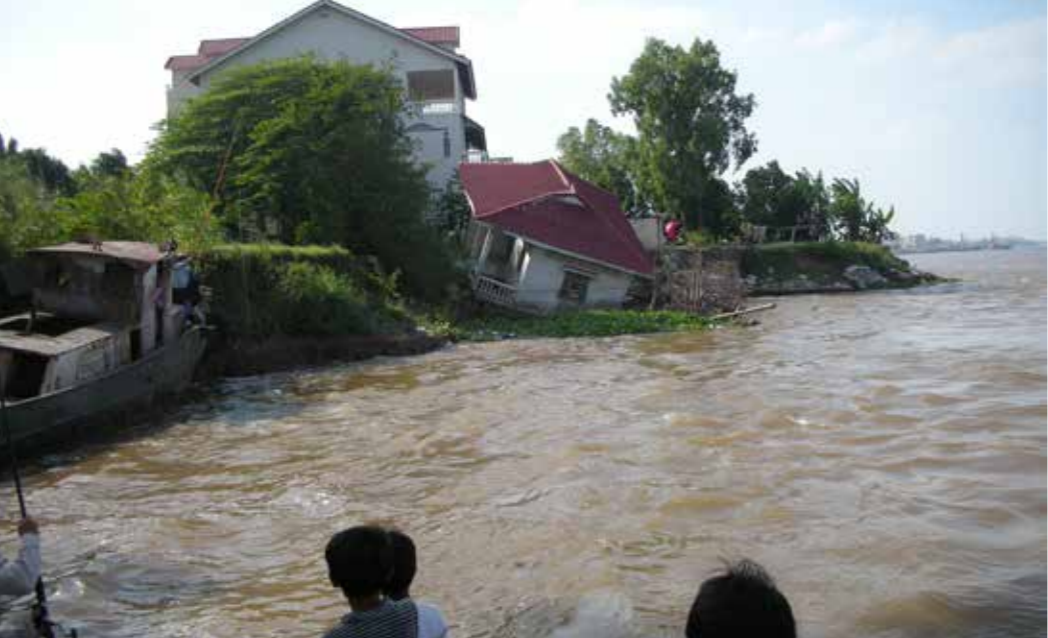
រដ្ឋៈដែលរងការខូចខាតដោយការបាក់ស្រុតច្រាំងទន្លេនាវ្យវិទ្ធិកំដន់នាឆ្នាំកន្លងមក។

គណៈកម្មាធិការជាតិគ្រប់គ្រងគ្រោះមហន្តរាយ បានដាក់ចេញនូវផែនការសកម្មភាពមួយចំនួន ដើម្បីត្រៀមឆ្លើយតប និងជួយសង្គ្រោះដល់ប្រជាពលរដ្ឋក្នុងរដ្ឋវិទ្ធិកំដន់នៃឆ្នាំនេះ ខណៈការព្យាករណ៍កម្ពស់ទឹកជាបឋម បានបង្ហាញថា ឆ្នាំនេះកម្ពស់ទឹកអាចខ្ពស់ជាងឆ្នាំមុន។ កាលពីរសៀលថ្ងៃអង្គារ លោកទេសរដ្ឋមន្ត្រី គន់ គឹម អនុប្រធានទី១ គណៈកម្មការពិការជាតិគ្រប់គ្រងគ្រោះមហន្តរាយ បានដឹកនាំកិច្ចប្រជុំប្រគល់ភារកិច្ច និងអនុវត្តផែនការសកម្មភាពរៀបចំធ្វើយកបញ្ជីរដ្ឋវិទ្ធិកំដន់ ជាមួយមន្ត្រីអគ្គលេខាធិការដ្ឋាន និងនាយកដ្ឋានពាក់ព័ន្ធ។