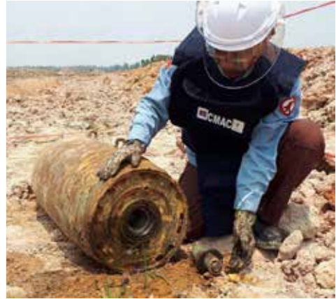
បុគ្គលិករបស់អាជ្ញាធរសំអាតគ្រាប់មិនទាន់ផុះ ក្នុងរយៈពេល៤ខែឆ្នាំនេះ ក្នុងរយៈពេល៤ខែឆ្នាំនេះ ក្នុងរយៈពេល៤ខែឆ្នាំនេះ ក្នុងរយៈពេល៤ខែឆ្នាំនេះ

បន្ថែមថា ទន្លេនិងនេសាទនៃលទ្ធផលការងារ របស់យើងដឹងពីមិនបានចំនួន១.០៣០ លើក មានអ្នកចូលរួមសរុប៥៣៧.៨៤៥ នាក់ ហើយការស្រាវជ្រាវព័ត៌មានចំការ មិន/គ្រាប់និងការងារហ្វឹកហ្វឺនកំសំបេ បានលទ្ធផលគួរជាទីមោទនៈ។