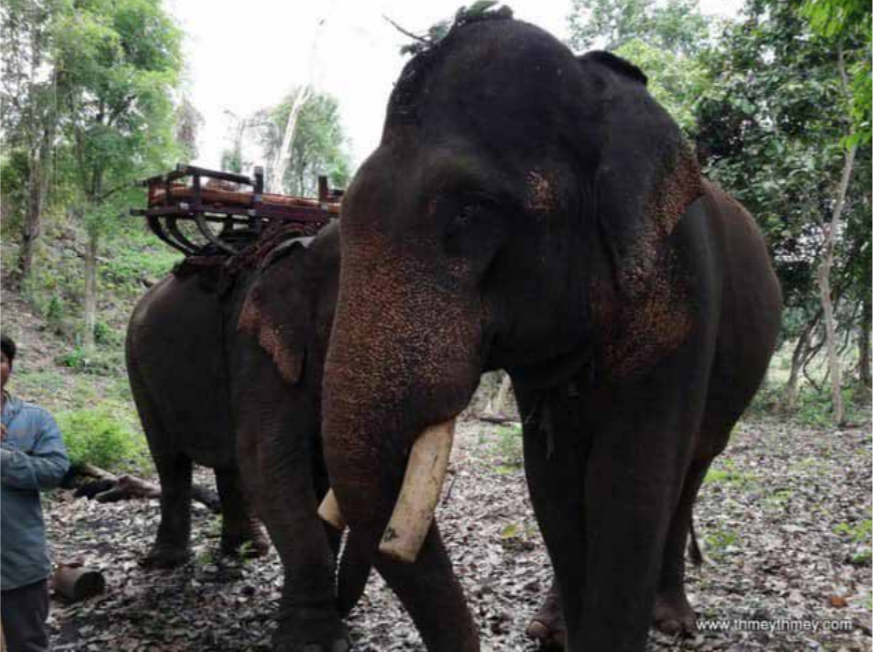
ប៉ាក់ម៉ែ ជាដំរីឈ្មោលដែលស្ថិតក្នុងការគាំពារថែរក្សា ប៉ុន្តែបានស្លាប់កាលពីខែឧសភា។

ផ្តល់ការគាំទ្របច្ចេកទេសបរិស្ថានពេទ្យសង្គ្រោះដំរីនេះឱ្យបានទាន់ពេលវេលា តែជាអកុសល ទោះបីជាមានការខិតខំប្រឹងប្រែងយកចិត្តទុកដាក់ យ៉ាងហ្មត់ចត់ពីក្រុមជំនាញនិងបណ្តុំពេទ្យមកពីគ្លីនិក AgroVet រួមទាំងក្រុមការងារយ៉ាងណា ក៏ដំរីឈ្មោះប៉ាក់ម៉ែពុំអាចស្ងៀមនិងអាការៈជំងឺរបស់ខ្លួនតទៅទៀតបានឡើយ នៅយប់ថ្ងៃដដែល។ ក្នុងខណៈនេះសមាគម បាននឹងកំពុងបន្តសហការជាមួយស្ថាប័នរដ្ឋ អាជ្ញាធរមានសមត្ថកិច្ច និងក្រុមអ្នកជំនាញពាក់ព័ន្ធដើម្បីពិនិត្យនិងធ្វើតេស្តល្បិច្ច័យរកមូលហេតុពីត្រាកដអំពីអាការៈជំងឺនិងការស្លាប់របស់ដំរីនេះ។ សេចក្តីប្រកាសព័ត៌មានដដែលនេះបានបន្តថាការបាត់បង់ដំរីឈ្មោះប៉ាក់ម៉ែ គឺជាការបាត់បង់ធនធានសត្វដំរីដែលជាបេតិកភណ្ឌធម្មជាតិរបស់ជាតិមួយដែលសមាគមបានខិតខំការពារថែរក្សានិងអភិរក្សអស់ជាច្រើនឆ្នាំកន្លងមកដោយមានការគាំទ្រពីក្រសួងបរិស្ថានតាមរយៈកម្មវិធីការងារគាំពារបរិស្ថាននិងសង្គម និងបណ្តាស្ថប័នជាតិផ្សេងទៀតផងដែរ។