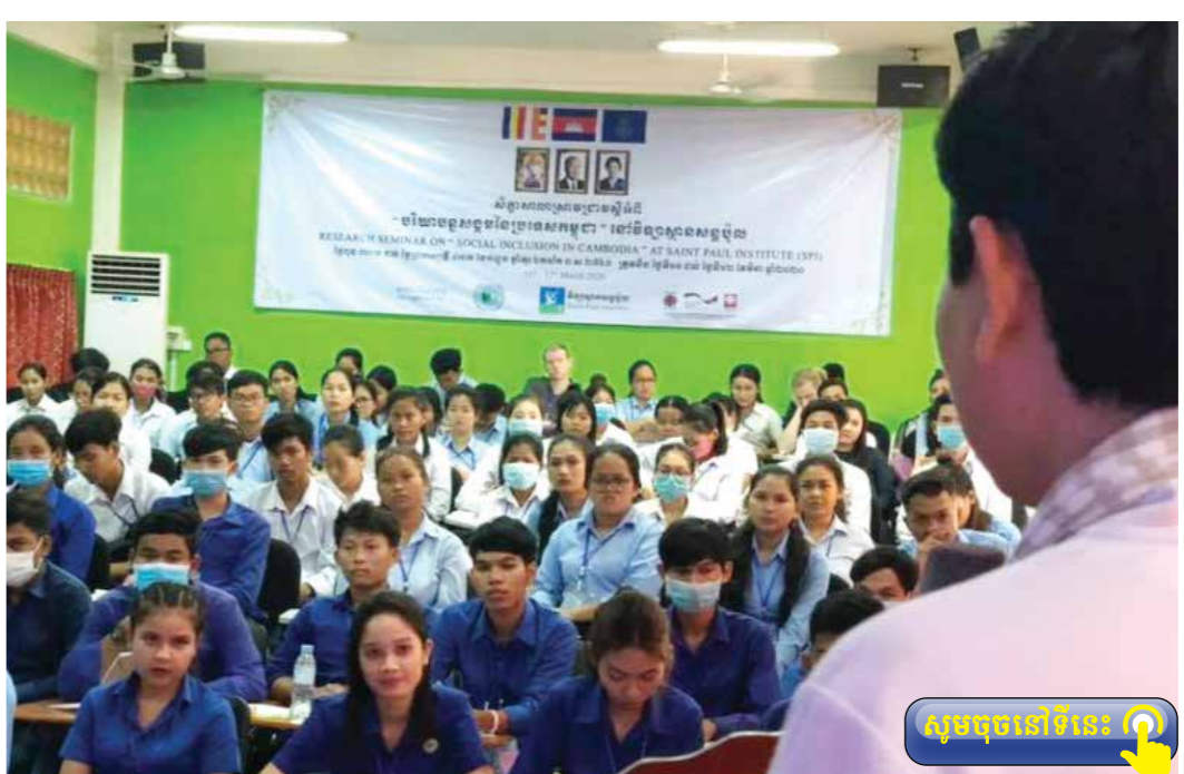
សូមចុចនៅទីនេះ

វិទ្យាស្ថានសន្តប៊ូលបានរៀបចំ សិក្ខាសាលាស្រាវជ្រាវ ស្តីអំពី “បរិយាបន្នសង្គមនៃប្រទេសកម្ពុជា” ដើម្បីបញ្ឈប់ដល់និស្សិតមកពីស្ថាប័ន ចំនួន៣ដែលមានចំនួនប្រមាណជា ១៥០ នាក់ ឱ្យយល់ដឹងពីបរិយាបន្ន សង្គមដោយគ្មានការរើសអើង។ សិក្ខាសាលានេះរៀបចំឡើងដោយ មានការសហការជាមួយនិងអង្គការ ការិយាល័យសកម្មភាព និងក្រសួងសង្គម កិច្ច អតីតយុទ្ធជន និងយុវនីតិសម្បទា ដែលប្រព្រឹត្តទៅនៅថ្ងៃទី១១ និង ១២ មីនា ២០២០ នៅវិទ្យាស្ថានសន្តប៊ូល ក្នុងស្រុកត្រាំកក់ខេត្តតាកែវ។