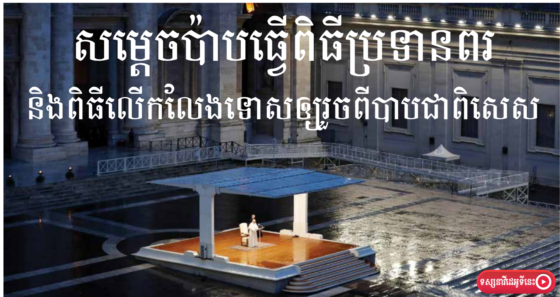
សម្តេចប៉ាប ហ្វ្រង់ស៊ីស្កូ បានធ្វើពិធីអធិដ្ឋាន ប្រទានពិសេសពិធីក្រុងរ៉ូម។ romae urbis

ដោយ ៖ វីរ កញ្ញា សម្តេចប៉ាប ហ្វ្រង់ស៊ីស្កូ បានធ្វើពិធីអធិដ្ឋាន ប្រទានពិសេស និងពិធីលើកលែងទោសឱ្យ រួចពីបាបដល់អ្នកដែលនឹងចូលរួមមើល ស្តាប់ ការប្រទានពរ «urbi et orbi» ដែលមាន ន័យថា សម្រាប់ទីក្រុងរ៉ូមទៅកាន់ពិភពលោក ទាំងមូល។ ពិធីនេះ ធ្វើនៅថ្ងៃទី២៧ ខែមីនា នៅម៉ោង៦ល្ងាច កន្លងទៅ ម៉ោងនៅទីក្រុង រ៉ូម គឺម៉ោងប្រមាណ១២ យប់ថ្ងៃដែលនៅ ក្នុងប្រទេសកម្ពុជា។