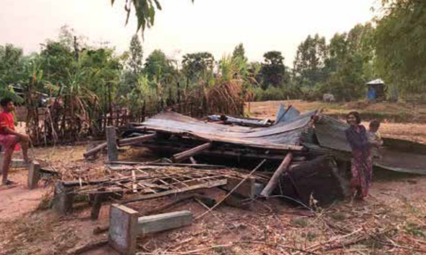
ខ្យល់កម្រាស់មកលើ ០៣ឃុំ (សរសស្អូ, ល្វា, ត្រីញ៉ា) ស្រុកពូក ខេត្តសៀមរាប ធ្វើឱ្យប៉ះពាល់ផ្ទះប្រជាពលរដ្ឋរយ៉ាង ដំបូលចំនួន ៣១ខ្នង និងរលំចំនួន ០២ខ្នង។

តិទទួលបានទឹកឱ្យបានច្រើន យ៉ាងហោចណាស់ ៦កែវក្នុងមួយថ្ងៃ ប្រសិនបើមានកូនចង្កូងអាចកិចជាង នេះ និងស្រ្តីដែលមានផ្ទៃពោះត្រូវទទួលបានទឹក ឱ្យបានញឹកញាប់បំផុតតាមដែលអាចធ្វើទៅបាន។