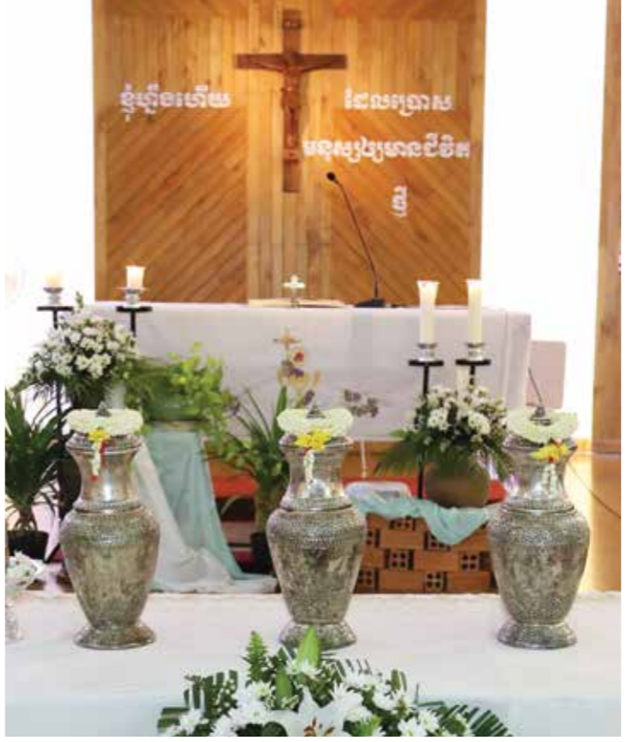
ព្រេងដែលបានប្រសិទ្ធពរមានបីប្រភេទ គឺព្រេងសម្រាប់អ្នកជំងឺ ព្រេងសម្រាប់បងប្អូនទទួលការអប់រំជំនឿ និងយើងមានព្រេងពិសិដ្ឋ ដែលជាព្រេងគ្រីស្ទ។

ជំងឺដល់សហវា។ លោកនឹងអធិដ្ឋានសម្រាប់លោកបូជាចារ្យទាំងអស់ ក្នុងអាទិត្យនៃសញ្ញាពិសិដ្ឋ ហើយលោកក៏សូមលើកទឹកចិត្តដល់អស់លោកបូជាចារ្យ ឱ្យណែនាំពិធីបុណ្យត្រៃទិវាមុនបុណ្យចម្លងដោយយកចិត្តទុកដាក់ទោះបីជាលោកបូជាចារ្យត្រូវពិធីនេះតែម្នាក់ឯង ឬមានគ្រីស្ទបរិស័ទ២-៣នាក់ក្តី។ លោកអភិបាល៖ «ប្រហែលយើងនៅម្នាក់ឯង ជាខ្លួនរបស់យើង ជាប្រុសកាយរបស់យើង ប៉ុន្តែយើងដឹងថាព្រះជាម្ចាស់ គង់នៅជាមួយយើង និងជាពិសេសប្រជារាស្ត្ររបស់យើង គ្រីស្ទបរិស័ទរស់នៅជាមួយយើង និងជាមួយយើងដែរ។ ដូច្នេះយើងអាចនិយាយថា អាទិត្យពិសិដ្ឋនេះ យើងចូលរួមនៅក្នុងសក្តារបូជាមួយគ្នាក្នុងផ្លូវវិញ្ញាណ ជាផ្នែកតែរបស់ព្រះយេស៊ូផ្ទាល់ខ្លួនដើម្បីឱ្យជីវិត