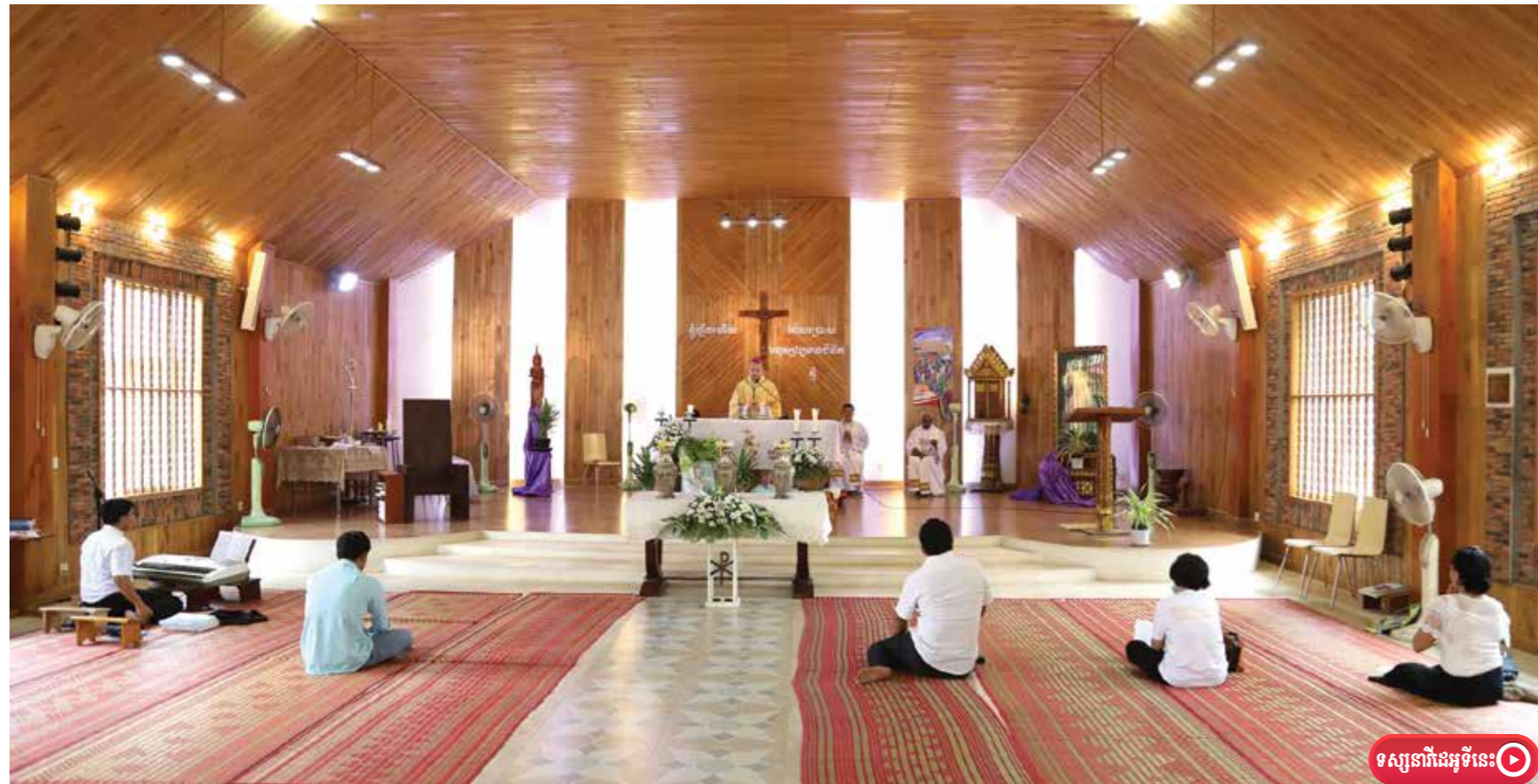
ពិធីប្រសិទ្ធពរលើប្រេងក្នុងភាពស្ងៀមស្ងាត់ ដោយមានការចូលរួមពីគ្រីស្ទបរិស័ទតែពីរបីនាក់តែប៉ុណ្ណោះ ដើម្បីចូលរួមទប់ស្កាត់នឹងការរីករាលដាលជំងឺវីរុស កូវីដ១៩។