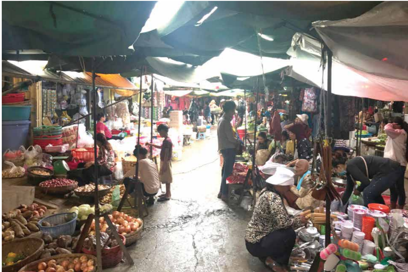
សកម្មភាពអាជីវករក្នុងផ្សារមួយក្នុងរាជធានីភ្នំពេញ។

បណ្តោះអាសន្នដល់ជនបរទេសទាំងអស់ចូលរៀនការងារយោងដោយលើការកើនឡើងយ៉ាងខ្លាំងនៃតម្លៃទំនិញ និងអាស៊ាន។ បំរាមទាំងនេះ មិនមានទទួលបានការលើកលែងទិដ្ឋាការ (ជនជាតិវៀតណាម និងក្រសួងអ្នកជំនាញការ និងអ្នកជំនួញ) ត្រូវបង្ហាញវិញ្ញាបនបត្របញ្ជាក់ពីសុខភាពថា គ្មានជំងឺកូវីដ១៩ ចេញដោយអាជ្ញាធរមូលដ្ឋាននៃប្រទេសដែល