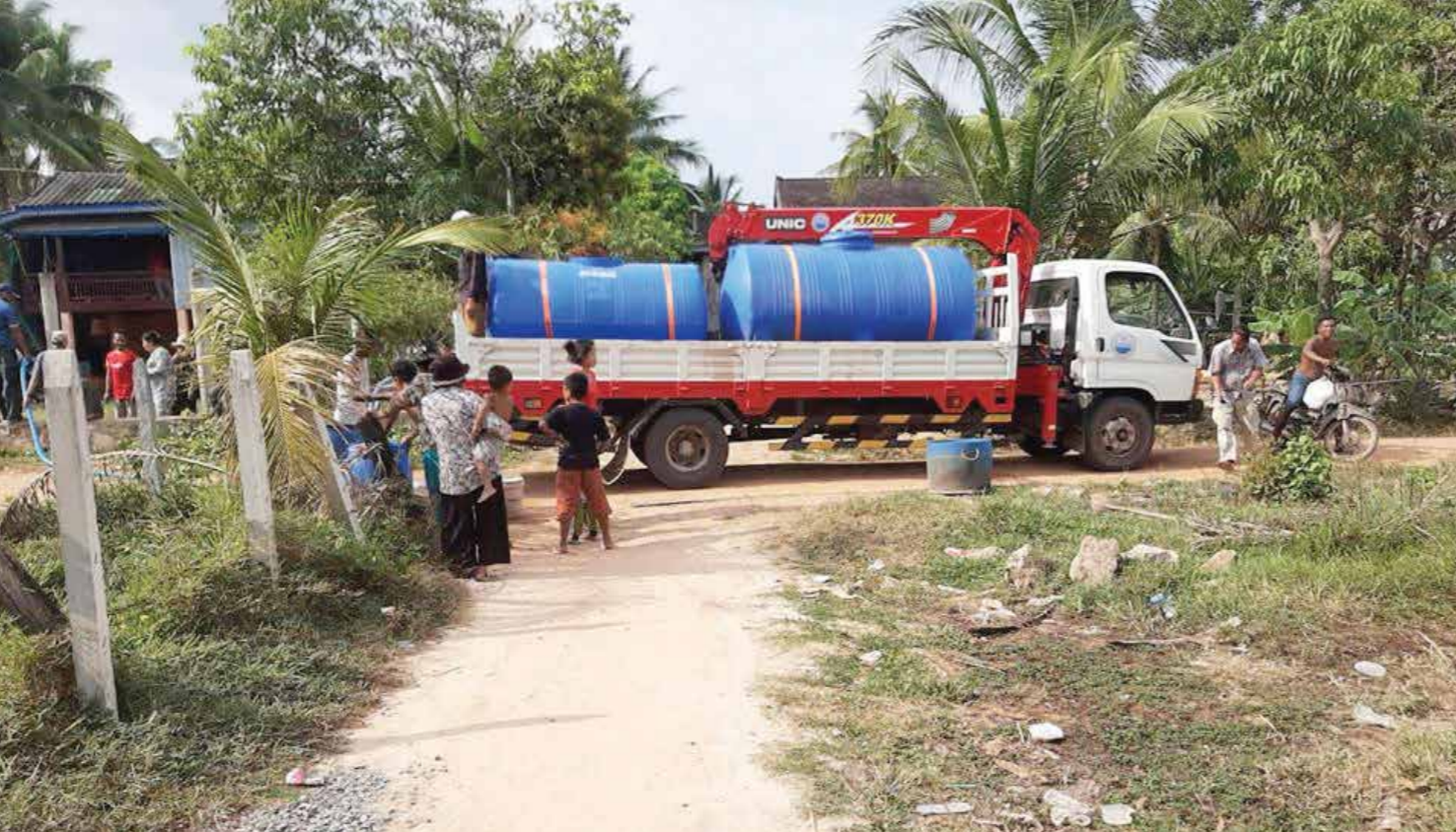
ក្រុមការងារមន្ទីរធនធានទឹក និងឧតុនិយមខេត្តព្រះសីហនុ បានដឹកទឹកចែកជូនប្រជាពលរដ្ឋ នៅក្នុងឃុំវាលល្វា។