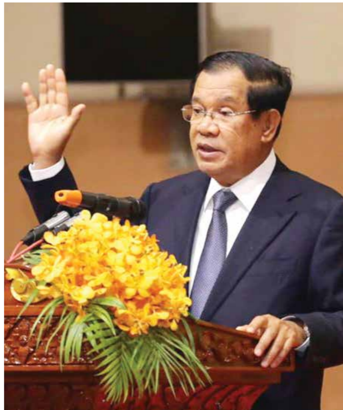
សម្តេចតេជោ ហ៊ុន សែន នាយករដ្ឋមន្ត្រីកម្ពុជាថ្លែងកិច្ចសន្និដ្ឋានក្នុងសវនាការរដ្ឋប្រចាំឆ្នាំ ២០១៩ ថ្ងៃទី១៩ ខែមីនា ឆ្នាំ២០២០។