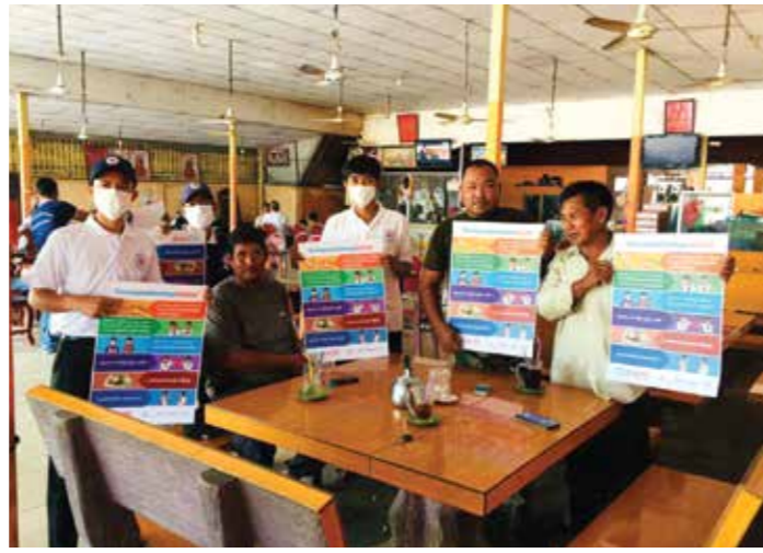
បុគ្គលិកសុខាភិបាលចុះតាំងបង្ហាញផ្លូវច្បាប់ការពារការរីករាលដាលនៃមេរោគ កូវីដ១៩ នៅតាមមូលដ្ឋាន។

លោកនាយករដ្ឋមន្ត្រីបានថ្លែង នៅក្នុងពិធីបិទសន្និដ្ឋានសវនាការ របស់ក្រសួងសុខាភិបាលនាដើម ខែមីនា ឆ្នាំ២០២០ថា រាជរដ្ឋាភិបាល បានដាក់ចេញនូវវិធានការសង្គ្រោះ សេដ្ឋកិច្ចនៅក្នុងដំណាក់កាលនៃវិវត្ត កូវីដ១៩ កាលពីថ្ងៃទី ២៤ ខែកុម្ភៈ រួចហើយ ដោយបានដាក់ចេញនូវ គោលនយោបាយមួយចំនួនទាក់ទង ជាមួយនឹងការគាំពារទៅលើវិស័យ ដែលមានផលប៉ះពាល់ដូចជាវិស័យ ទេសចរណ៍ និងក្នុងវិស័យកាត់ដេរ។ លោកក៏បានជំរុញ គណៈកម្មការគោល នយោបាយសេដ្ឋកិច្ច និងក្រសួង សេដ្ឋកិច្ចហិរញ្ញវត្ថុរៀបចំនូវផែនការ ដើម្បីឆ្លើយតបជាមួយបញ្ហាទាំងឡាយ ដែលទាក់ទងនឹងបញ្ហាសេដ្ឋកិច្ចនៅ ក្នុងបរិបទដែលកូវីដ១៩រីករាលដាល។ សម្តេចតេជោ ហ៊ុន សែន បាន មានប្រសាសន៍ថា៖ « រដ្ឋមន្ត្រីគ្រប់ ក្រសួងទាំងអស់ ប៉ុន្តែការ ចំណាយអ្វីទាំងអស់ ប៉ុន្តែការ កាត់បន្ថយទេ។ ការចំណាយចំនួន ១ ខែជាង ៤០០លានរៀលក៏មិនត្រូវ កាត់បន្ថយផងដែរ។ ការកាត់បន្ថយ ការចំណាយនេះ គឺដើម្បីទុកបម្រុង ថវិកាសម្រាប់វិស័យសុខាភិបាល ក្នុងការត្រៀមការទប់ទល់ជាមួយ និង