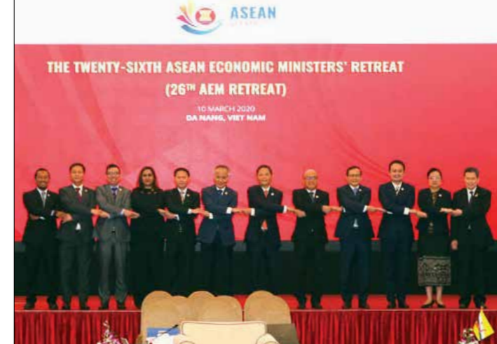
បណ្តារដ្ឋមន្ត្រីប្រទេសមេម៉ាកអាស៊ានចូលរួមក្នុងកិច្ចប្រជុំរដ្ឋមន្ត្រីសេដ្ឋកិច្ចអាស៊ានដែលបាន ធ្វើឡើងនៅទីក្រុងដាណាង ស្ថិតនៅភាគកណ្តាលប្រទេសវៀតណាម។

ផលប៉ះពាល់នៃសេដ្ឋកិច្ចជាសកលបណ្តាលមកពីជំងឺកូវីដ១៩ ប្រហែលជាត្រូវ បានមើលរំលងដោយអ្នកសេដ្ឋកិច្ចអាស៊ាន ដោយសារតែការផ្ទុះនៃមេរោគនេះ នៅបណ្តាប្រទេសនៅអឺរ៉ុប និងអាមេរិកលើសពីការរំពឹងគិតទុកជាមុន។