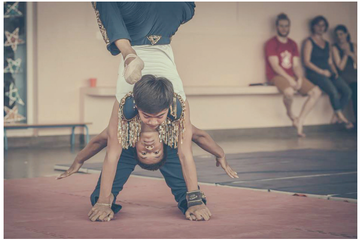
យុវជនសម្តែងជូនភ្ញៀវទស្សនា។

សាលាសៀកជាតិ ដែល ចំនុះឱ្យសាលាមធ្យមសិក្សា វិចិត្រសិល្បៈត្រូវបានបង្កើត ឡើងនៅក្នុងឆ្នាំ ១៩៨១។ សិស្សត្រូវសិក្សាហាត់រៀន នៅសាលានេះរយៈពេល៨ឆ្នាំ មុននឹងទទួលបានសាលាបត្រ សិល្បៈសៀកដែលទទួល ស្គាល់ដោយក្រសួង វប្បធម៌ និង វិចិត្រសិល្បៈ។