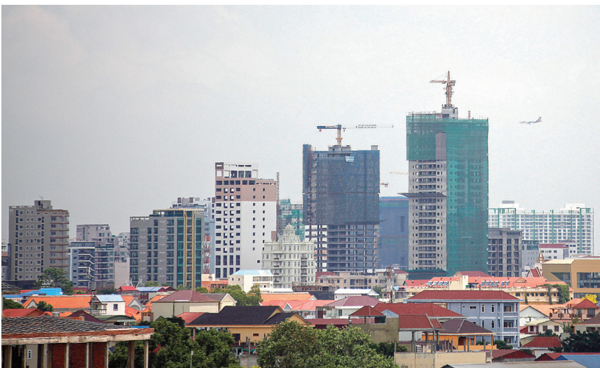
វិស័យសំណង់ និងអគារខ្ពស់ៗកំពុងសាងសង់។

ពេលនេះ គឺលោកបានធ្វើជាកម្មករសំណង់នៅខេត្ត ព្រះសីហនុរហូត ដោយសារតែទីនោះសំបូរការងារ ហើយគេឲ្យលុយពលកម្មករច្រើន តែពេលខ្លះ គឺគ្រោះថ្នាក់ដោយសារតែត្រូវធ្វើការនៅកន្លែងដែលខ្ពស់ៗ បើមិនមែនទេ គឺធ្វើការនៅក្រោមដីតែម្តង។