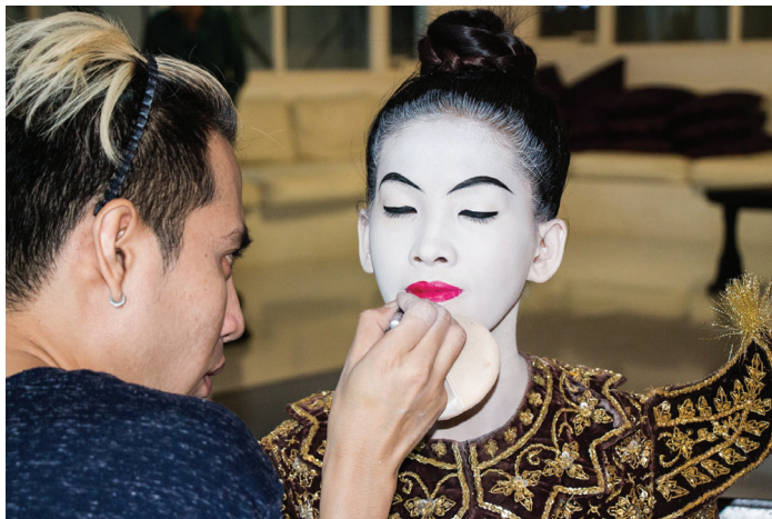
ការជាត់រុបតែងមុខក្នុងអង្គការសម្តែង។

ក្បាច់តូចៗជាច្រើនទៀត។ សម្តេចព្រះរាជបុត្រី ព្រះរាម នរោត្តម បុប្ផាទេវី មានព្រះសន្តិយ បន្តថា ក្បាច់មួយចំនួនត្រូវបាន បាត់បង់ទៅតាមពេលវេលា៖ «ជា សំណាងដែរ របាំព្រះរាជ្យទ្រព្យយើង ជាសំណាង មិនបាត់បង់សោះ បាត់ ក្បាច់ខ្លះពិតមែន។ ក្បាច់ទាំងអស់មាន ដល់ទៅជាង ២០០០ក្បាច់ឯណោះ តែ ឥលូវនេះយើងមានតែជាង ៤០០ទៅ ៥០០ទេ។ ទោះបីជាមានតែប៉ុណ្ណោះក៏ យើងត្រូវខំទៀត កុំឲ្យវាធ្លាក់ទៅទៀត»។ សម្តេចព្រះរាជបុត្រី ព្រះរាម នរោត្តម បុប្ផាទេវី មានព្រះសន្តិយ បន្តថា កូនសិស្សតូចៗដែលចូល មករៀននៅក្នុងសាលាវិចិត្រសិល្បៈ ដំបូងត្រូវរៀនហាត់ពត់ដៃជើង ហើយ ហាត់ក្បាច់បាតជាចាំបាច់ តែបើខ្លាំង ប្រសិនបើ អាស្រ័យទៅតាមជំនាញនីមួយៗ ក្បាច់នោះគឺវត្តមានបន្តិចៗទេ តែបើក្បាច់ បាតគឺនៅដដែលទេ។ សាស្ត្រាចារ្យ ផ្នែកវិចិត្រសិល្បៈ