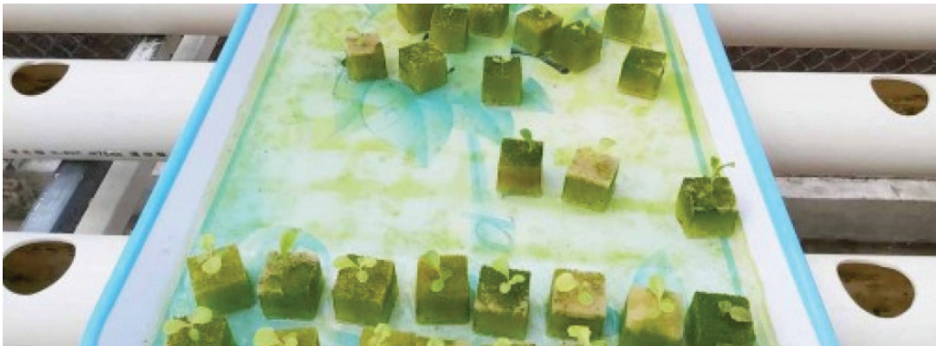
ផ្ទាល់បណ្តុះកូនដំណាំលើទឹក។