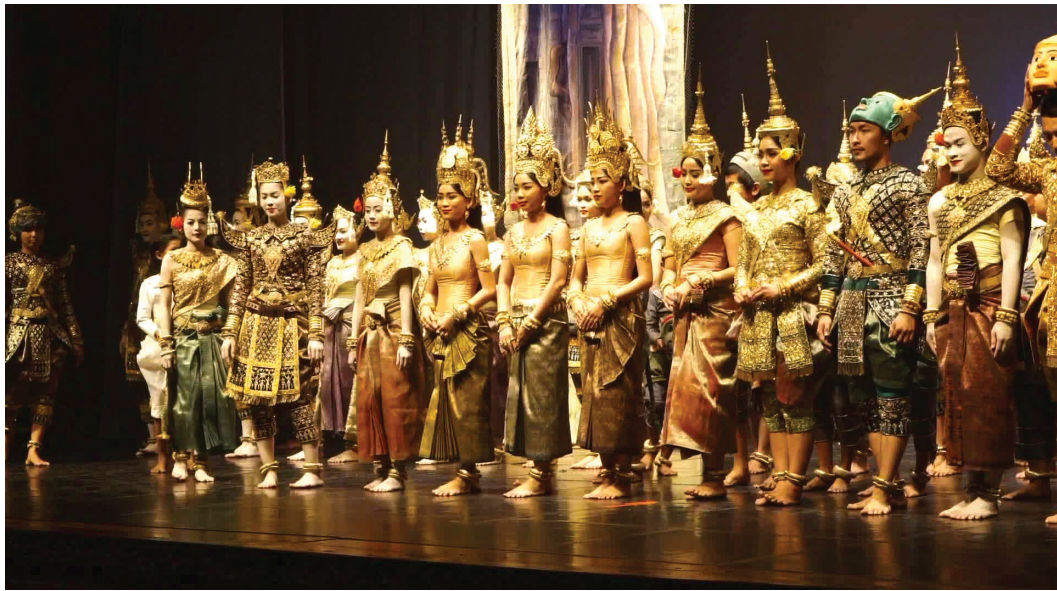
ក្រុមសម្តែងរបាំព្រះរាជ្យទ្រព្យ ដែលសម្តែងជូនទស្សនិកជនទស្សនា។