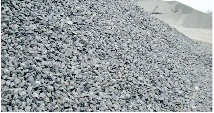
ខ្សាច់ និងថ្មត្រួសសំណង់កំពុងមានតម្រូវការខ្ពស់ ខណៈការអភិវឌ្ឍវិស័យសំណង់កំពុងមានកំណើនខ្ពស់។