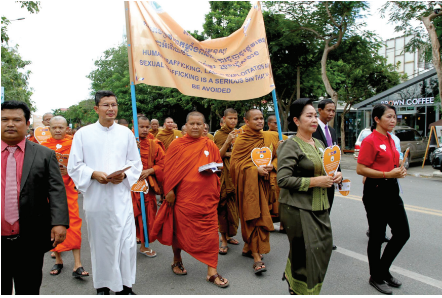
សាសនិកសាសនាធំៗទាំងបីនៅកម្ពុជា ដង្ហែសារដោយធ្វើរដើងប្រឆាំងការជួញដូរមនុស្ស។