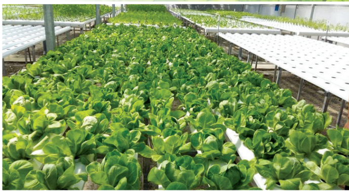
កត្តាសំខាន់បំផុតនោះ គឺត្រូវយល់ដឹងអំពីរបៀបរៀបចំដាំនិងការថែទាំលើប្រព័ន្ធគ្រប់គ្រងទឹក។