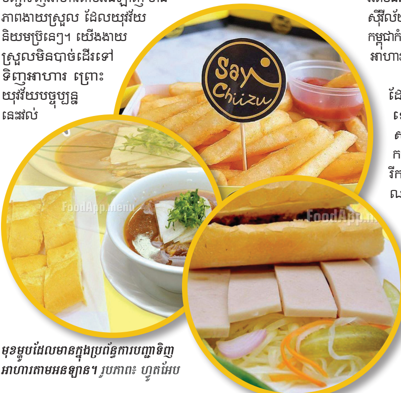
មុខម្ហូបដែលមានក្នុងប្រព័ន្ធការបញ្ជាទិញ អាហារតាមអនឡាញ។

ម្ហូបអាហារ និងភេសជ្ជៈត្រូវបាន រក្សាគុណភាព ជួនចំពោះអតិថិជន ជាមួយនឹងទូរស័ព្ទ។ ចំណែកតម្លៃ ដឹកជញ្ជូនវិញ គឺនៅក្នុងក្រុងភ្នំពេញ ១ ដុល្លារអាមេរិក និងនៅជាយក្រុង ២ ដុល្លារអាមេរិក។ រយៈពេលនៃការ ដឹកជញ្ជូនអាហារជូនចំពោះអតិថិជន គឺប្រើរយៈពេល ពី ៣០ ទៅ ៤៥ នាទី។ ក្នុងមួយថ្ងៃក្រុមហ៊ុន ខាងលើ