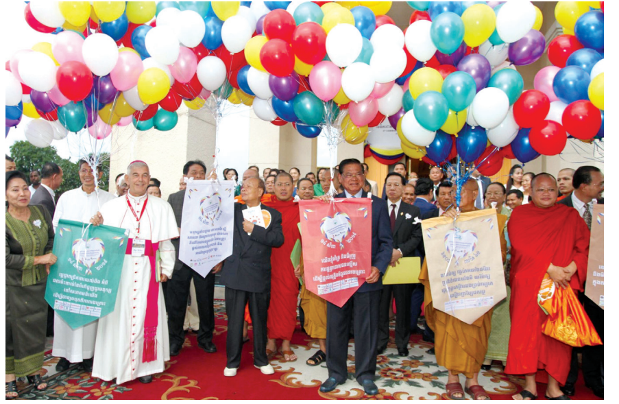
សម្តេច ស ខេង និងមេដឹកនាំសាសនាទាំងអស់បង្ហោះសាររួមគ្នា។