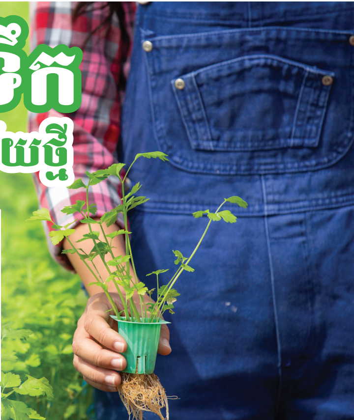
កសិករកំពុងចាប់អារម្មណ៍នឹងបច្ចេកវិទ្យាដាំដំណាំលើទឹក។

មានទីផ្សារខ្លាំងក្នុងរាជធានីភ្នំពេញ។ ដោយឡែកសម្រាប់អ្នករស់នៅជនបទស្រុកស្រែចម្ការនៅពុំទាន់មានការចាប់អារម្មណ៍នៅឡើយនោះទេតែបើដំណាំស្តែងដែលដាំធម្មតានៅលើដីទើបមានការចាប់អារម្មណ៍។