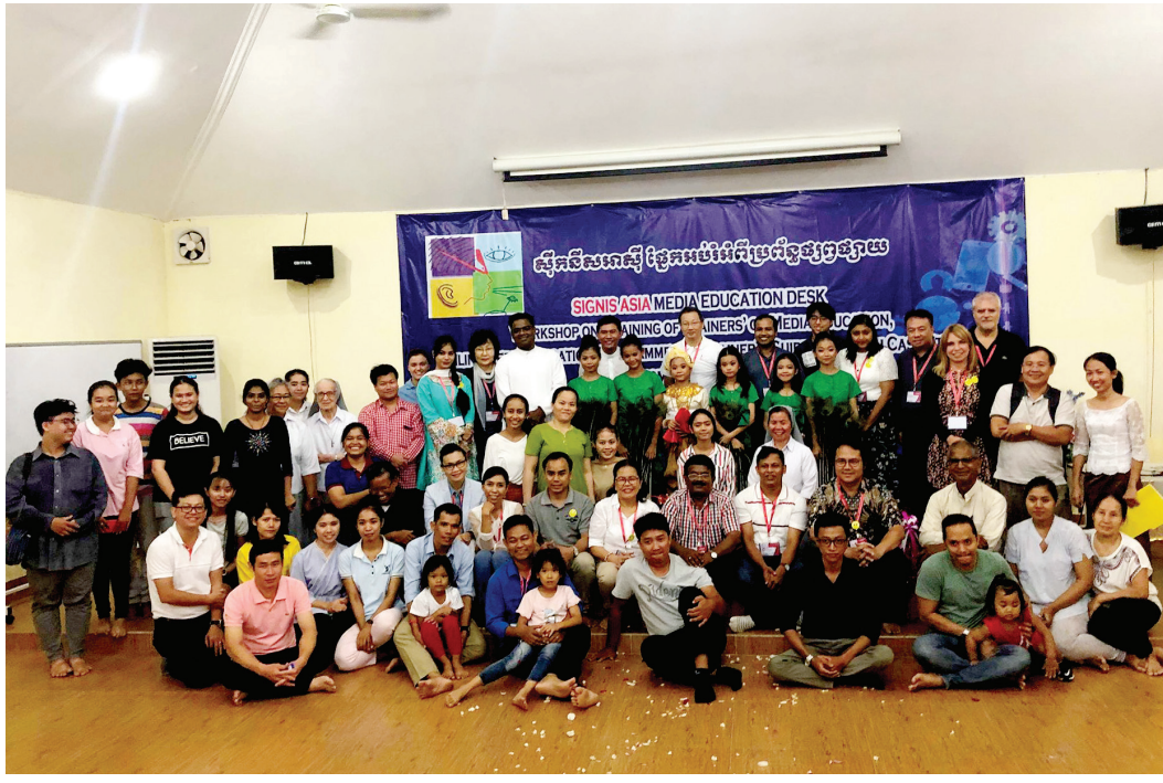
ផ្សព្វផ្សាយ។ ក្នុងនោះក៏បានបង្កើតក្រុម WhatsApp សម្រាប់សមាជិកទាំងផ្ទៃក្នុង និងខ្មែរយោបល់គ្នាទៅវិញទៅមក លើការ