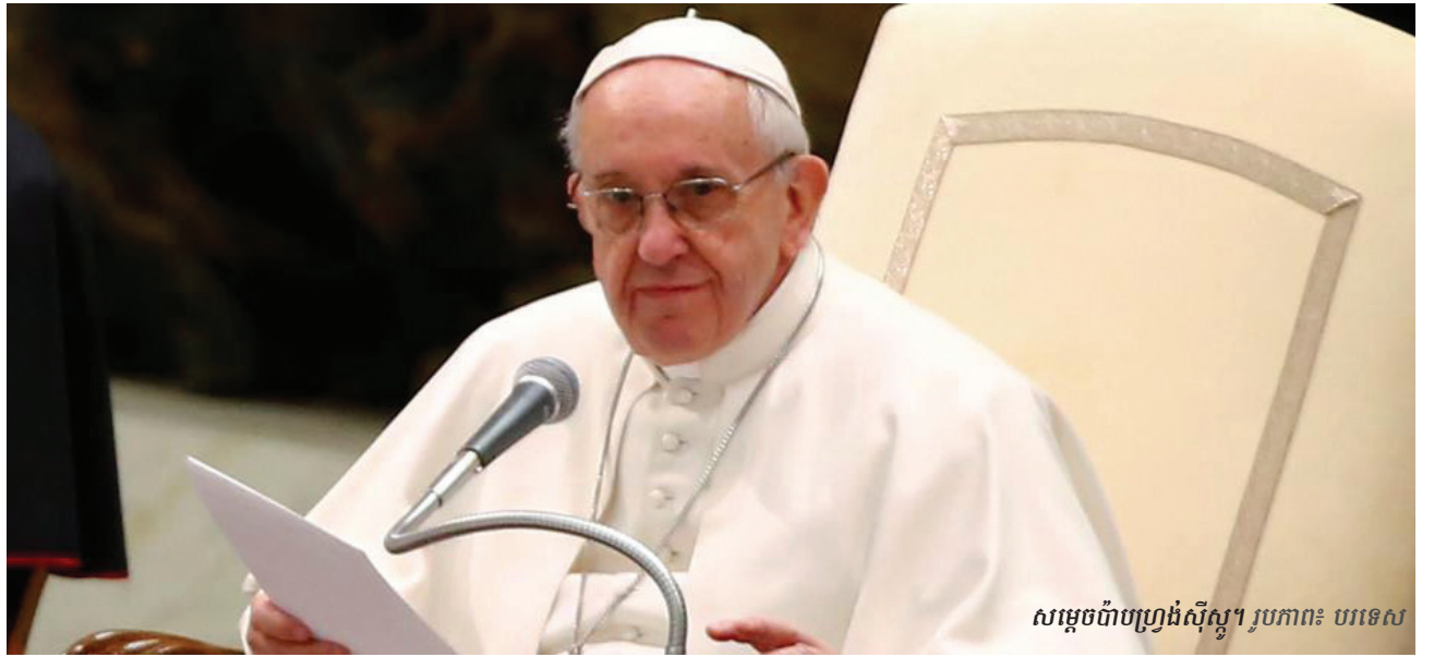
សម្តេចប៉ាបហ្វ្រង់ស៊ីស្កូ។