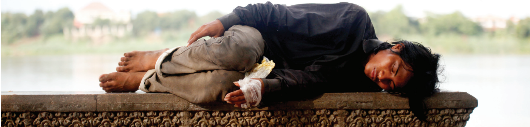
អ្នកប្រើប្រាស់ថ្នាំញៀនក្នុងរយៈពេលយូរហួតដល់ចាត់បង់សតិ និងអាចក្លាយជាជនអនាថាវាស់នៅតាមទីសាធារណៈ។

និងយាត់ខ្លួន ៣.២២០នាក់ ហើយសមត្ថកិច្ចបានកសាង សំណុំរឿងបញ្ជូនទៅតុលាការចំនួន ២៣២នាក់ បញ្ជូនទៅមណ្ឌលព្យាបាល និងស្ដារនីតិសម្បទាចំនួន ២.១០៥នាក់ និងអប់រំធ្វើកិច្ចសន្យាប្រគល់ជូនអាណាព្យាបាលយកទៅព្យាបាលបន្តរូបនៅតាមសហគមន៍ចំនួន ៤៨៣នាក់។ ដោយឡែកសមត្ថកិច្ចបានអនុវត្តដីកាបាន ១១០ដីកា និងយាត់ខ្លួន ១០៩នាក់។ សកម្មភាពបង្ក្រាបករណីធំៗ ដែលមានសារធាតុញៀនចាប់ពី ១គីឡូក្រាមទៅមានចំនួន២០ករណី ចាប់យកសារធាតុញៀនសរុប ២៤៤,៣៤ គីឡូក្រាម និងចាប់បានមេក្លោងចំនួន ១២នាក់ ខ្សែរយៈបណ្តាញចំនួន ៥២នាក់។