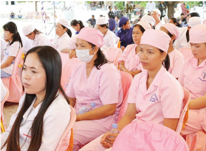
បុគ្គលិកមន្ទីរពេទ្យត្រូវបានទទួលការបណ្តុះបណ្តាលបន្ថែម។