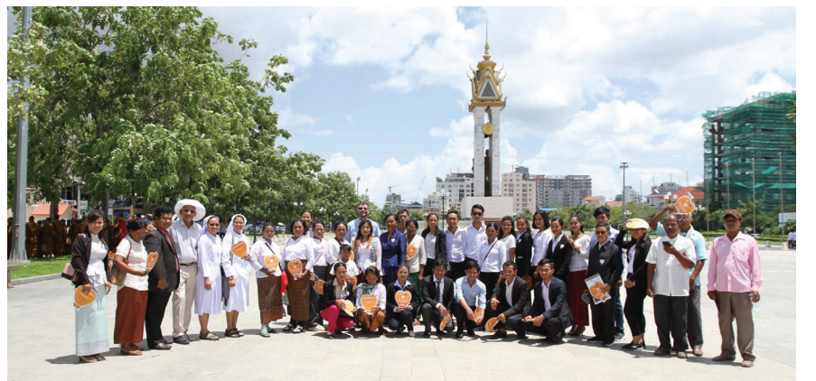
ព្រះសហគមន៍កាតូលិក និង គ្រីស្ទបរិស័ទដំណឹងល្អចរូបអនុស្សាវរីយ