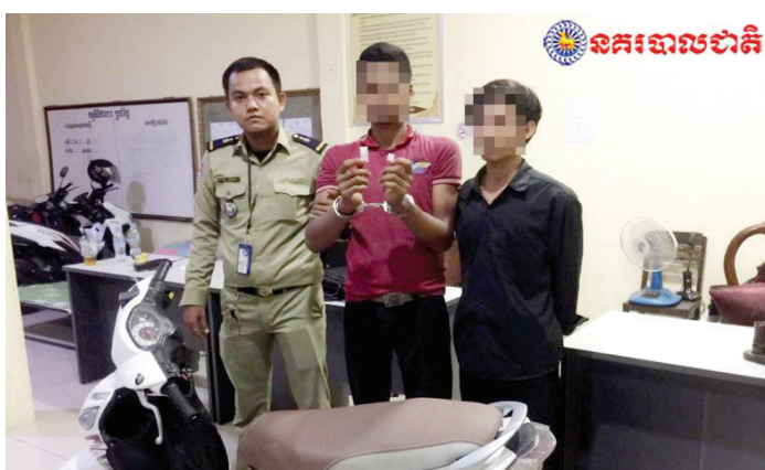
ជនសង្ស័យជួញដូរថ្នាំញៀន និងអ្នកប្រើប្រាស់ថ្នាំញៀនផ្សេងៗដែលត្រូវបានសមត្ថកិច្ចបង្ក្រាបបាននាពេលកន្លងមក។