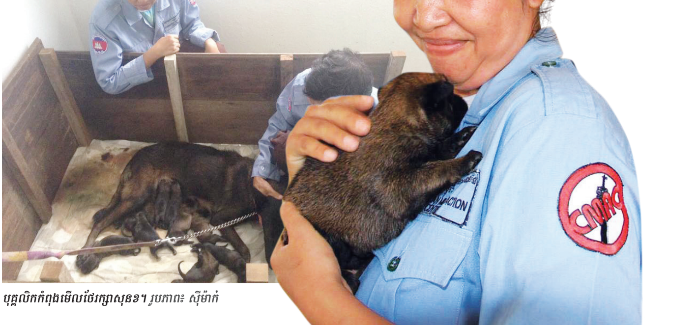
បុគ្គលិកកំពុងមើលថែរក្សាសុទ្ធជា។