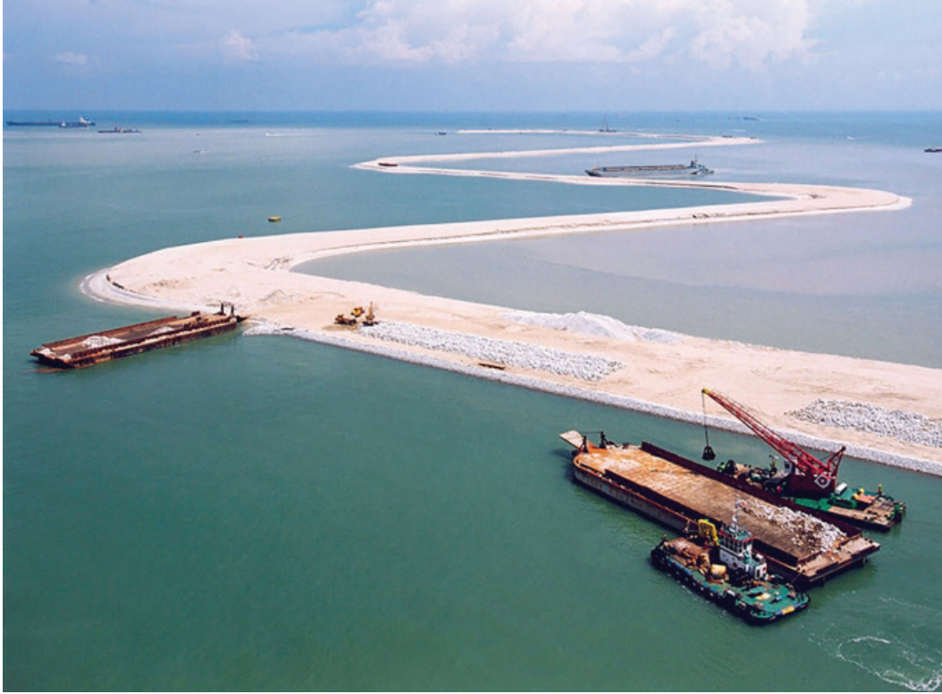
សកម្មភាពបូមខ្សាច់សម្រេចចាក់បំពេញតម្រូវការ។