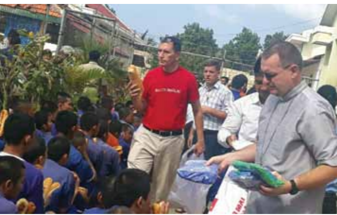
រូបភាព៖ ពន្ធនាគារកំពត