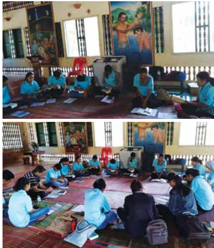
ការវិះគិតលើកថាព្រះវិះគិតអំពីការបង្រៀនអប់រំដំណើរដល់មនុស្សពេញវ័យ។