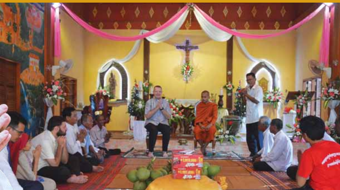
ព្រះសង្ឃ និងគណកម្មការអាចារ្យវត្ត អង្គមន្ត្រី និមន្ត និងអញ្ជើញមកព្រះវិហារកាតូលិក ដើម្បីអបអរសាទរហូណ្យព្រះយេស៊ូប្រសូត