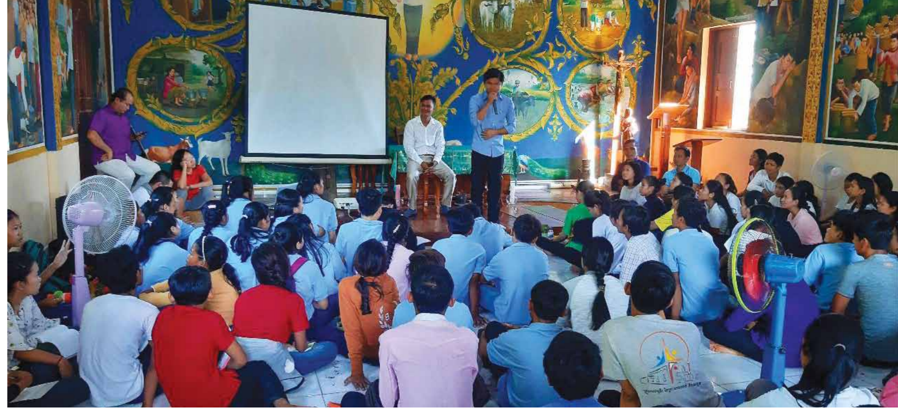
យុវជនកាតូលិកនៅព្រះសហគមន៍ភូមិភាគកំពង់ចាម ចូលរួមវគ្គបង្រៀនសម្រាប់អនាគតនៅព្រះសហគមន៍ចំណាក់។