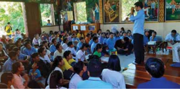
សកម្មភាពរបស់យុវជនក្នុងសិក្សាសាលាតម្រង់ទិសសិក្សា។

សិក្សាសាលានេះបានប្រព្រឹត្តទៅកាលពីថ្ងៃទី ០៧ មករា ឆ្នាំ២០១៩ នៅព្រះវិហារមេម៉ៅ ឃុំចំណោម ស្រុកអូរវាំងនំ ខេត្តក្រចេះ។ តាមប្រសាសន៍របស់លោកប្តីប្រពន្ធ ជាមួយ ប្តី ជាប្រធានទទួលបន្ទុកនៅក្នុងព្រះសហគមន៍ មេម៉ៅបានឲ្យដឹងថា ក្នុងកម្មវិធីសិក្សាសាលា នេះ គឺមាន៣ចំណុចសំខាន់ៗ ដើម្បីជួយដល់ សិក្សាការីវិះគិត ដែលមានដូចជា «អ្វីជាគោលដៅ នៃជីវិត?», «មួយវិញទៀត «ត្រូវមានគំនិតក្នុងការ គិតគូរពិចារណាក្នុងជីវិត» និងចំណុចមួយទៀត គឺ «ការវិនិយោគខ្លួនឯង»។ លោក ប្តី ប្រពន្ធទៀត ក្នុងសិក្សាសាលា នេះ គឺអ្នកចូលរួម ជាសិស្សថ្នាក់ទី១០ ដល់ថ្នាក់ ទី១២។ ចំពោះប្អូនៗថ្នាក់ទី១២ ត្រូវបានផ្តោត សំខាន់ ព្រោះគេត្រូវត្រៀមខ្លួនឲ្យបានល្អ ហើយ ត្រូវមានគោលដៅក្នុងការសិក្សាឲ្យបានត្រឹមត្រូវ គឺ «រៀនដើម្បីសម្រេចបាននូវចំណូលខ្លួនចង់ក្លាយ ជាអ្វីមួយនៅថ្ងៃអនាគត មិនមែនរៀនដើម្បីតែ ចេញផុតពីផ្ទះនោះទេ»។ ក្នុងកម្មវិធីសិក្សាសាលានេះ ណែនាំដោយ អង្គការគ្រួសារសន្តិភាព ព្រមទាំងមានសក្ខីភាព របស់លោកគ្រូបង្រៀនដែលជាជំនួយក្នុងការ សិក្សានៅភូមិមេម៉ៅផងដែរ។