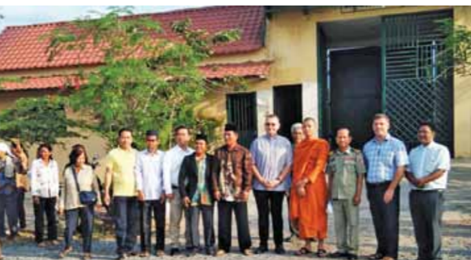
តំណាងសាសនាមួយៗ មកជួបអនុស្សាវរីយ៍នៅពន្ធនាគារខេត្តកំពត។

លោកអភិបាលបន្តថា ធម្មជាតិ តែងត្រូវការពន្លឺដើម្បីមានផ្លែ មានផ្កា ហើយជីវិតរបស់មនុស្សក៏ដូច្នោះដែរ។ គ្រប់ផ្ទៃផ្កាទាំងអស់ទទួលបានមកពី ទន្លេដែលយើងបានប្រព្រឹត្ត។ ក្នុងនោះដែរ លោកអភិបាលបាន ធ្វើការលើកទឹកចិត្តដល់អ្នករស់នៅ ក្នុងពន្ធនាគារទាំងអស់កុំភ័យសង្ឃឹម ប៉ុន្តែត្រូវចេះកែប្រែចិត្តគិត ត្រូវចេះ ពិចារណាទោសកំហុស និងត្រូវចេះ កែខ្លួនឱ្យបានប្រសើរឡើងវិញសម្រាប់ ពេលអនាគត។