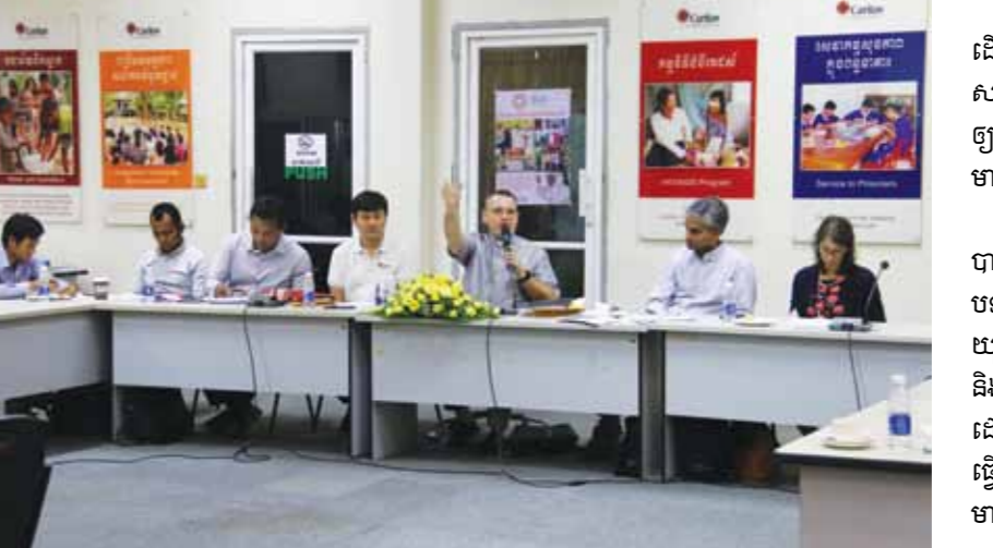
សមាជិកនៃសម្ព័ន្ធកាតូលិកដើម្បីមនុស្សរួម និងការអភិវឌ្ឍន៍។