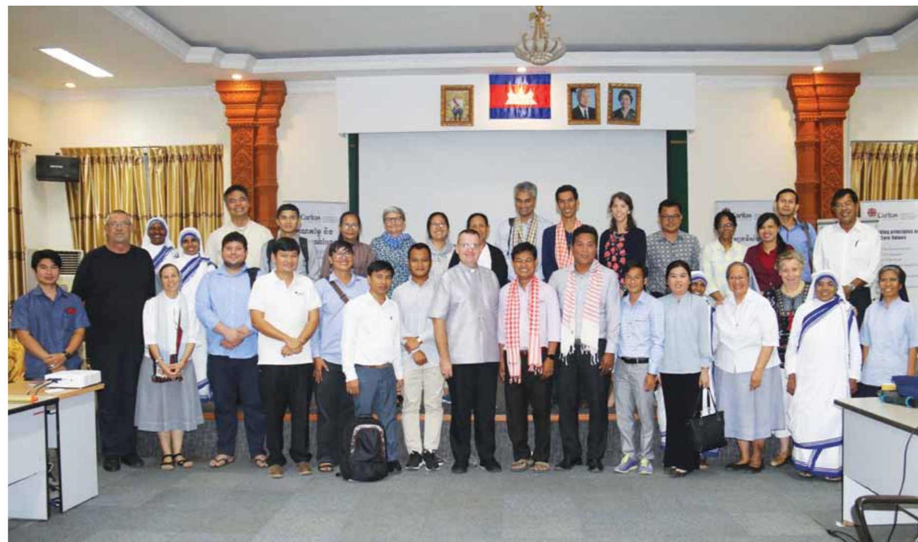
សមាជិកនៃសម្ព័ន្ធកាតូលិកដើម្បីមនុស្សរួម និងការអភិវឌ្ឍន៍ ជួបជុំគ្នាសំណាក់ធម៌អំពីបេសកកម្មនិងទិសដៅដើម្បីឆ្លើយតបនឹងសង្គម។