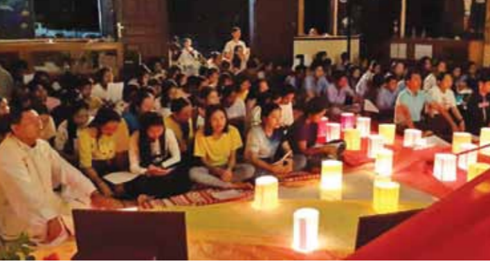
អធិដ្ឋានតាមបែបហេព្យដើម្បីបិទសិក្សាសាលាតម្រង់ទិសសម្រាប់យុវជន។

សិក្សាសាលានេះបានប្រព្រឹត្តទៅកាលពីថ្ងៃទី ០៧ មករា ឆ្នាំ២០១៩ នៅព្រះវិហារមេម៉ៅ ឃុំចំណោម ស្រុកអូរវាំងនំ ខេត្តក្រចេះ។ តាមប្រសាសន៍របស់លោកប្តីប្រពន្ធ ជាមួយ ប្តី ជាប្រធានទទួលបន្ទុកនៅក្នុងព្រះសហគមន៍ មេម៉ៅបានឲ្យដឹងថា ក្នុងកម្មវិធីសិក្សាសាលា នេះ គឺមាន៣ចំណុចសំខាន់ៗ ដើម្បីជួយដល់ សិក្សាការីវិះគិត ដែលមានដូចជា «អ្វីជាគោលដៅ នៃជីវិត?», «មួយវិញទៀត «ត្រូវមានគំនិតក្នុងការ គិតគូរពិចារណាក្នុងជីវិត» និងចំណុចមួយទៀត គឺ «ការវិនិយោគខ្លួនឯង»។ លោក ប្តី ប្រពន្ធទៀត ក្នុងសិក្សាសាលា នេះ គឺអ្នកចូលរួម ជាសិស្សថ្នាក់ទី១០ ដល់ថ្នាក់ ទី១២។ ចំពោះប្អូនៗថ្នាក់ទី១២ ត្រូវបានផ្តោត សំខាន់ ព្រោះគេត្រូវត្រៀមខ្លួនឲ្យបានល្អ ហើយ ត្រូវមានគោលដៅក្នុងការសិក្សាឲ្យបានត្រឹមត្រូវ គឺ «រៀនដើម្បីសម្រេចបាននូវចំណូលខ្លួនចង់ក្លាយ ជាអ្វីមួយនៅថ្ងៃអនាគត មិនមែនរៀនដើម្បីតែ ចេញផុតពីផ្ទះនោះទេ»។ ក្នុងកម្មវិធីសិក្សាសាលានេះ ណែនាំដោយ អង្គការគ្រួសារសន្តិភាព ព្រមទាំងមានសក្ខីភាព របស់លោកគ្រូបង្រៀនដែលជាជំនួយក្នុងការ សិក្សានៅភូមិមេម៉ៅផងដែរ។