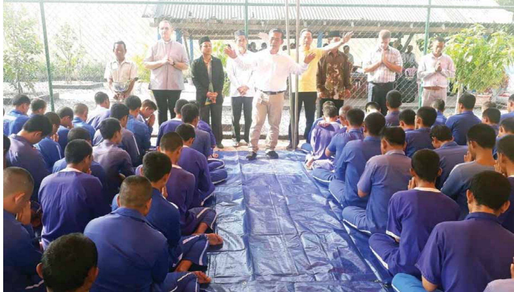
ព្រះសហគមន៍កាតូលិករួមនឹងសាសនាដទៃទៀត បានចូលរួមជុះសួរសុខទុក្ខអ្នកជាប់ឃុំនៅពន្ធនាគារខេត្តកំពត។