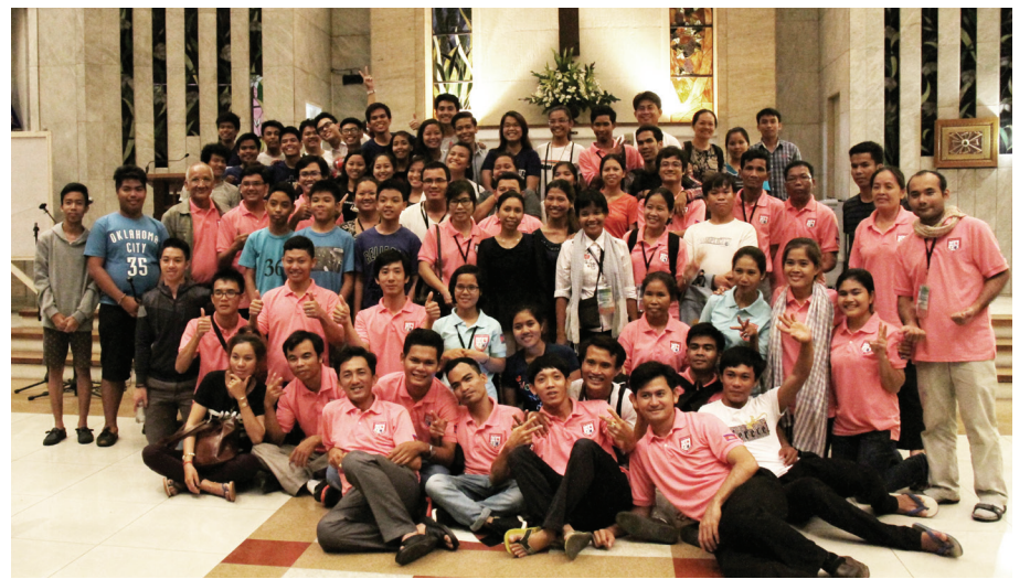
និស្សិតនៃសាលាអប់រំជំនឿ សន្ត យ៉ូស្ទីន

និស្សិតនៃសាលាអប់រំជំនឿ សន្ត យ៉ូស្ទីន (St. Justine School of Faith) ចំនួន៥០នាក់ បានរៀបចំកម្មវិធីដំណើរទស្សនកិច្ចសិក្សាទៅប្រទេសហ្វីលីពីន ដើម្បីស្វែងយល់អំពីជំនឿ និងរបៀបរស់នៅរបស់ប្រជាជនក្នុងប្រទេសនោះ ដែលភាគច្រើនជាគ្រីស្ទបរិស័ទកាតូលិក ។