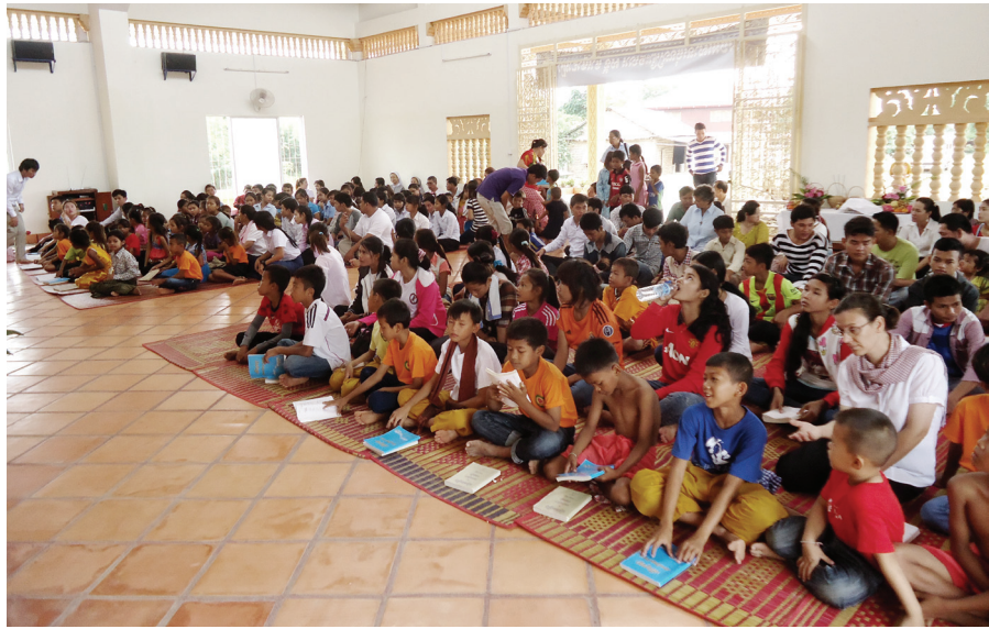
គ្រីស្ទបរិស័ទជួបជុំគ្នាដើម្បីរំលែកសន្តិម៉ារីម៉ាជាឡាជាឧបការី។ សុភាព

ក្រុមគ្រីស្ទបរិស័ទ ប្រមាណជាង ២០០នាក់ បានរួមគ្នាដង្ហែរសំណាក សន្តិម៉ារីម៉ាជាឡា ដែលជាឧបការី នៃ ព្រះវិហាររបស់ខ្លួន ចូលក្នុងព្រះវិហារជា ការរំលែកអំពីជំនឿ ដែលសន្តិបនេះបាន ធ្វើ។ ពិធីនេះបានធ្វើឡើង កាលពីថ្ងៃ ទី២៦ ខែកក្កដាកន្លងទៅ នៅព្រះវិហារ សន្តិម៉ារីម៉ាជាឡា នៃព្រះសហគមន៍