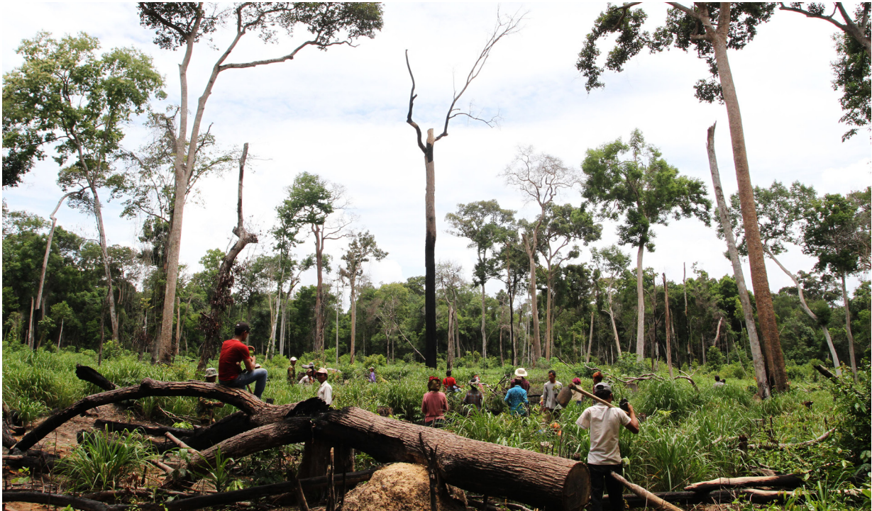
ប្រជាសហគមន៍និងបុគ្គលិកអង្គការជេស៊ីតស៊ីសកម្ពុជាដាំដើមឈើនៅតំបន់ព្រៃឡង់ ក្នុងខេត្តកំពង់ធំ។