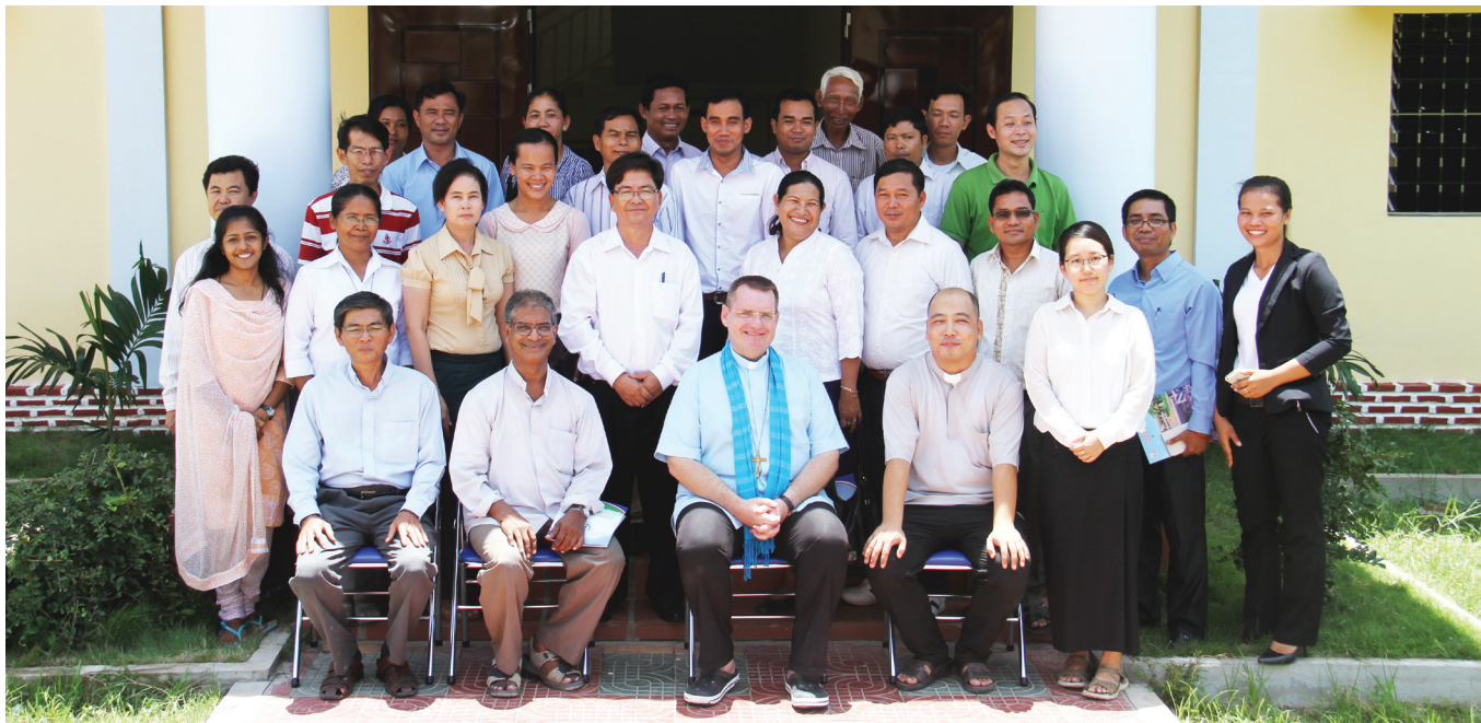
លោកគ្រូអ្នកគ្រូ និងគណៈគ្រប់គ្រងសាលាចតុបអនុស្សាវរីយ៍។