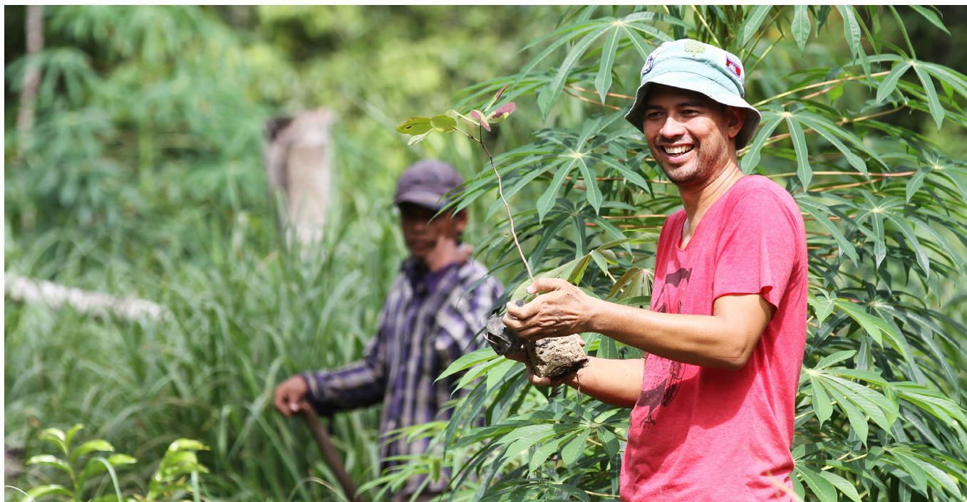
លោកបូជាបាព្យខ្មែរនីស កាព្រីអែល ឡើង (កាប៊ី)

កាលពីថ្ងៃទី១៨ មិថុនា សម្តេចប៉ាប ហ្វ្រង់ស៊ីស្កូ បានប្រកាសសារលិខិតជា លើកទីពីរជា "ឡាវ៉ាតូ ស៊ី" ពាក្យនេះ ជាភាសា អ៊ីតាលីមានន័យថា "សូមកោត សរសើរព្រះជាម្ចាស់" ជាមួយក្នុងពាក្យ អធិដ្ឋានរបស់សន្តប្រុងស៊ីស្កូ នៅអាស៊ី ស៊ី។ សារលិខិតនេះ មិនមែនសម្រាប់តែ ព្រះសហគមន៍តូលិកប៉ុណ្ណោះទេ គឺ "ដល់ មនុស្ស ដែលរស់នៅលើផែនដីទាំងមូល នេះ" ហើយនេះ ជាលើកទីមួយ ដែល សារលិខិតនេះ និយាយផ្តោតទៅលើ បរិស្ថាន។ នៅខាងក្រោមនេះ មាន៨ ចំណុចដែលសម្តេចប៉ាប បាននិយាយមក កាន់យើងនៅក្នុងស្រុកខ្មែរ។