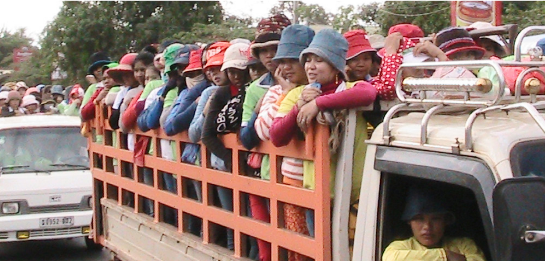
កម្មករ-ការិនី ធ្វើដំណើរមកផ្ទះដោយឡានឈ្នួលដឹកទំនិញ ។