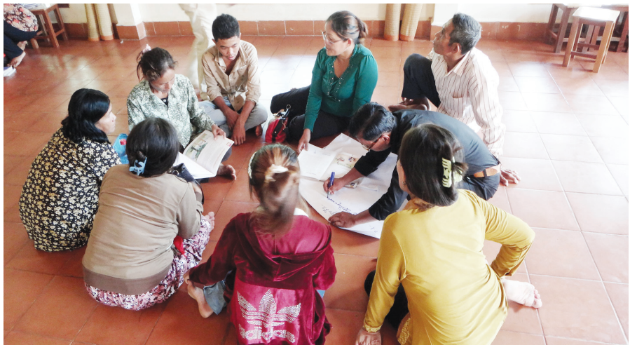
សំណាក់ធម៌ពង្រឹងជំនឿដល់ចាស់ៗនៅព្រះសហគមន៍តំបន់កំពង់ចាម។

សម្បុរ និងពូជសាសន៍អ្វីឡើយ។ លោក បន្ថែមថា ជាពិសេសនោះគឺចង់ ឲ្យពួក គាត់យល់ថា យើងទាំងអស់គ្នា គឺប្រៀប ដូចជនជាតិអឺរ៉ុបស្រាវស្រាយ ក្នុង គម្ពីរដែលបានរងរបួសធ្ងន់ គឺយើងនេះ ហើយ ដែលរងរបួសធ្ងន់ ដោយសារអំពើ បាបរបស់យើង ហើយព្រះយេស៊ូ បាន បន្ទាបខ្លួនព្រះអង្គផ្ទាល់ ដើម្បីស្រលាញ់ យើង និងសង្គ្រោះយើងទាំងអស់គ្នា រហូតមកដល់សព្វថ្ងៃនេះ។ គាត់បាន បន្ថែមថា ដូចនេះ យើងជាគ្រីស្ទបរិស័ទ មានតួនាទី ស្រលាញ់គ្រប់មនុស្សទាំង អស់ដោយមិនប្រកាន់អ្វីឡើយ។ ក្នុងកម្មវិធីនេះ បានរៀបចំដូចជា ការអប់រំអំពីធម៌មេត្តាករុណា ការចែក ជាប្រក្រតិយក្នុង ដើម្បីរិះគិត និងសំណួរ