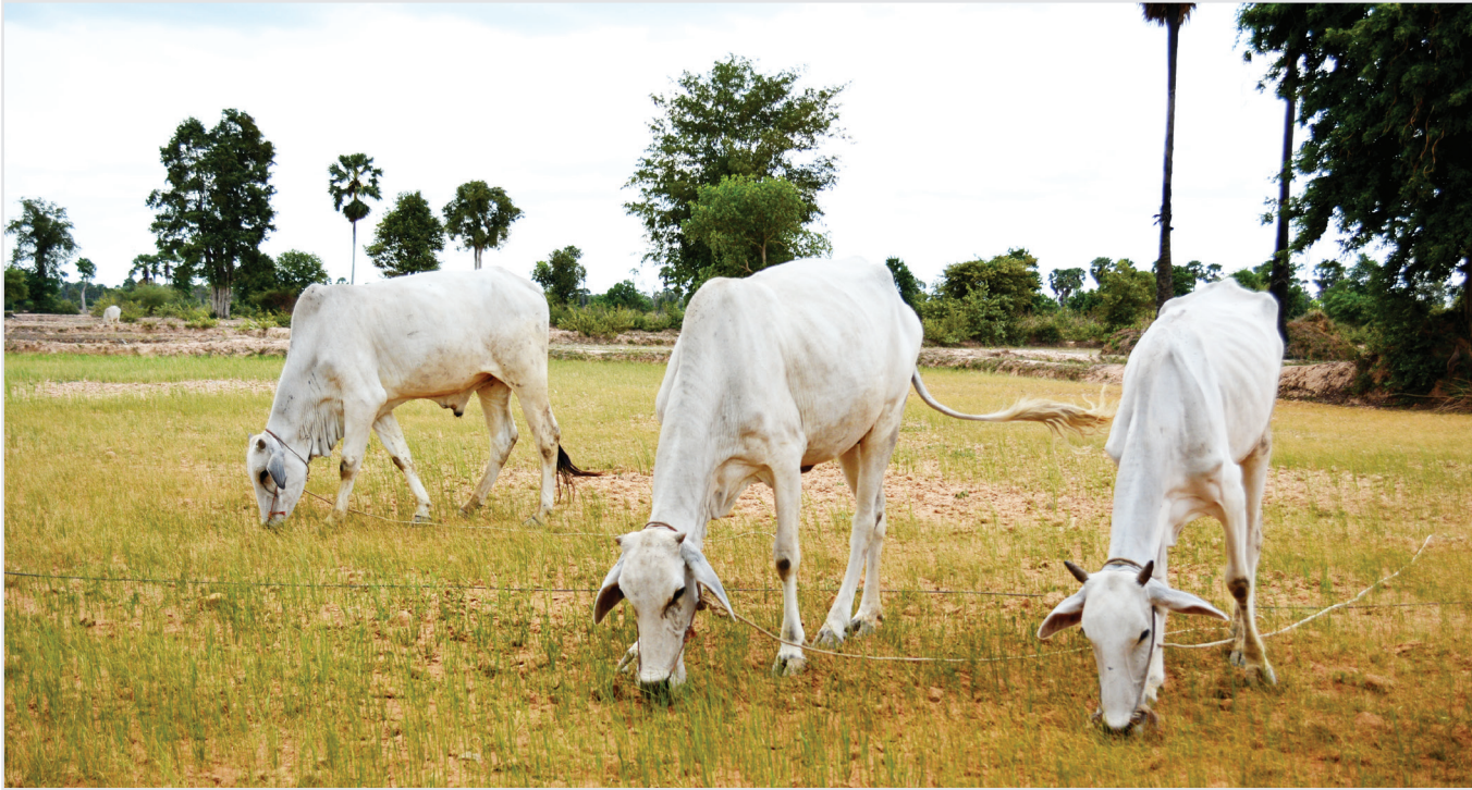
គោកំពុងស៊ីសំណាបដែលក្រៀមស្វិតដុះនៅតាមស្រែដែលគ្មានទឹកនៅក្នុងខេត្តកំពង់ស្ពឺ (កក្កដា ២០១៥)។