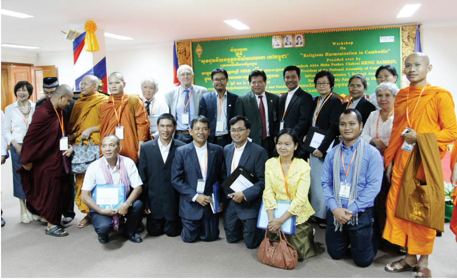
តំណាងសាសនាចំនួនបួនជុំគ្នាជាអនុស្សាវរីយ៍។ សហការី

"បើចង់គោរពព្រះរបស់យើង យើងត្រូវគោរពមនុស្ស"។ នេះជាសំដីរបស់លោកបូជាចារ្យកាតូលិក នៅក្នុងសិក្ខាសាលា ស្តីពីសុខដុមនីយកម្ម ក្នុងវិស័យសាសនានៅកម្ពុជា ដែលរៀបដោយគណៈកម្មការទី៧នៃរដ្ឋសភា កាលពីថ្ងៃទី៣០ ខែកក្កដា ដែលមានតំណាងព្រះពុទ្ធសាសនា គ្រិស្តសាសនា និង ឥស្លាមសាសនា ប្រមាណជាង ២០០នាក់ ។