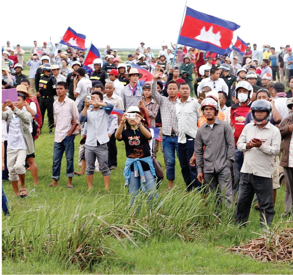
ប្រជាពលរដ្ឋនិងតំណាងរាស្ត្រនាំគ្នាទៅពិនិត្យព្រំដែនកម្ពុជាវៀតណាម។

" កិច្ចការដោះស្រាយបញ្ហាព្រំដែននេះ ទាមទារ ពេលវេលា និងការជជែកគ្នាច្រើន ដើម្បី កុំឲ្យវាមានទំនាស់ "