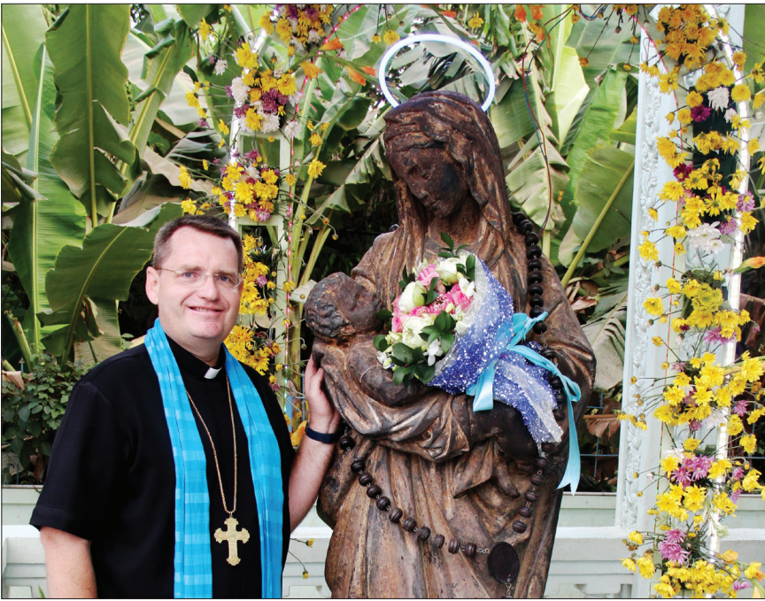
លោកអភិបាលចូលរួមជាអធិបតីក្នុងពិធីរំលឹកខួបពីរឆ្នាំនៃការស្រង់រូបសំណាកព្រះមាតានៃទន្លេមេគង្គ ។