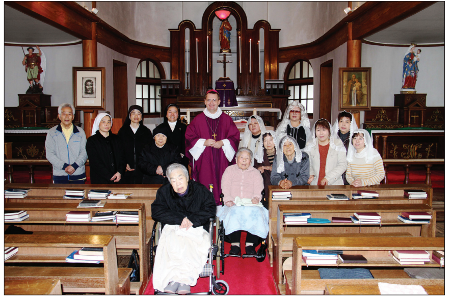
រូបជុំគ្នារបស់លោកអភិបាលអូលីវីយេនិងគ្រីស្ទបរិស័ទនៅដប៉ុន ។