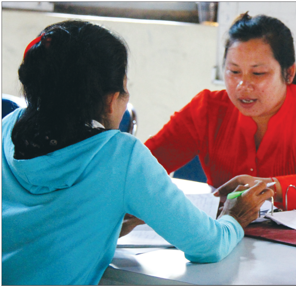
ស្ត្រី និងកូន អ្នកភូមិការ ផ្ទុកមេរោគអេដស៍មកទទួលការប្រឹក្សាយោបល់អំពី

លោកបន្តថា ជីវភាពពួកគាត់យ៉ាប់ ដោយសារតែភាគច្រើននៃគ្រួសារតែផ្ទុកគឺភាគច្រើនជាជនបង្គោល