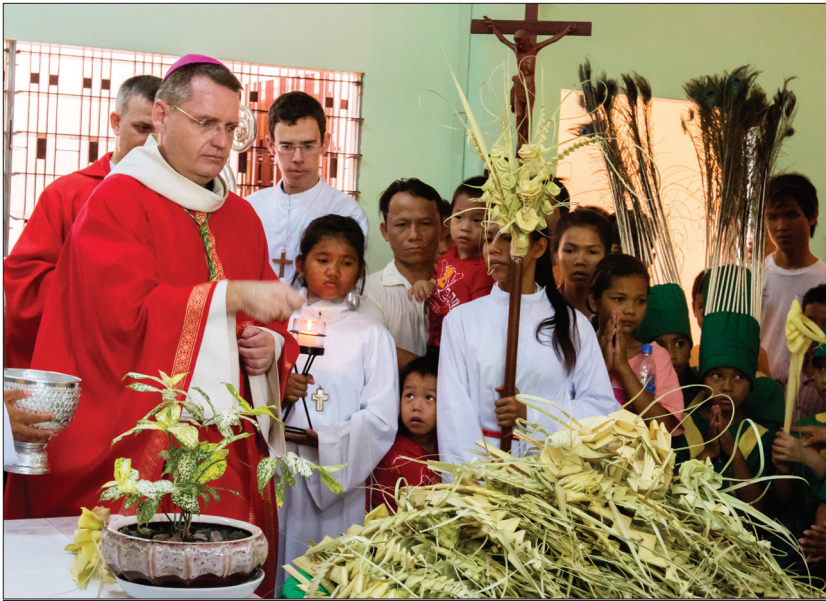
ពិធីហែស្លឹកនៅព្រះសហគមន៍ព្រះកុមារយេស៊ូ(បឹងទំពុន) ។

គ្រីស្ទបរិស័ទប្រមាណជាង ៣០០ នាក់ បានមកចូលរួមពិធី ហែស្លឹក ដែលជាពិធីរំលឹកដល់ព្រះយេស៊ូវយាង ចូលក្រុង យេរូសាឡឹម ដើម្បីរងទុក្ខ លំបាក ក្រោមអធិបតីភាពលោកអភិ- បាលភូមិភាគភ្នំពេញ អូលីវីយេ ដ្ឋិត