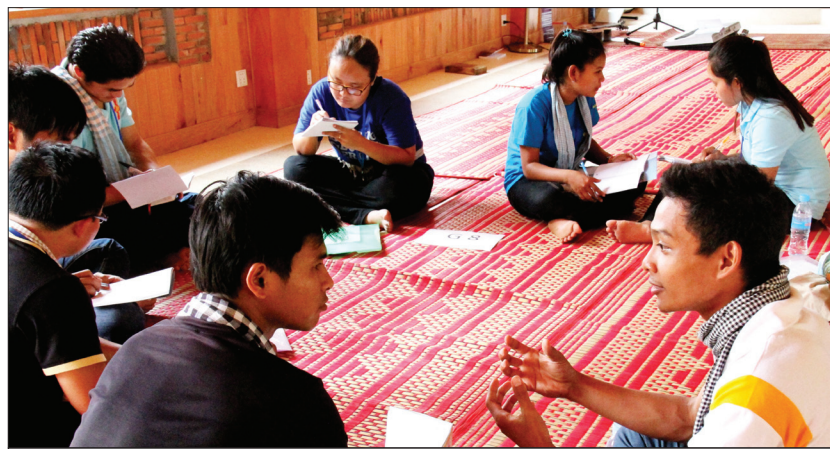
យុវជនបំបែកជាក្រុមតូចៗចែករំលែកអំពីព្រះបន្ទូល។