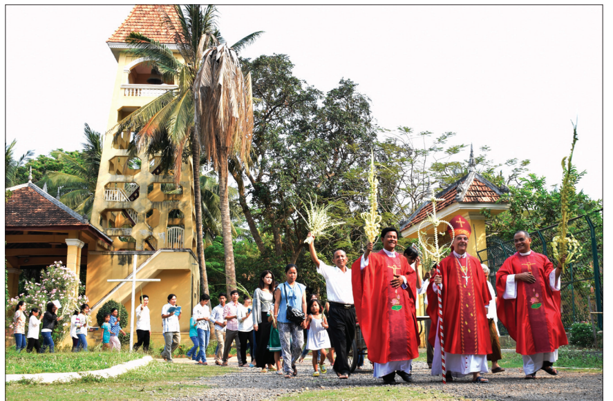
បុណ្យហែស្លឹកនៅព្រះសហគមន៍បាត់ដំបង ។