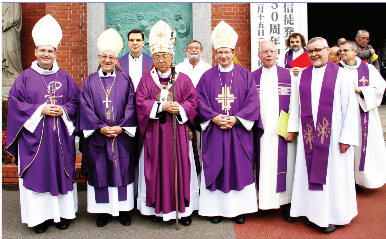
លោកអភិបាលថតរូបអនុស្សាវរីយ៍ក្នុងឱកាសចូលរួមបុណ្យខួបទី១៥០ឆ្នាំ នៃការរកឃើញគ្រីស្ទបរិស័ទ នៅទីក្រុងណាហ្គាសាគី

តាមការអញ្ជើញរបស់លោក យ៉ូសែប មីតស៊ូអាគី តាកាមី (Joseph Mitsuaki Takami) ជាអភិបាលព្រះសហគមន៍កាតូលិកភូមិភាគណាហ្គាសាគីប្រទេសជប៉ុន លោកអូលីវ័យ ជាអភិបាល នៃព្រះសហគមន៍កាតូលិកភូមិភាគភ្នំពេញ ប្រទេសកម្ពុជា បានអញ្ជើញចូលរួមបុណ្យខួប១៥០ឆ្នាំ នៃការរកឃើញគ្រីស្ទបរិស័ទនៅទីក្រុងណាហ្គាសាគី ប្រទេសជប៉ុនកាលពីថ្ងៃទី ១៤ ដល់ថ្ងៃទី១៧ ខែមីនា ឆ្នាំ