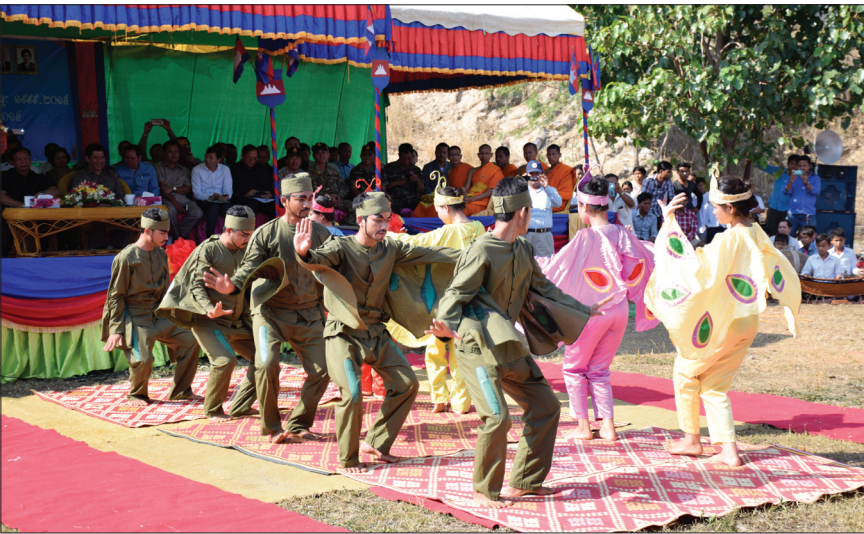
ទិវាយល់ដឹងពីគ្រាប់មីននៅប៉ៃលិន (ចូលរួមពីសិស្សមណ្ឌលអារ៉ូពេ) ។