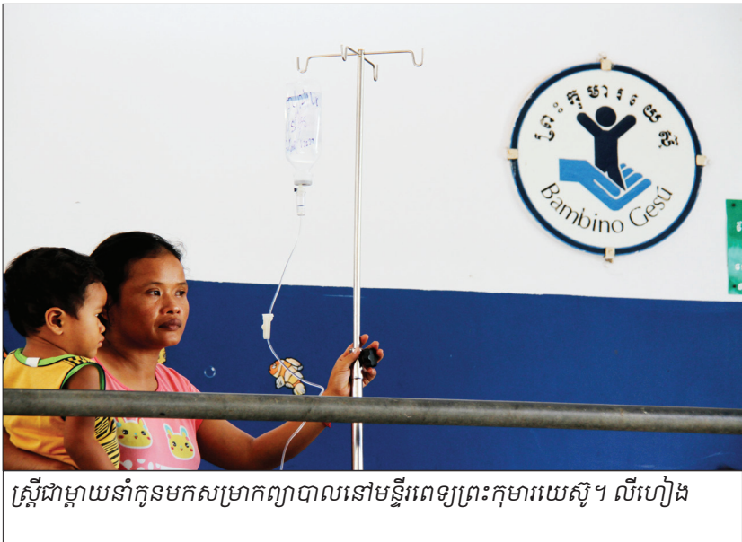
ស្ត្រីជាម្តាយនាំកូនមកសម្រាកព្យាបាលនៅមន្ទីរពេទ្យព្រះកុមារយេស៊ូ។ លីហៀង

មន្ទីរពេទ្យព្រះកុមារយេស៊ូ នៃសន្ត អាសនៈ ដែលមានទីតាំងនៅក្នុងខេត្ត តាកែវ មានសេវាកម្មទទួលកុមារគ្រប់ ស្រទាប់វណ្ណៈទាំងអស់ និងគ្រប់ទីកន្លែងដើម្បីមកពិនិត្យ និងព្យាបាលជំងឺ ដោយសហការណ៍ជាមួយ មន្ទីរពេទ្យ បង្អែកខេត្តតាកែវ។ សេវាកម្មទាំងនោះ បានជួយដល់កុមារជាច្រើន ពាន់នាក់ ក្នុងមួយឆ្នាំ។