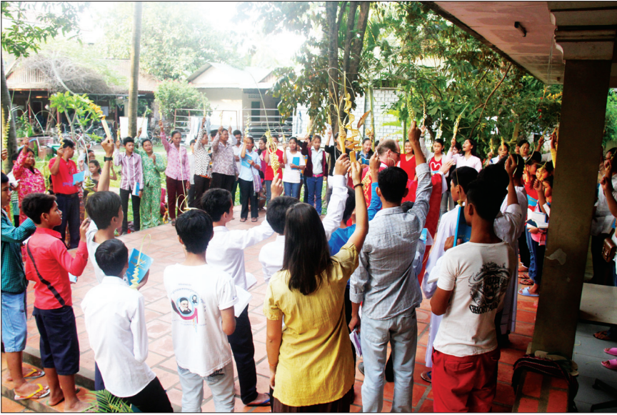
គ្រីស្ទបរិស័ទនៅកំពុងចាមក្រុងធ្វើពិធីហែស្លឹកកាលពីថ្ងៃទី២៩ មីនា ។