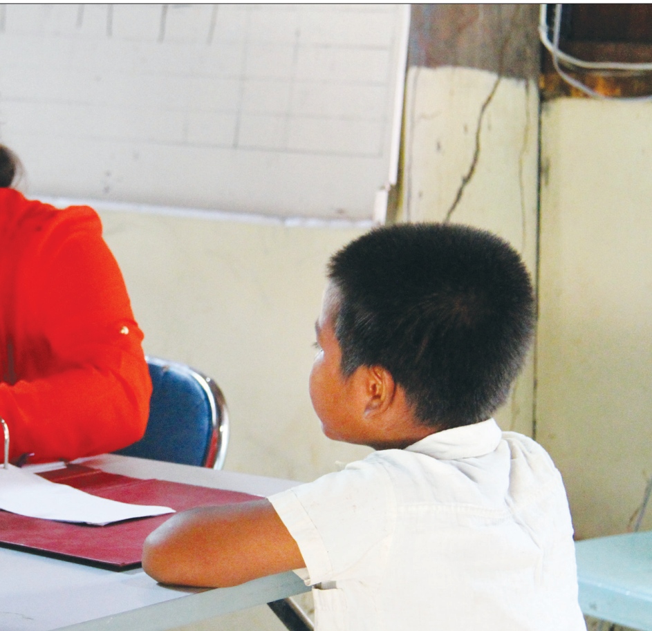
ការថែរក្សាសុខភាព ពីមន្ត្រីអង្គការក្រៅរដ្ឋាភិបាលមួយ ។ ដោយលី សុវណ្ណា

គាត់ក្រោយពេលទទួលបានលទ្ធផលឈាម គឺគួរឲ្យរន្ធត់ ម្នាក់ៗគ្មានអ្វីក្រៅពីទឹក ភ្នែក អ្នកខ្លះយំសឹងតែបោកខ្លួន" ។