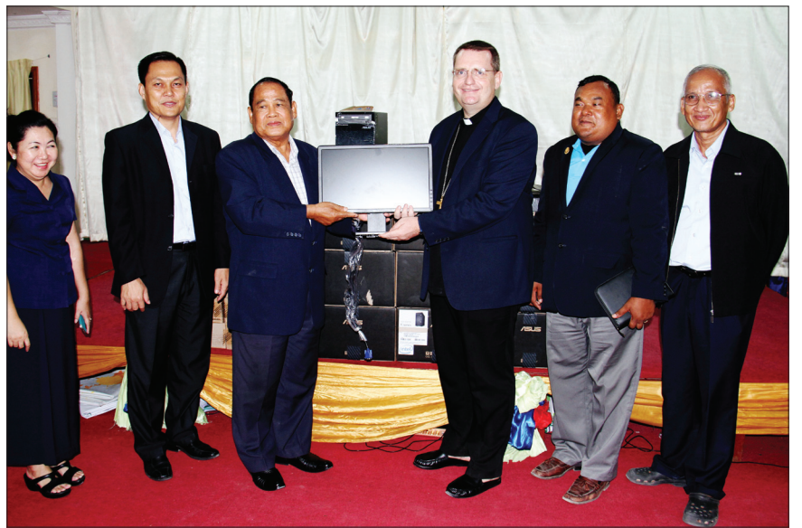
លោកអភិបាលអូលីវីយេជូនកុំព្យូទ័រចំនួន១០គ្រឿង ទៅរដ្ឋមន្ត្រីក្រសួងធម្មការនិងសាសនា ។