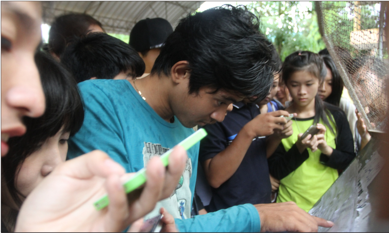
សិស្សប្រឡងមធ្យមសិក្សាទុតិយភូមិមើលលទ្ធផលប្រឡងឆ្នាំ២០១៤ ។

អាជ្ញាធរកម្ពុជា នាពេលបច្ចុប្បន្ននេះ ជាពិសេសគឺក្រសួងអប់រំ យុវជន និង កីឡា កំពុងតែអនុវត្តការតម្រង់ទិសរបស់យុវជន ប៉ុន្តែទោះបីជាយ៉ាងណាក៏ដោយ ទិសដែលក្រសួងបានតម្រង់ត្រូវបានយុវជន និងសាស្ត្រាចារ្យមួយចំនួនអះអាងថា គឺហាក់ដូចជាស្រពិចស្រពិលសម្រាប់ពួកគេ ។ ការតម្រង់ទិសនេះ ត្រូវបានក្រសួងអប់រំ យុវជន និងកីឡា គឺកំពុងតែដាក់ចេញ ដើម្បីអនុវត្តកំណែទម្រង់ការអប់រំនៅកម្ពុជា តាំងពីមុនឧត្តមហូតដល់ក្រោយឧត្តមសិក្សាដើម្បីឲ្យឆ្លើយតបនឹងទិដ្ឋភាពការងារ និង តម្រូវការនៃការអភិវឌ្ឍសេដ្ឋកិច្ច ដោយព្យាយាមពន្យល់ណែនាំមាត់ ឲ្យសិស្សានុសិស្សងាកមកសិក្សា លើកផ្នែកជំនាញបច្ចេកទេស ខណៈដែលបច្ចុប្បន្ននេះ យុវសិស្សនៅកម្ពុជាគឺភាគច្រើនផ្ដោតតែនៅលើមុខវិជ្ជា ក្នុងវិស័យធុរកិច្ចផ្សេងៗ ដែលមានដូចជា ជំនាញគ្រប់គ្រង គណនេយ្យ ធនាគារ និងហិរញ្ញវត្ថុ ទីផ្សារ ទេសចរណ៍ ច្បាប់ ពាណិជ្ជកម្ម ។ល។ ជុំវិញបញ្ហានេះ សាស្ត្រាចារ្យវិទ្យាល័យទួលទំពូងមួយរូប ដែលសុំមិនបញ្ចេញឈ្មោះបានឲ្យដឹងថា ក្រោយ