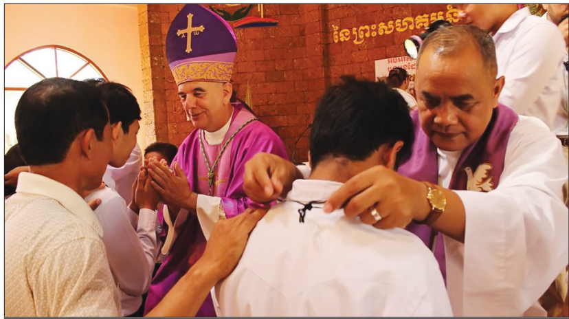
បេក្ខជនទទួលពិធីត្រាស់ហៅយ៉ាងឱឡារិកពីលោកអភិបាលគឺគេ។

បុត្រជីតារបស់ព្រះជាម្ចាស់ឲ្យចូលរួម ក្នុងព្រះសហគមន៍ របស់ព្រះអង្គដែរ។ ក្នុងជីវិតរបស់បងប្អូនម្នាក់ៗ តែងតែ ជួបនូវការលំបាក និងជួបឧបសគ្គនា នាប៉ុន្តែសូមឲ្យបងប្អូនភ្ជាប់ជីវិតរបស់ ខ្លួនជាមួយព្រះយេស៊ូ។ ដោយសារពេលនេះ ព្រះសហ- គមន៍កាតូលិកស្ថិត នៅក្នុងរដូវត្រណាម លោកអភិបាល ក៏បានមានប្រសា- សន៍ទៅកាន់បងប្អូនថ្មីៗទាំងនោះ ឲ្យ ប្រែចិត្តគំនិត ដើម្បីយើងចូលរួមជា មួយព្រះយេស៊ូ ដែលបានសោយទី- វង្គត និង មានព្រះជន្មរស់ឡើងវិញ នាឱកាសថ្ងៃបុណ្យចម្លងនេះ។ ក្នុងឱកាសនេះ លោកអភិបាល ក៏ បានរំលឹកដល់បងប្អូនជាគ្រីស្ទបរិស័ទ ដែលបានចូលរួម ក្នុងពិធីត្រាស់ហៅ នាពេលនេះ ឲ្យយកចិត្តទុកដាក់ជួយ គាំទ្រដល់អស់បងប្អូនដែល ទើបតែ បានទទួលពិធីត្រាស់ហៅនាពេលនេះ ដោយជួយអធិដ្ឋាន សម្រាប់ពួកគេ ដើម្បីឲ្យគេ មានជំនឿកាន់តែមាំមួន ឡើងៗព្រមទាំងជួយ ឲ្យបងប្អូនទាំង នោះឲ្យធ្វើដំណើរទៅមុខទៀត ដោយ ធ្វើជីវិតលើព្រះអង្គ និង ជំនះនូវរាល់