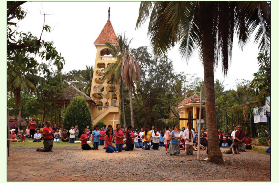
ពិធីដើរផ្លូវព្រះឈើឆ្កាងនៅព្រះសហគមន៍កាតូលិកបាត់ដំបង