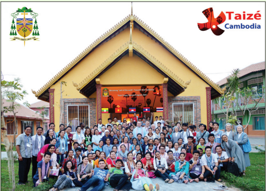
រូបថតអនុស្សាវរីយ៍ របស់សិក្ខាកាមដែលចូលរួមសំណាក់ធម៌តេហ្សូ សម្រាប់អាស៊ីអាគ្នេយ៍