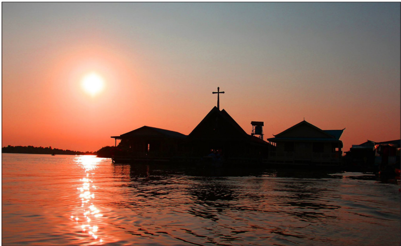
ព្រះវិហារសន្តអន់តូនីឆ្នុកទ្រូ ។

ប្តូរទីកន្លែងនេះ ទាំងព្រះសហគមន៍ និងគ្រីស្ទបរិស័ទ ត្រូវសម្របក្នុងជីវ- ភាពថ្មីលើដីគោក ព្រោះពួកគេធ្លាប់ រស់នៅលើទូក ក្នុងភូមិឆ្នុកទ្រូនេះ ខ្លះ ២៥ឆ្នាំ ខ្លះ៣០ឆ្នាំ គឺពួកគេរស់នៅ តាំងពីកំណើតរបស់គេ ។ ហេតុនេះ បញ្ហាប្រឈមនានា នឹងកើតឡើង គ្រប់ពេល ។ តែលោកថា ៖ "យើងត្រៀម ខ្លួនរួចរាល់ហើយ" ។ លោកនៅតែប្រ- កបបរលើទូកដដែល ទំរាំអាចសម្រប ខ្លួននឹងជីវភាពលើដីគោកបាន ។