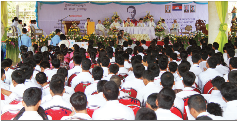
លោកអភិបាលកំពុងចូលរួមពិធីខ្ទប់កំណើតទី២០០ឆ្នាំ របស់សន្តយ៉ូហាន បូស្កូ។

ក្រុមគ្រួសារ សាលេស៊ានដុនបូស្កូ និង សិស្សានុសិស្សទាំងឡាយ នៃ សាលាដុនបូស្កូ ទូទាំងព្រះរាជាណា ចក្រកម្ពុជា បានប្រារព្ធខ្ទប់កំណើតទី ២០០ឆ្នាំរបស់សន្តយ៉ូហានបូស្កូដែល ជាស្ថាបនិកក្រុមសាលេស៊ាន ហើយ គេតែងតែចងចាំថា ជាមនុស្សម្នាក់ ដែលបូជាជីវិតរបស់ខ្លួន ដើម្បីបម្រើ យុវជនដែលគ្មានទីពឹង។