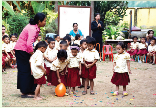
ទិវានារីអន្តរជាតិ នៅសាលាមត្តេយ្យពន្លកថ្មីនៃព្រះសហគមន៍កាតូលិកបាត់ដំបង