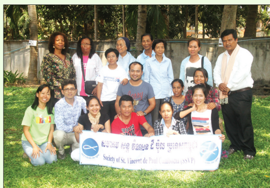
សមាគមសន្តិសុខសង្គមដំបូលប្រជុំប្រចាំឆ្នាំ ដើម្បីវាយតម្លៃ និងរៀបចំផែនការក្នុងឆ្នាំ២០១៥ នៅព្រះសហគមន៍ភូមិភាគកំពង់ចាម កាលពីថ្ងៃទី៨-៩មីនា ។