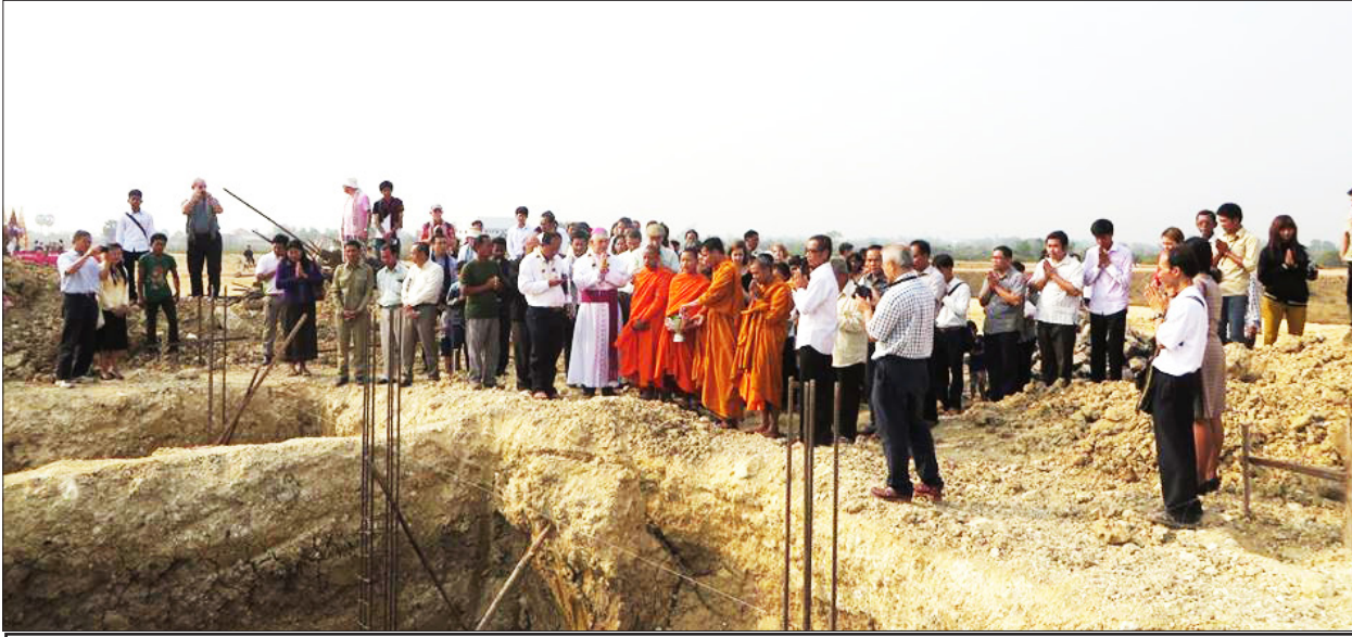
លោកអភិបាលគីគេ និងព្រះសង្ឃប្រោះទឹកព្រះពរលើគ្រឹះអាគារសាលាជេស៊ីតសន្តសារីយ៉េ ។

ក្រុមគ្រួសារ សហជីវនព្រះយេស៊ូ នៅកម្ពុជា តាមរយៈអង្គការមេត្តាករុណា (ជេស៊ីតស៊ីវិល) បានដំណើរការគម្រោងបង្កើត សាលាអប់រំចំណេះទូទៅ ដែលមានឈ្មោះថា សាលាជេស៊ីតសន្តសារីយ៉េ ដែលស្ថិតនៅភូមិភ្នំបាក់ សង្កាត់ទឹកថ្លា ក្រុងសិរីសោភ័ណ្ឌ ខេត្តបន្ទាយមានជ័យ ។