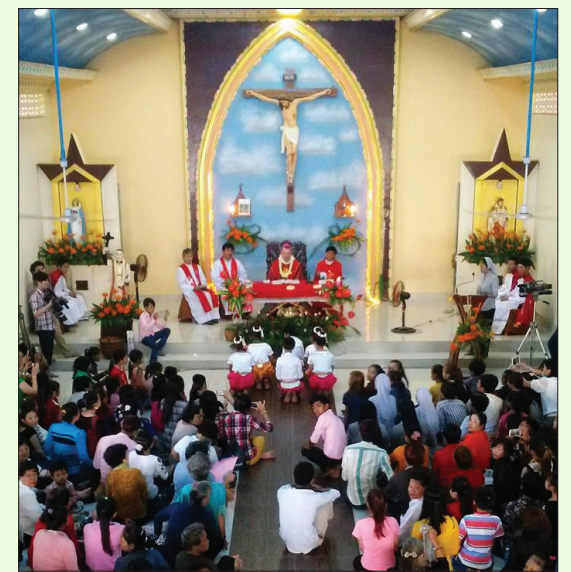
ពិធីបុណ្យរំលឹកខួបលោកបូជាបារ្យ ប៊ូយ៉េប