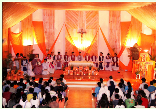
អធិដ្ឋានពេញមួយយប់សម្រាប់ការត្រាស់ហៅនៅភ្នំពេញថ្មី