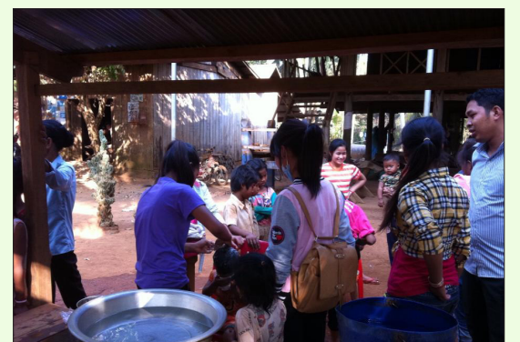
ក្រុមយុវជនកាតូលិកកក់សក់សំលាប់ចៃដន្យ កុមារតាមភូមិ ។