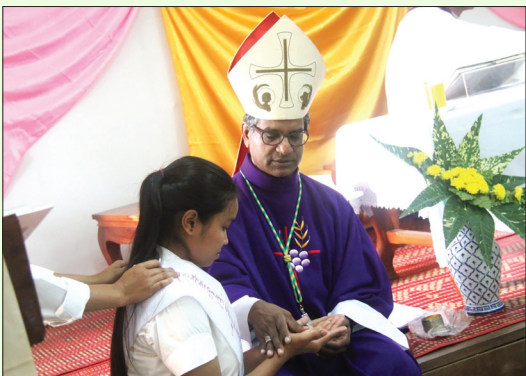
លោកអភិបាលអនុគ្រូនីសាមីយកប្រេងក្រអូបគូសសញ្ញាឈើឆ្កាងលើដៃបេក្ខជន ដែលទទួលពិធីត្រាស់ហៅ ។