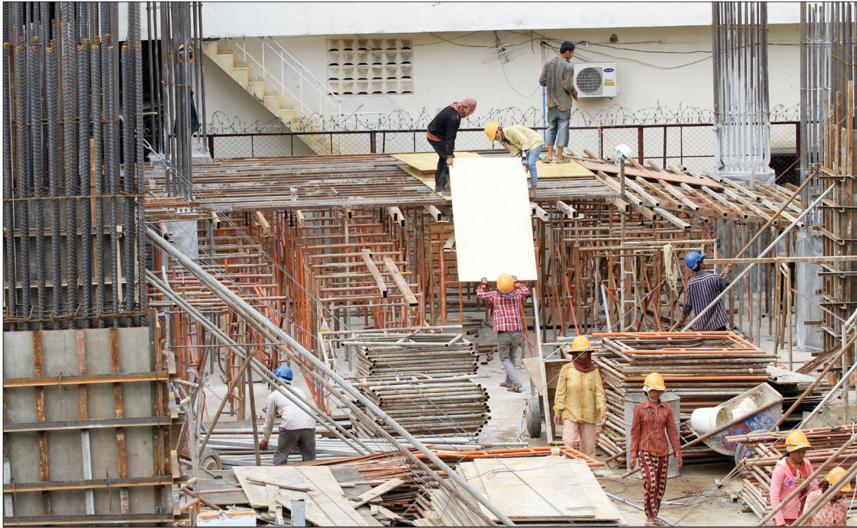
កម្មករសំណង់កំពុងធ្វើការនៅការដ្ឋានមួយកន្លែងក្នុងទីក្រុងភ្នំពេញ ។