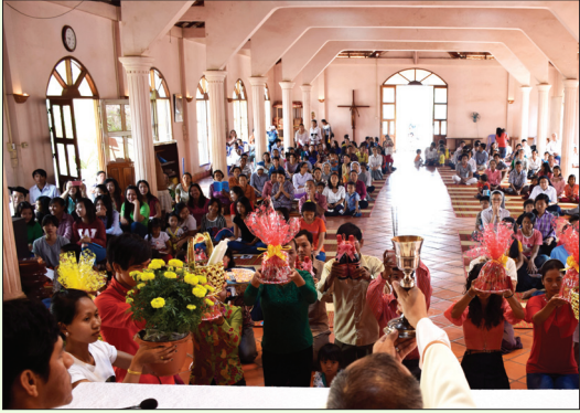
ពិធីចូលផ្ទាំងបងប្អូនជនជាតិចិន និង វៀតណាម នៅព្រះសហគមន៍កាតូលិកបាត់ដំបង