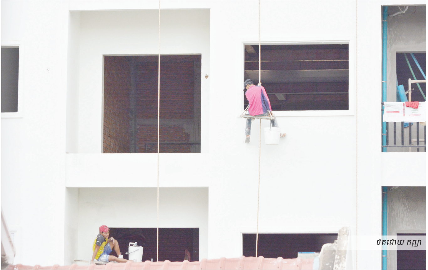
ថតដោយ កញ្ញា