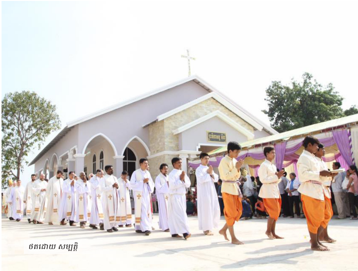
ថតដោយ សម្បត្តិ